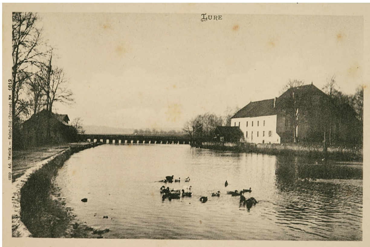
Lure. Moulin du Magny-Vernois.