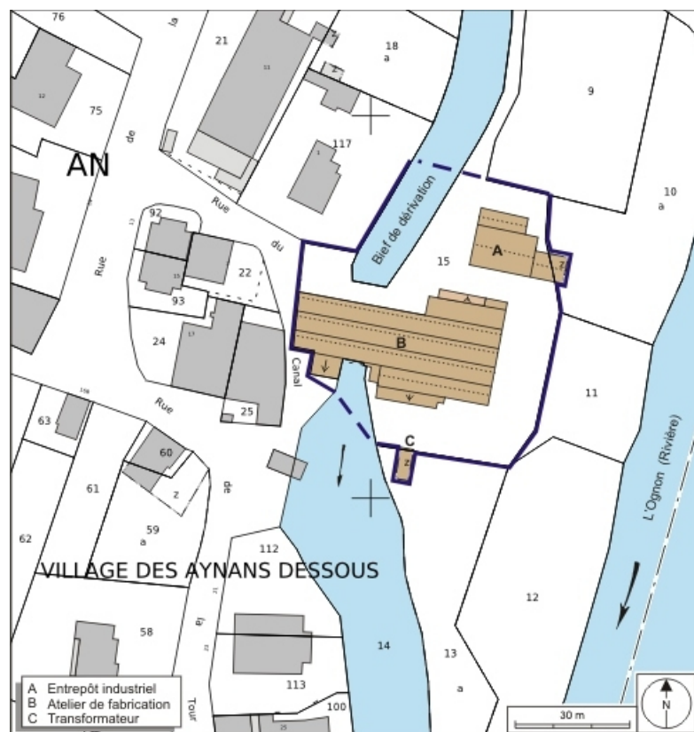
Plan-masse et de situation. Extrait du plan cadastral numérisé, 2008, section AN, 1:1000. Source : Direction générale des Finances Publiques - Cadastre ; mise à jour : 2008.