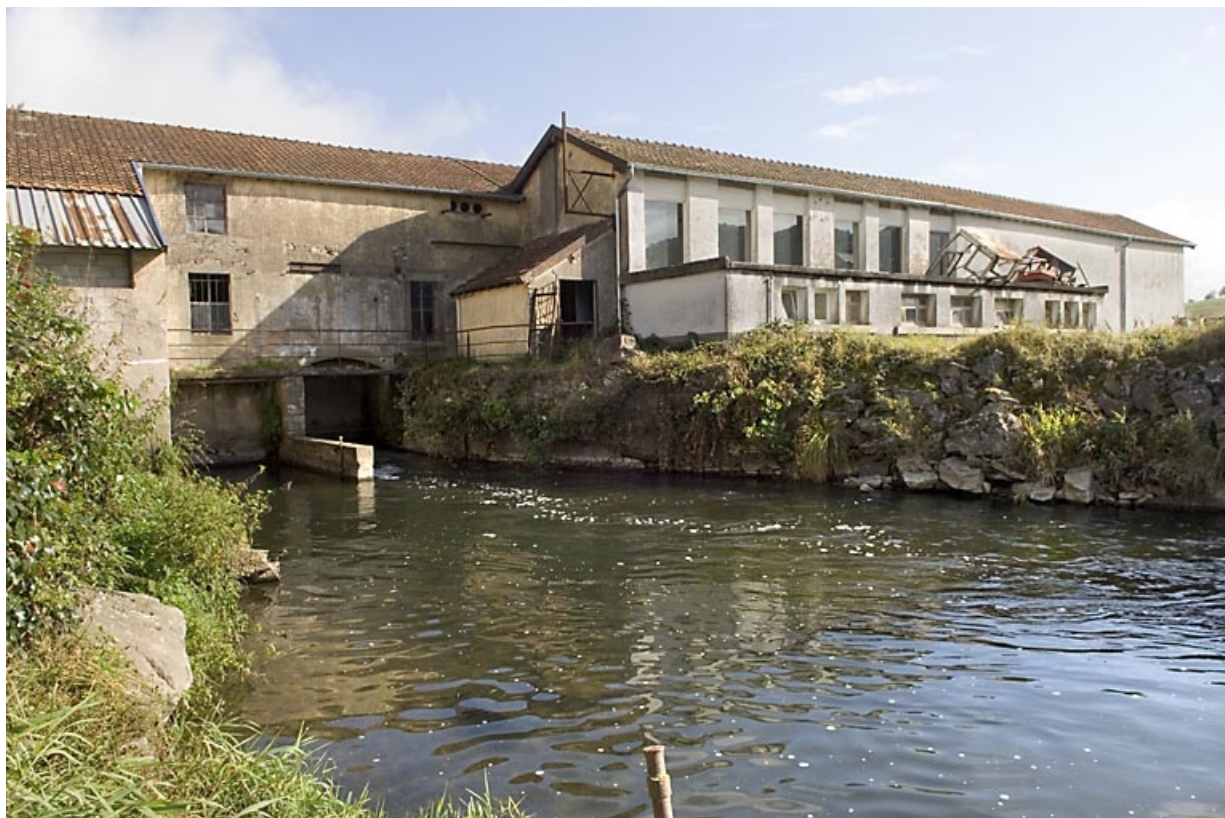
Canal de fuite et atelier de fabrication depuis le sud.