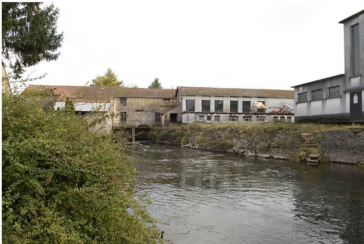
Vue rapprochée depuis le sud.