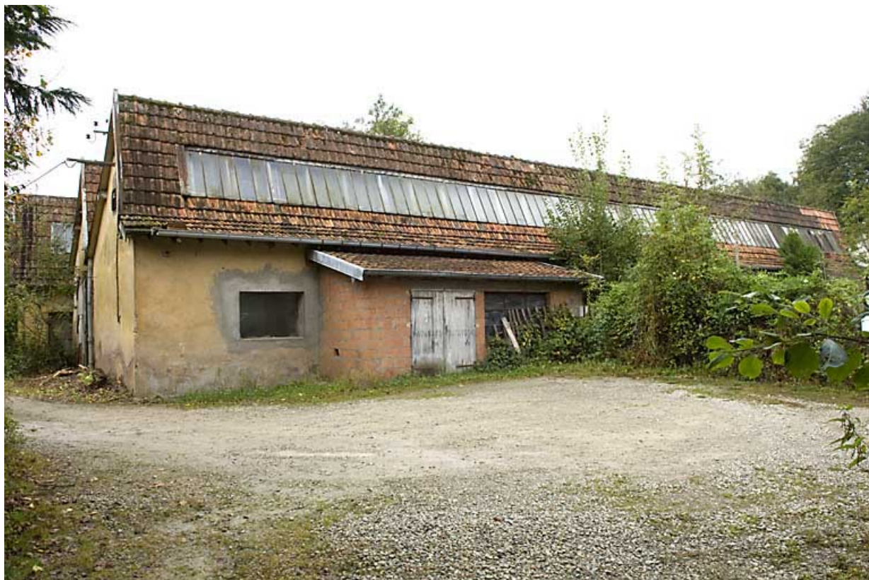
Atelier de fabrication. Vue depuis le nord-est.

70, Les Aynans, 5 à 9 rue sur les écluses, lieudit : les Ecluses