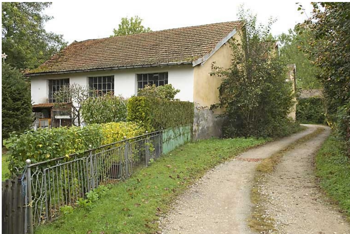
Atelier de fabrication. Vue depuis le sud.

70, Les Aynans, 5 à 9 rue sur les écluses, lieudit : les Ecluses