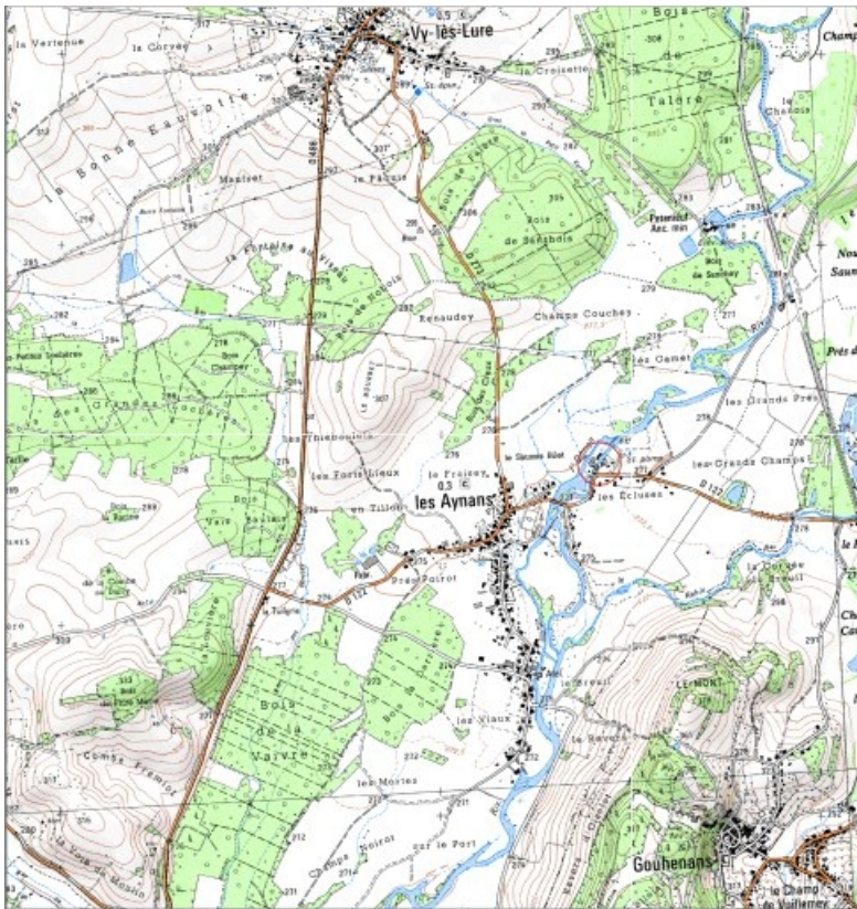
Carte de localisation. Carte topographique au 1:25000, I.G.N., Villersexel, 3421 E. SCAN 25, Licence n°2008CISE29-68. 70, Les Aynans, 5 à 9 rue sur les écluses, lieudit : les Ecluses