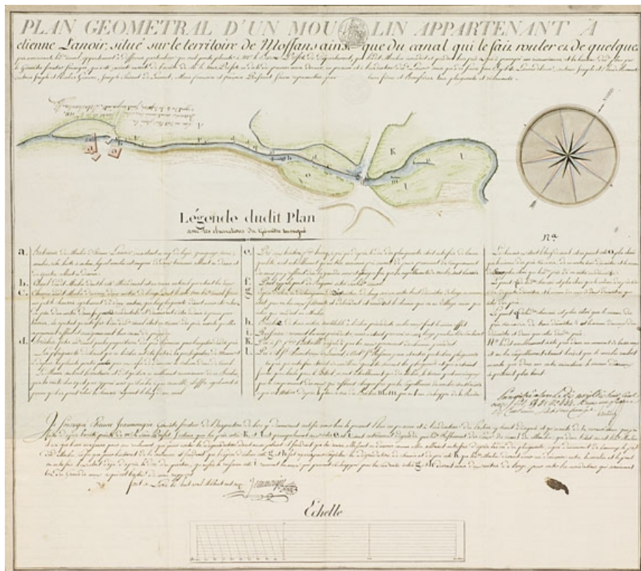
Plan géométral d'un moulin appartenant à Etienne Lanoir [...].

70, Moffans-et-Vacheresse, lieudit : le moulin du Bas