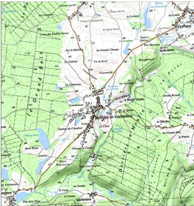
Carte de localisation. Carte topographique au 1:25000, I.G.N., Lure, 3521 O. SCAN 25, Licence n°2008CISE29-68. 70, Moffans-et-Vacheresse, lieudit : le moulin du Bas