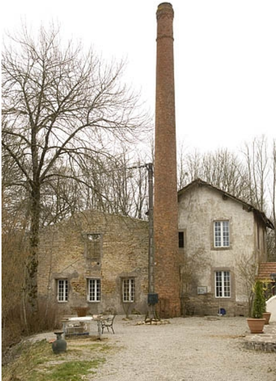
Cheminée, chaufferie et salle des machines depuis le nord.