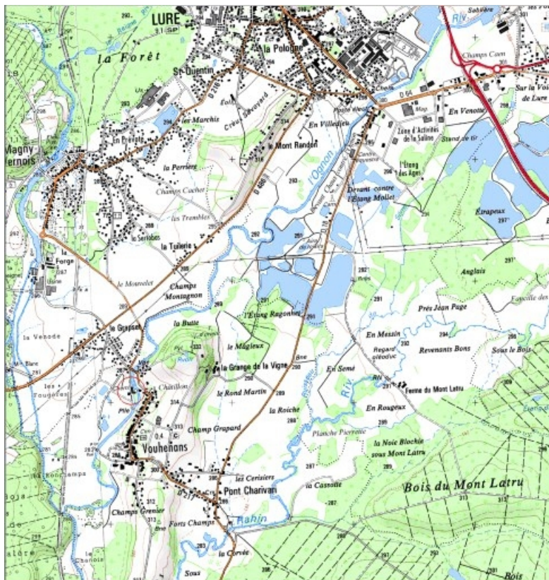
Carte de localisation. Carte topographique au 1:25000, I.G.N., Lure, 3521 O. SCAN 25 70, Vouhenans route de Magny-Vernois