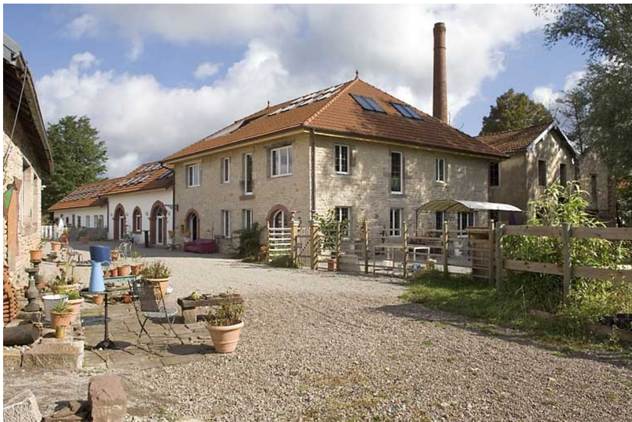
Atelier de fabrication, logement et salle de machines depuis le sud. 70, Vouhenans route de Magny-Vernois