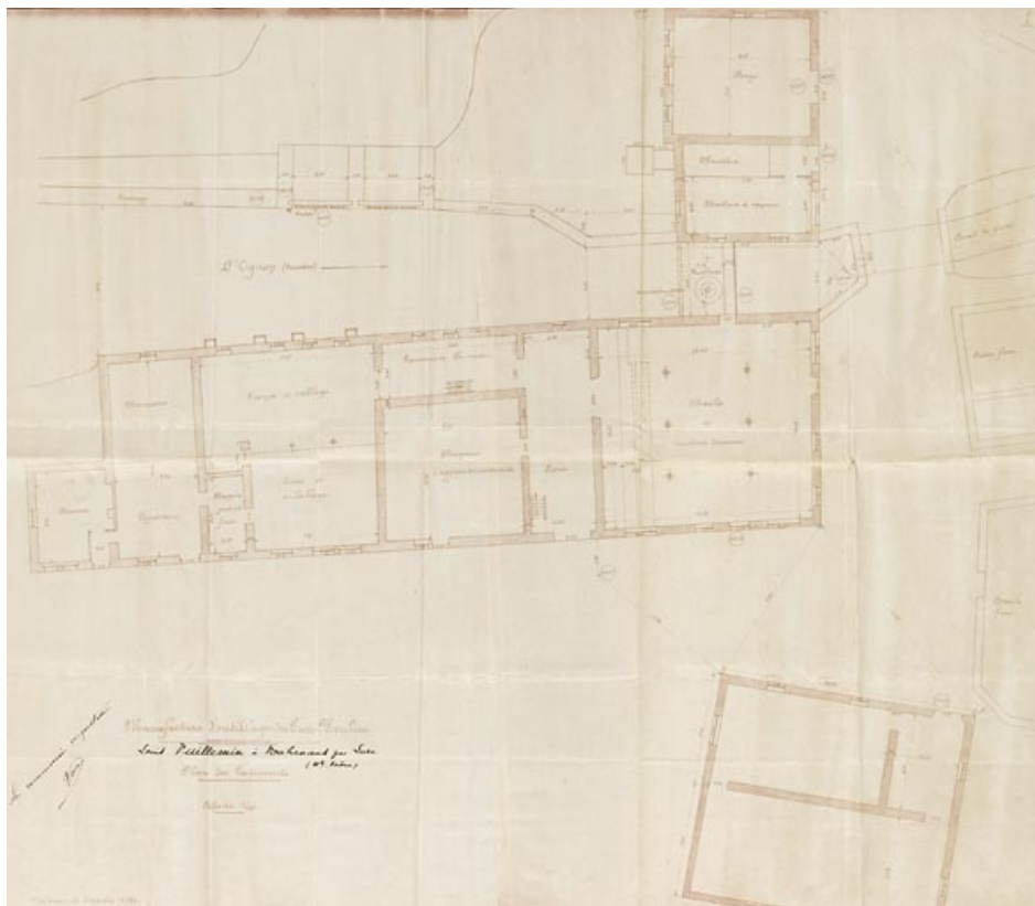
Manufacture d'outillage des Trois moulins. Plan des bâtiments.