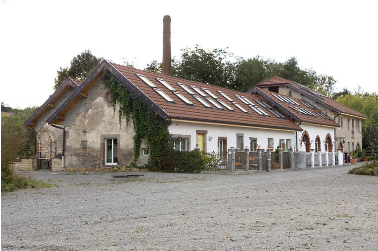
Atelier de fabrication vu de trois quarts.