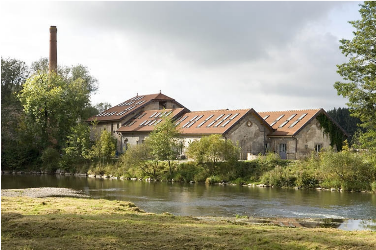
Vue rapprochée depuis le nord-est.