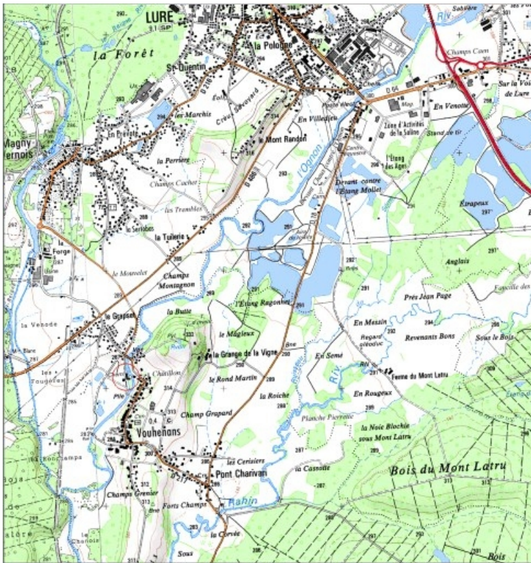
Carte de localisation. Carte topographique au 1:25000, I.G.N., Lure, 3521 O. 70, Vouhenans route de Magny-Vernois