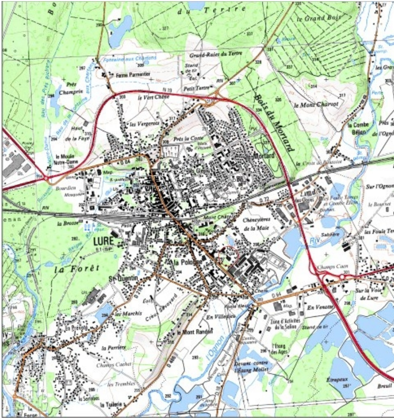
Carte de localisation. Carte topographique au 1:25000, I.G.N., Lure, 3521 O. 70, Lure, 20 rue des Cloies