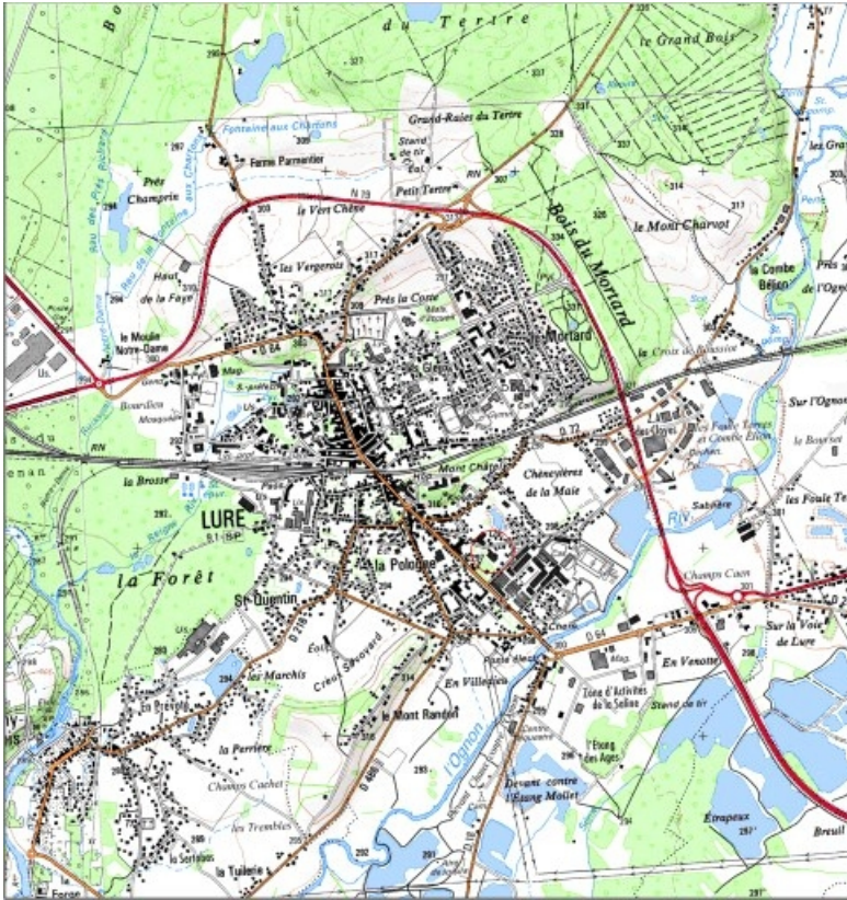
Carte de localisation. Carte topographique au 1:25000, I.G.N., Lure, 3521 O. SCAN 25, Licence n°2008CISE29-68. 70, Lure, 20 rue des Cloies