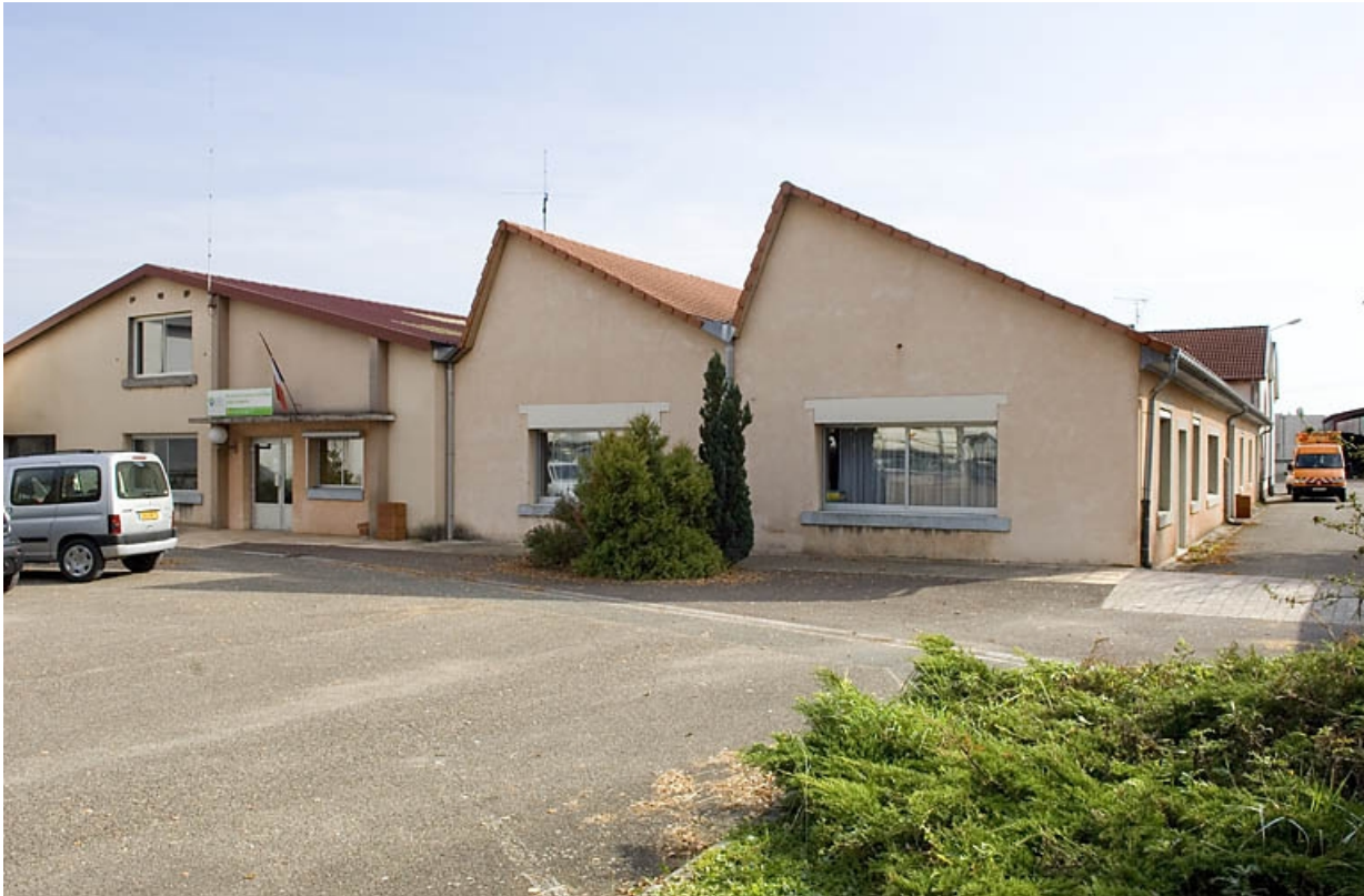
Atelier de fabrication vu de trois quarts.