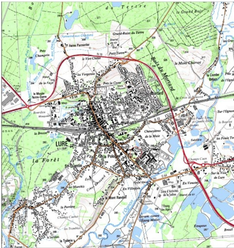
Carte de localisation. Carte topographique au 1:25000, I.G.N., Lure, 3521 O. 70, Lure, 20 rue des Cloies