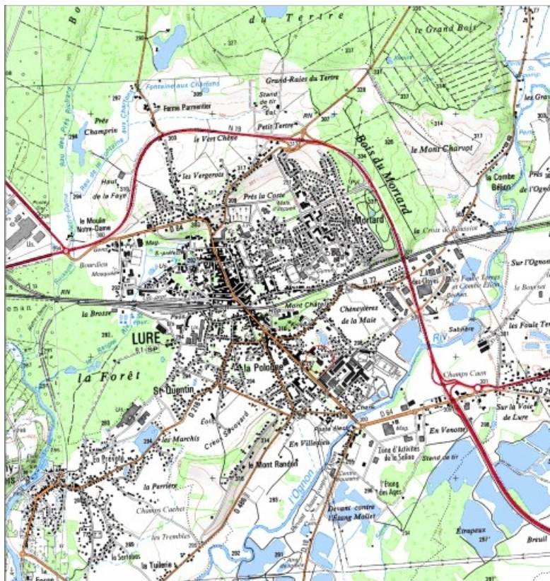
Carte de localisation. Carte topographique au 1:25000, I.G.N., Lure, 3521 O. SCAN 25 70, Lure, 20 rue des Cloies