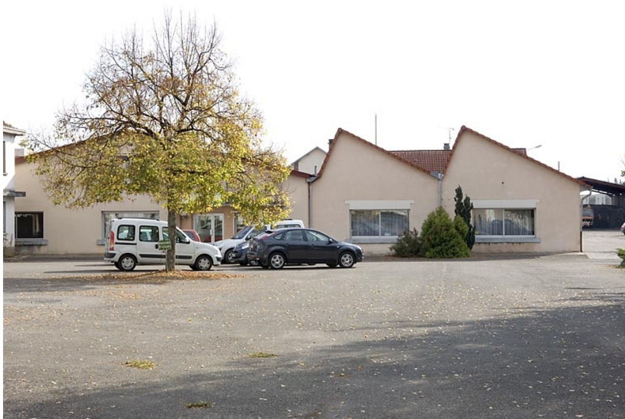
Murs pignons de l'atelier de fabrication depuis le nord-ouest.