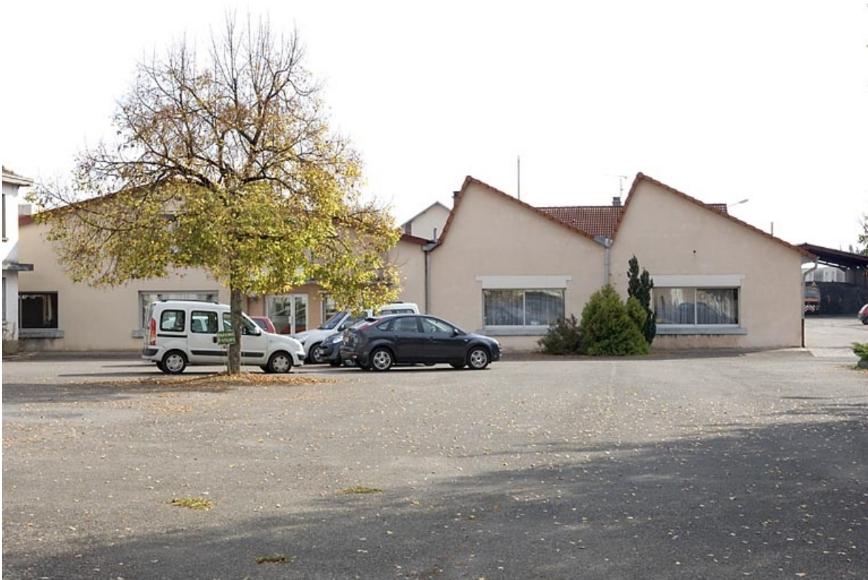
Murs pignons de l'atelier de fabrication depuis le nord-ouest.