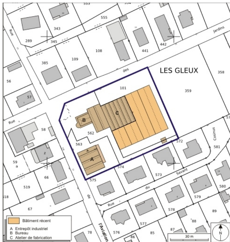
Plan-masse et de situation. Extrait du plan cadastral numérisé, 2008, section AH, 1:1000. Source : Direction générale des Finances Publiques - Cadastre ; mise à jour : 2008.