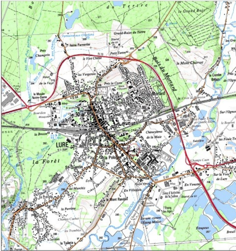
Carte de localisation. Carte topographique au 1:25000, I.G.N., Lure, 3521 O. 70, Lure, 15 rue des Cloies