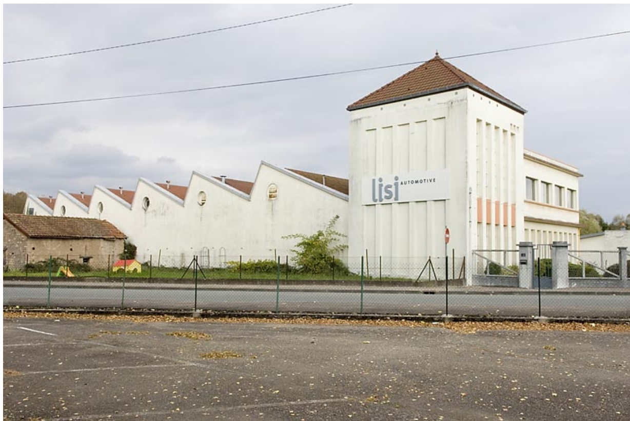
Vue d'ensemble depuis le sud.