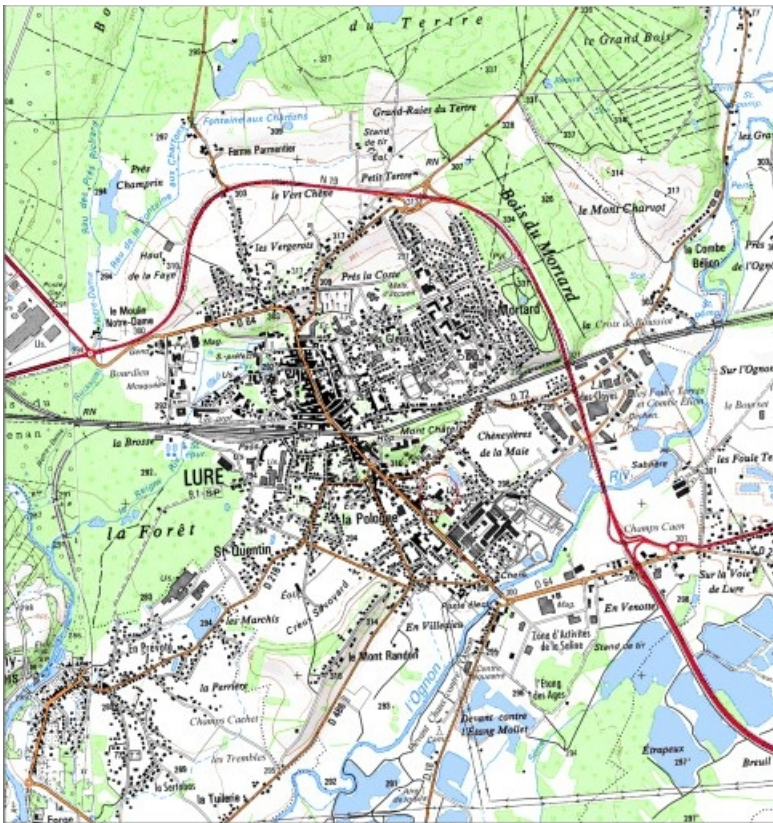
Carte de localisation. Carte topographique au 1:25000, I.G.N., Lure, 3521 O. SCAN 25, Licence n°2008CISE29-68. 70, Lure, 15 rue des Cloies