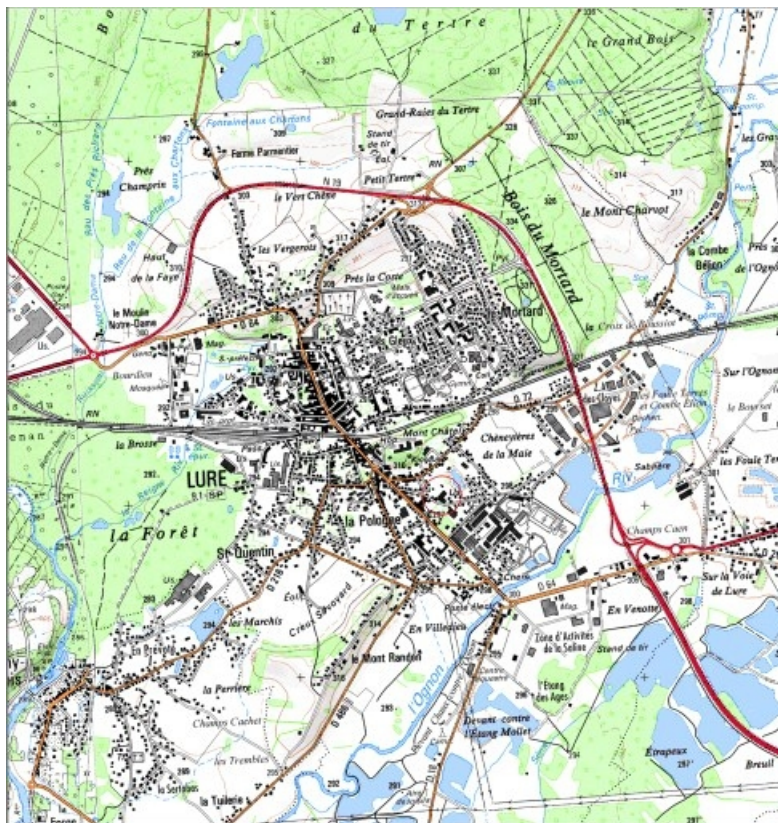
Carte de localisation. Carte topographique au 1:25000, I.G.N., Lure, 3521 O. Licence n°2008CISE29-68. 70, Lure, 15 rue des Cloies