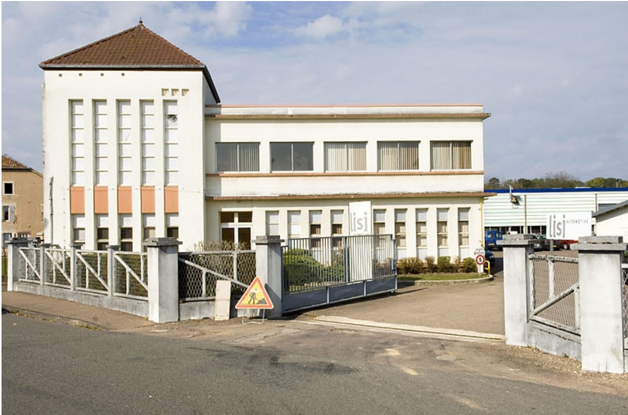
Façade antérieure. Transformateur et bureau.