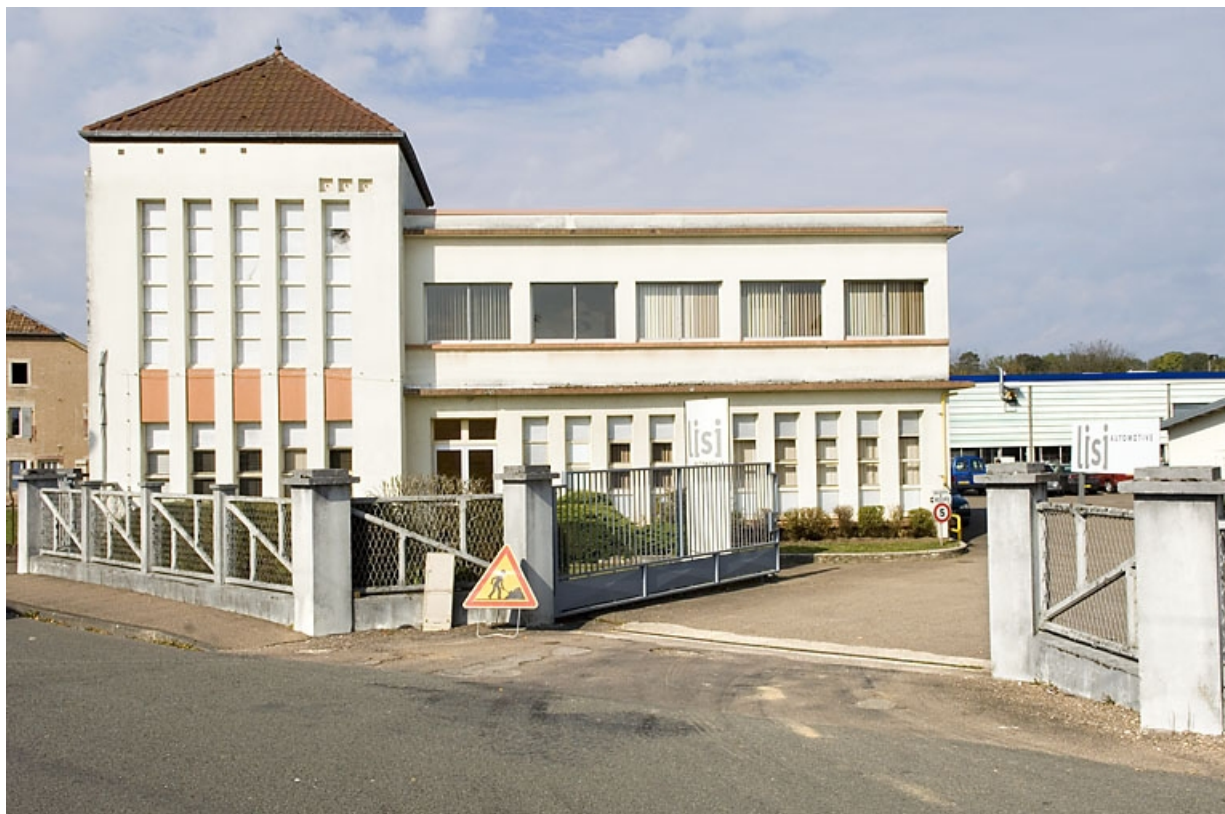
Façade antérieure. Transformateur et bureau.