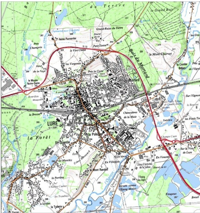
Carte de localisation. Carte topographique au 1:25000, I.G.N., Lure, 3521 O. 70, Lure, 7 rue Antoine Boisson