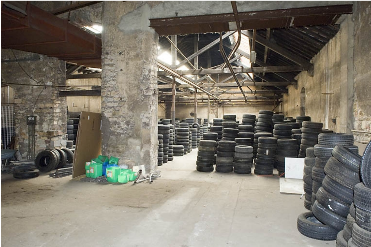
Vue intérieure de l'atelier de fabrication.