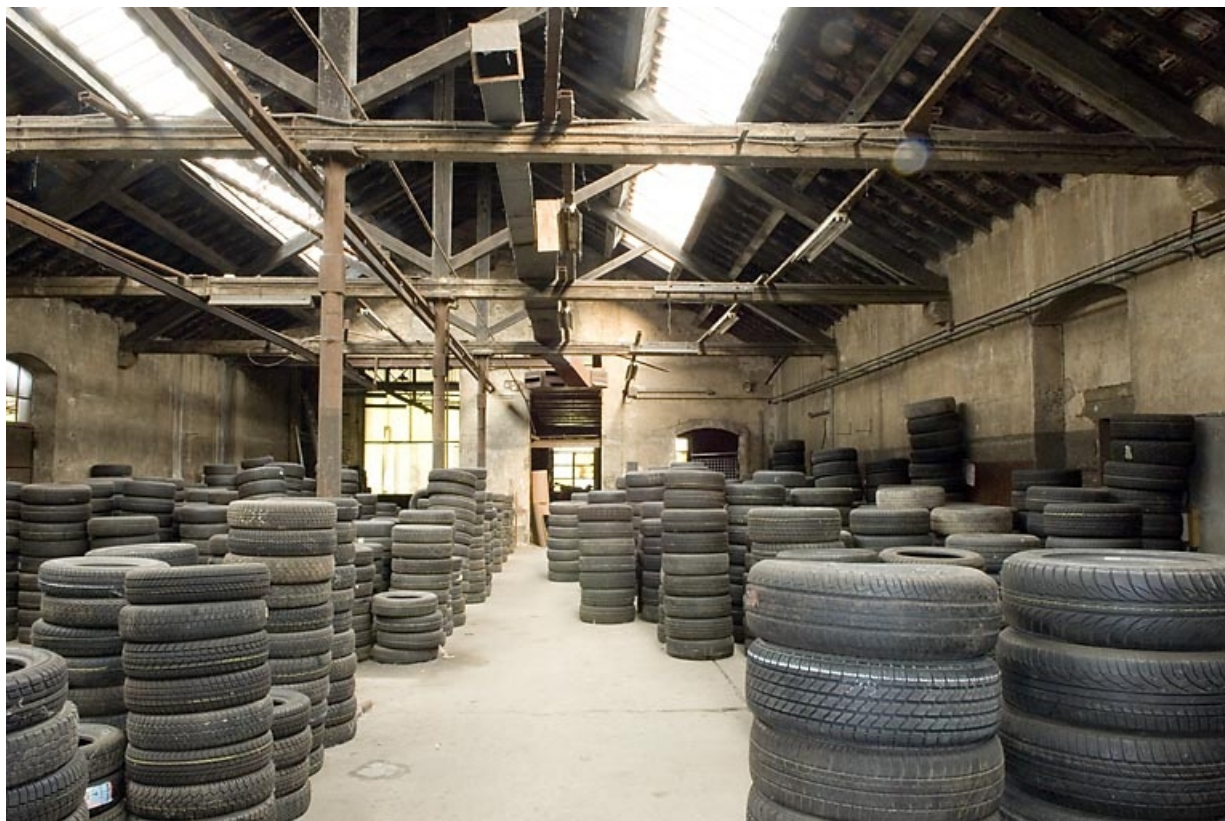
Charpente et couverture de l'atelier de fabrication.