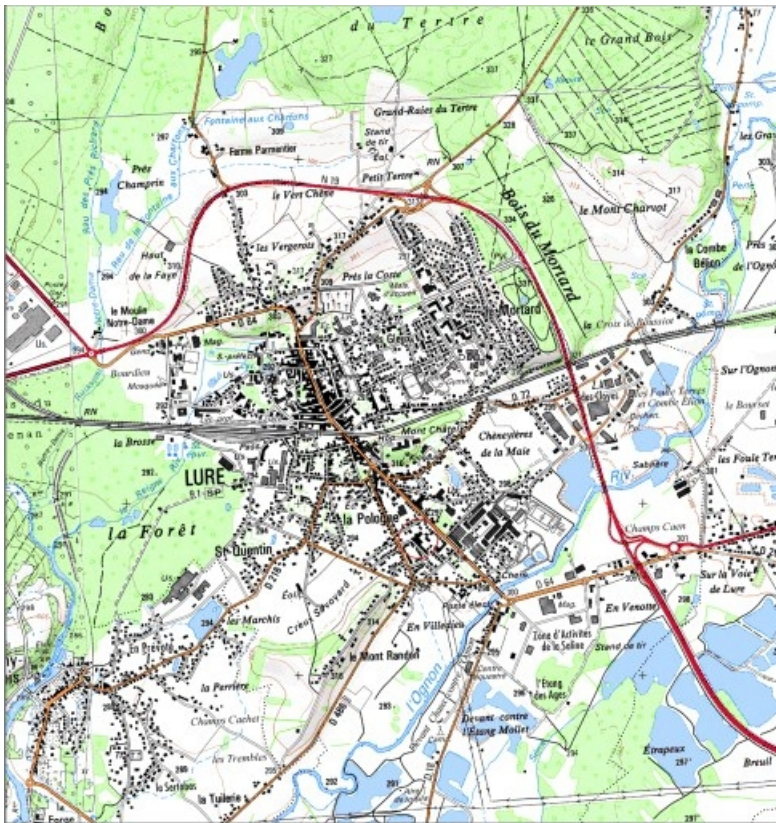
Carte de localisation. Carte topographique au 1:25000, I.G.N., Lure, 3521 O. SCAN 25 70, Lure, 7 rue Antoine Boisson