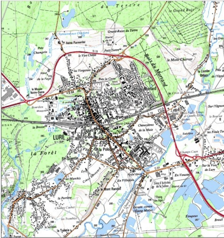
Carte de localisation. Carte topographique au 1:25000, I.G.N., Lure, 3521 O. 70, Lure, 7 rue Antoine Boisson