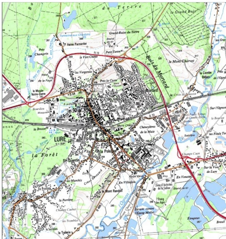
Carte de localisation. Carte topographique au 1:25000, I.G.N., Lure, 3521 O. 70, Lure, 7 rue Antoine Boisson