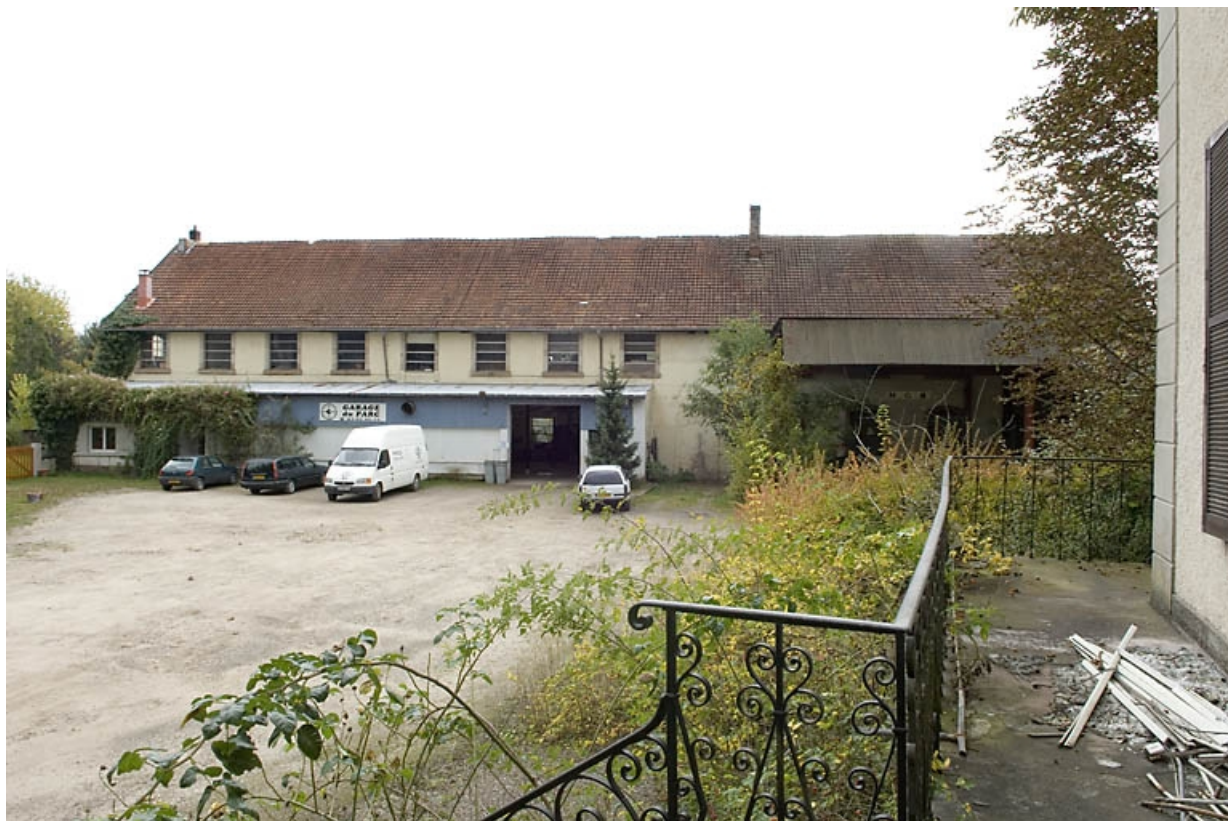
Atelier de fabrication. Vue depuis le nord-ouest. 70, Lure, 7 rue Antoine Boisson