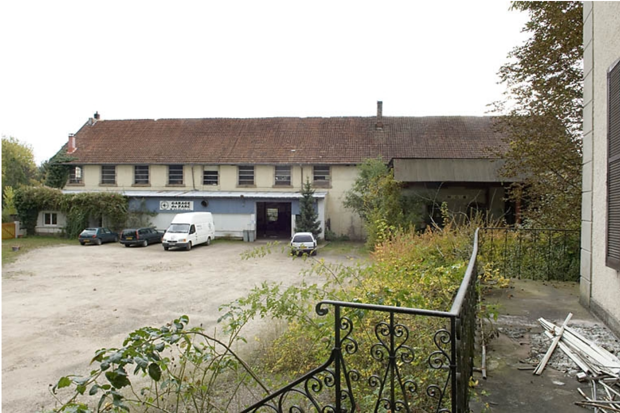
Atelier de fabrication. Vue depuis le nord-ouest.