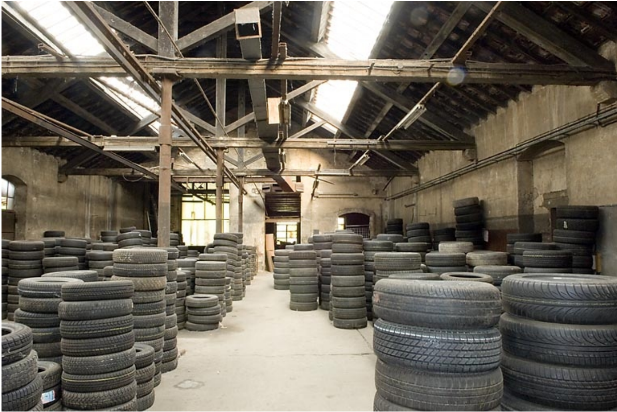
Charpente et couverture de l'atelier de fabrication.