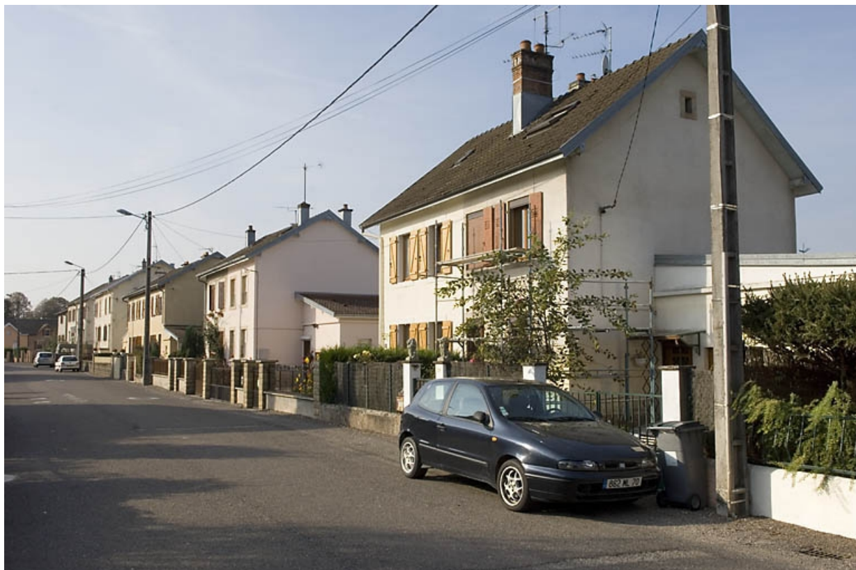
Logements ouvriers (rue Saint-Quentin). Vue depuis le nord. 70, Lure rue de la Métairie