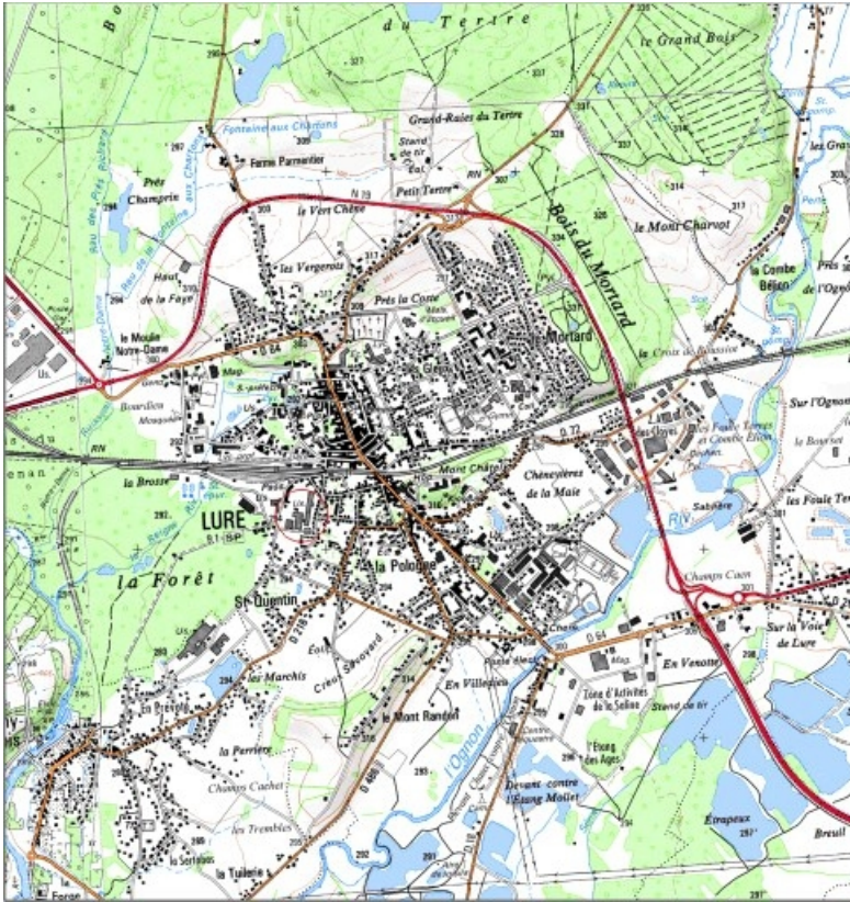
Carte de localisation. Carte topographique au 1:25000, I.G.N., Lure, 3521 O. SCAN 25, Licence n°2008CISE29-68. 70, Lure rue de la Métairie