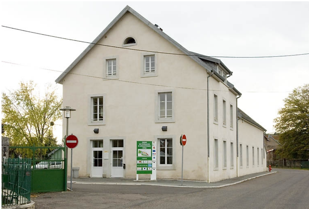
Logement et bureau (?). Vue de trois quarts. 70, Lure rue de la Métairie