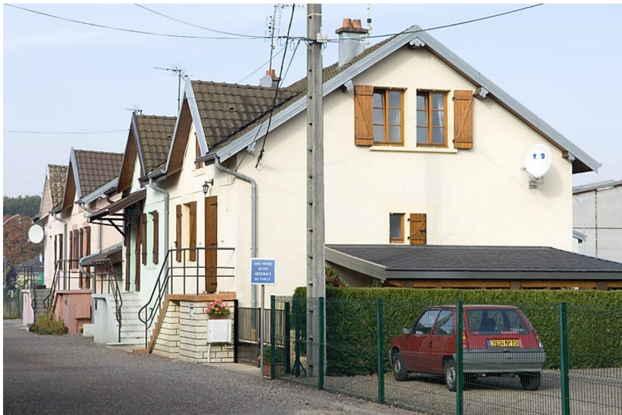
Logements doubles. Vue en enfilade depuis l'est. 70, Lure rue de la Métairie