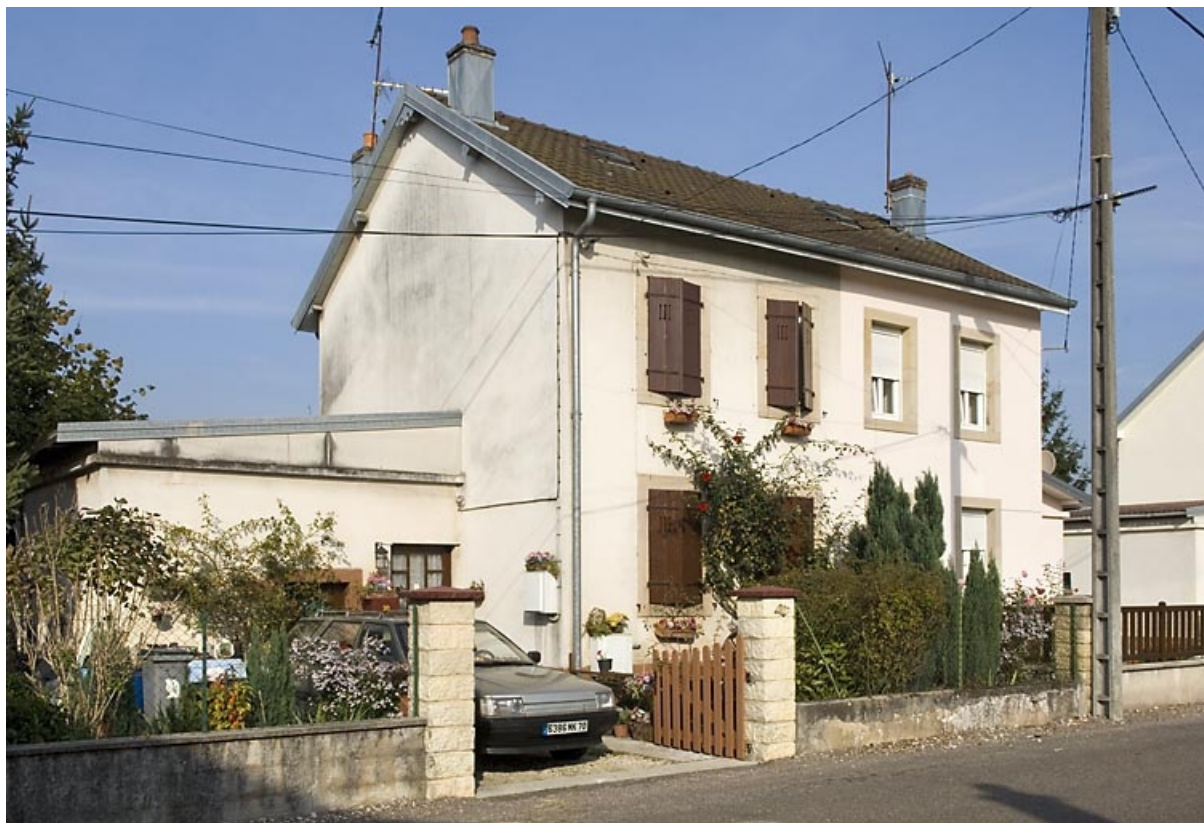
Logement ouvrier à 4 logements (rue Saint-Quentin). 70, Lure rue de la Métairie