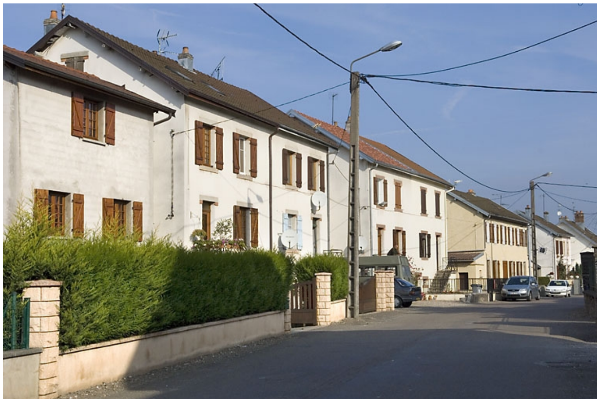
Logements ouvriers (rue Saint-Quentin). Vue depuis le sud. 70, Lure rue de la Métairie