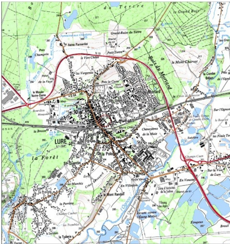
Carte de localisation. Carte topographique au 1:25000, I.G.N., Lure, 3521 O. SCAN 25, Licence n°2008CISE29-68. 70, Lure, 14, 16 rue des Gloux