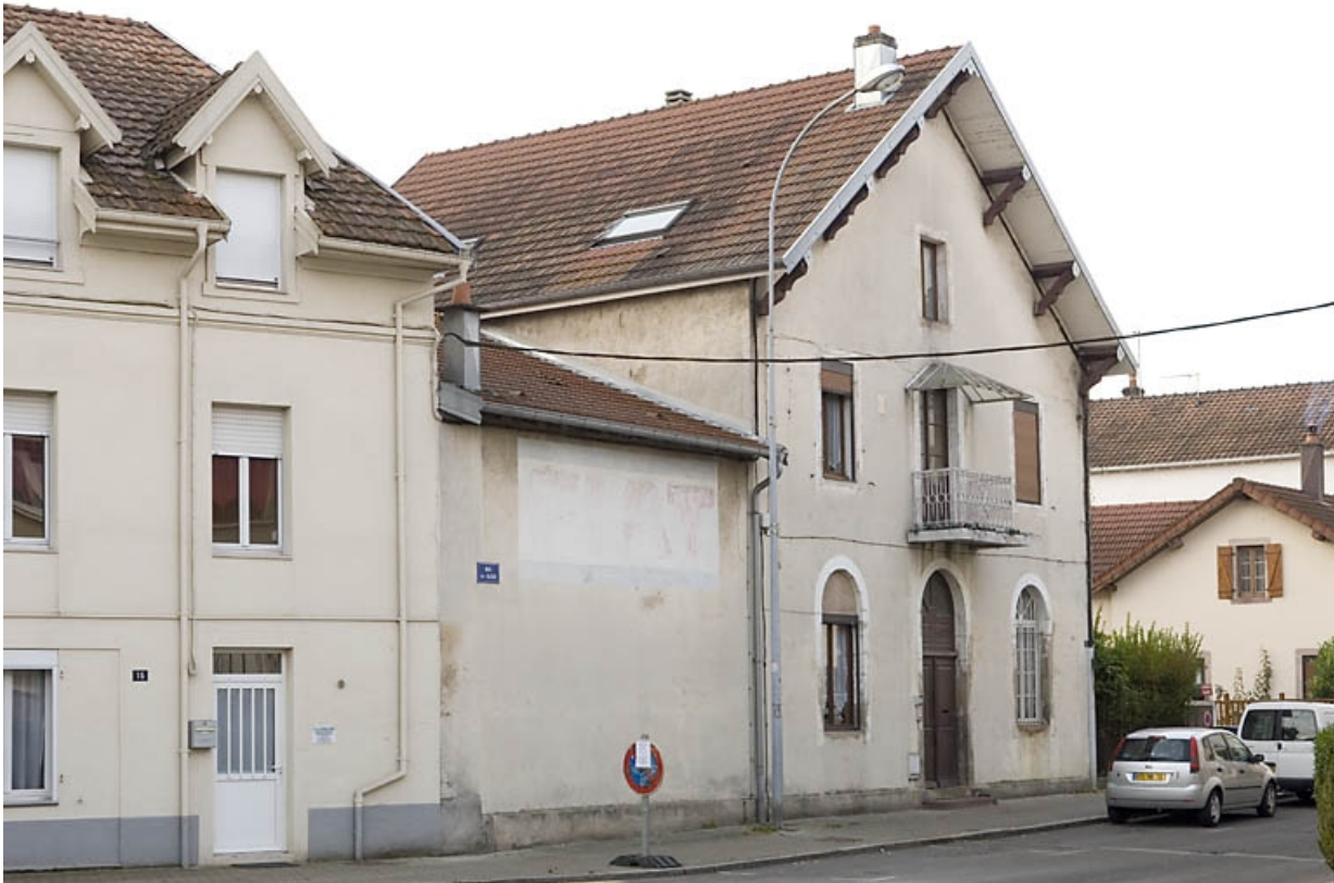
Logement patronal. Vue de trois quarts.