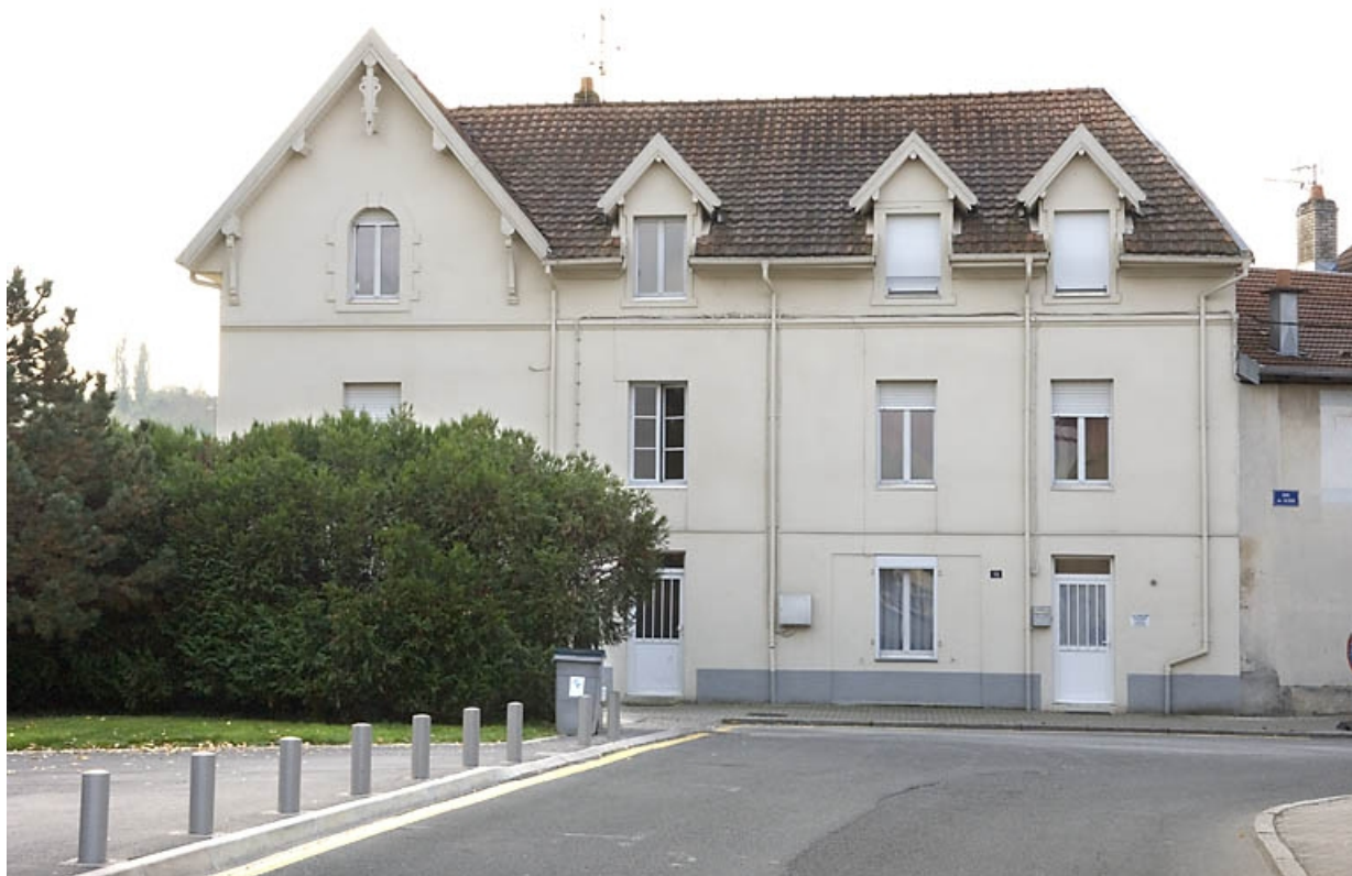
Logement ouvrier (?). Vue de face.