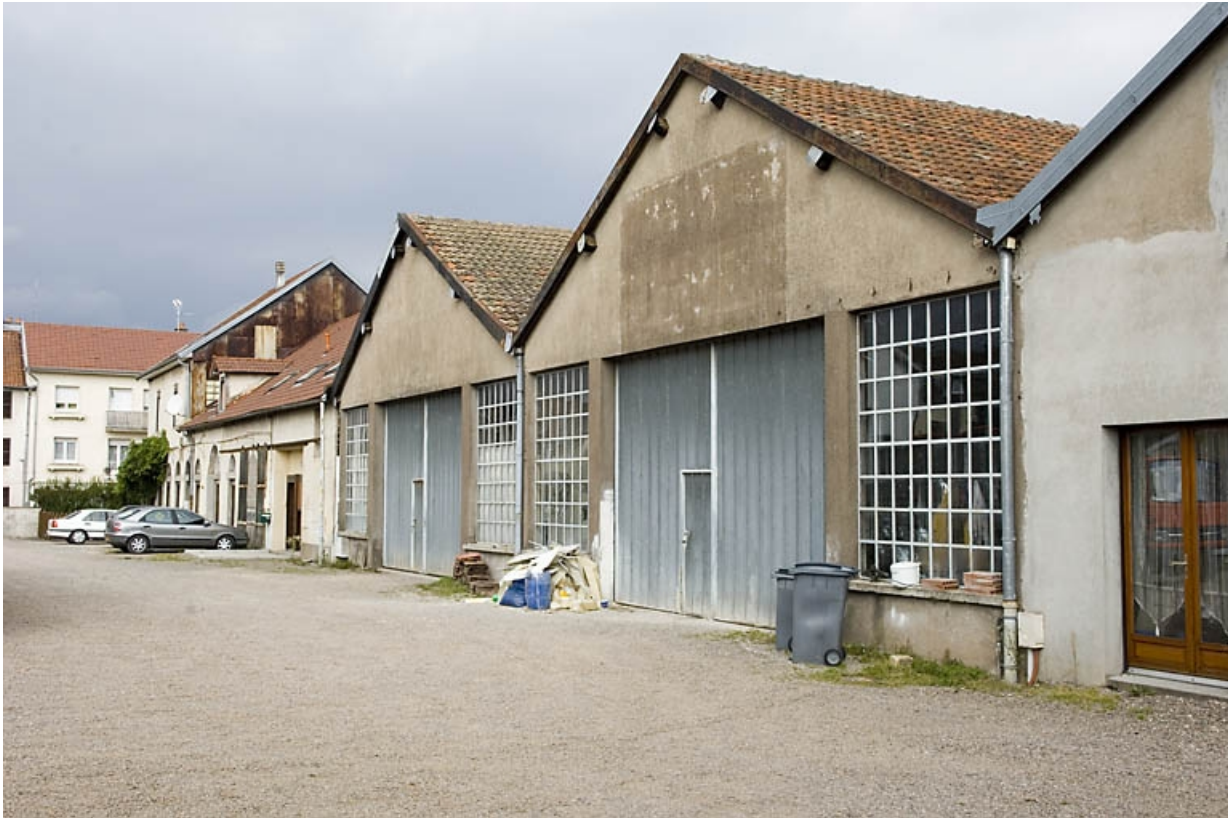
Façades et murs-pignons des ateliers de fabrication. Vue depuis le sud. 70, Lure, 14, 16 rue des Gleux