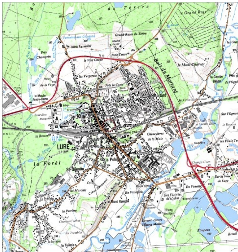
Carte de localisation. Carte topographique au 1:25000, I.G.N., Lure, 3521 O. SCAN 25, Licence n°2008CISE29-68. 70, Lure, 14, 16 rue des Gloux