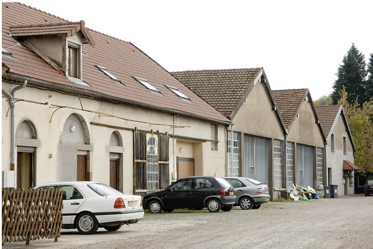
Murs-pignons des ateliers de fabrication. Vue depuis le nord-ouest. 70, Lure, 14, 16 rue des Gleux