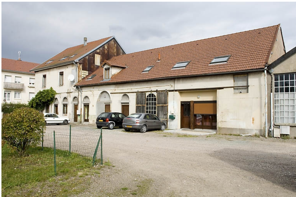
Façades sur cour: logement patronal et ancien atelier de fabrication (?). 70, Lure, 14, 16 rue des Gleux