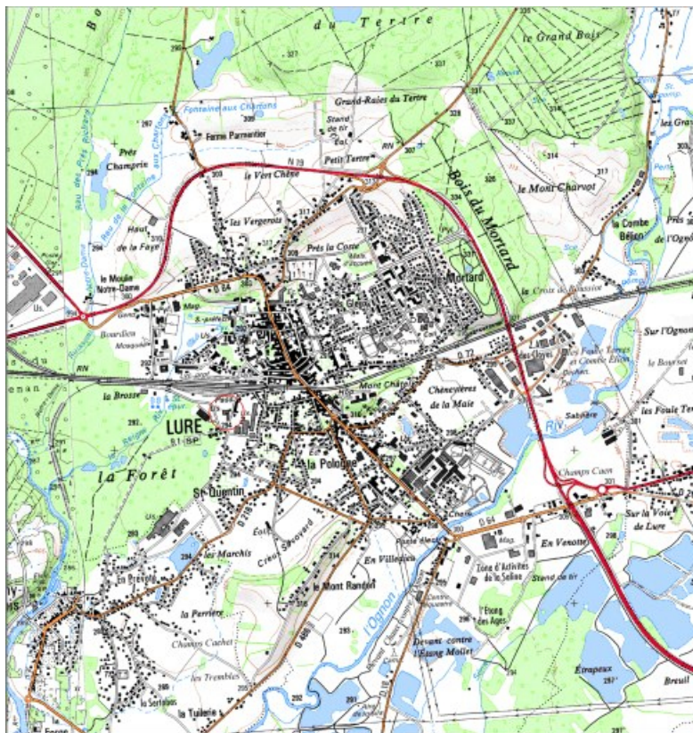
Carte de localisation. Carte topographique au 1:25000, I.G.N., Lure, 3521 O. SCAN 25 70, Lure rue de la Métairie