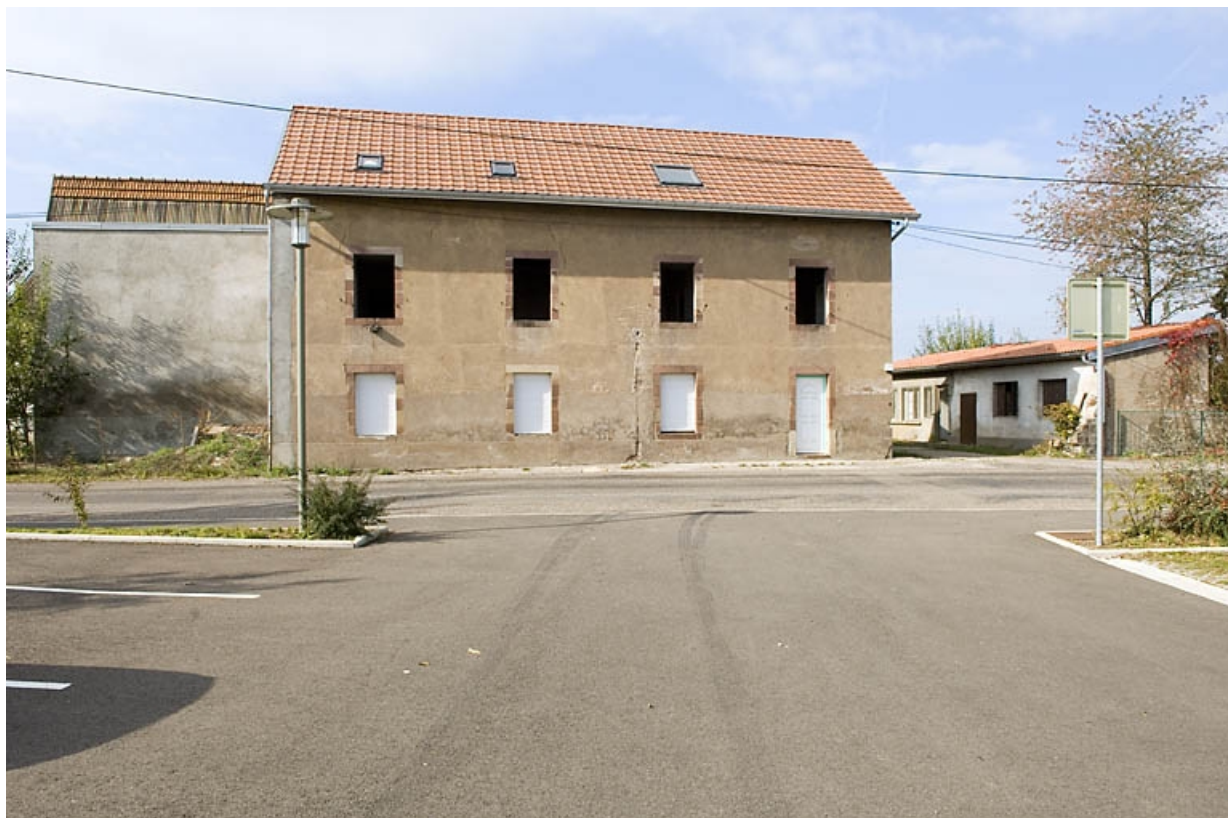
Ancien atelier de fabrication (?). Façade sur rue.