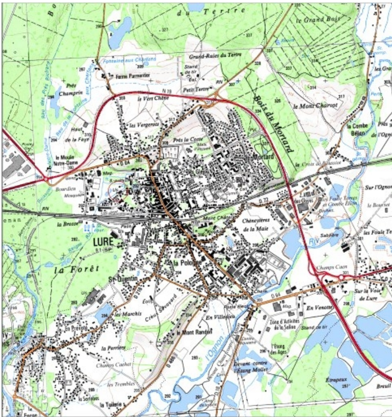
Carte de localisation. Carte topographique au 1:25000, I.G.N., Lure, 3521 O. SCAN 25, Licence n°2008CISE29-68. 70, Lure, 4 rue Parmentier