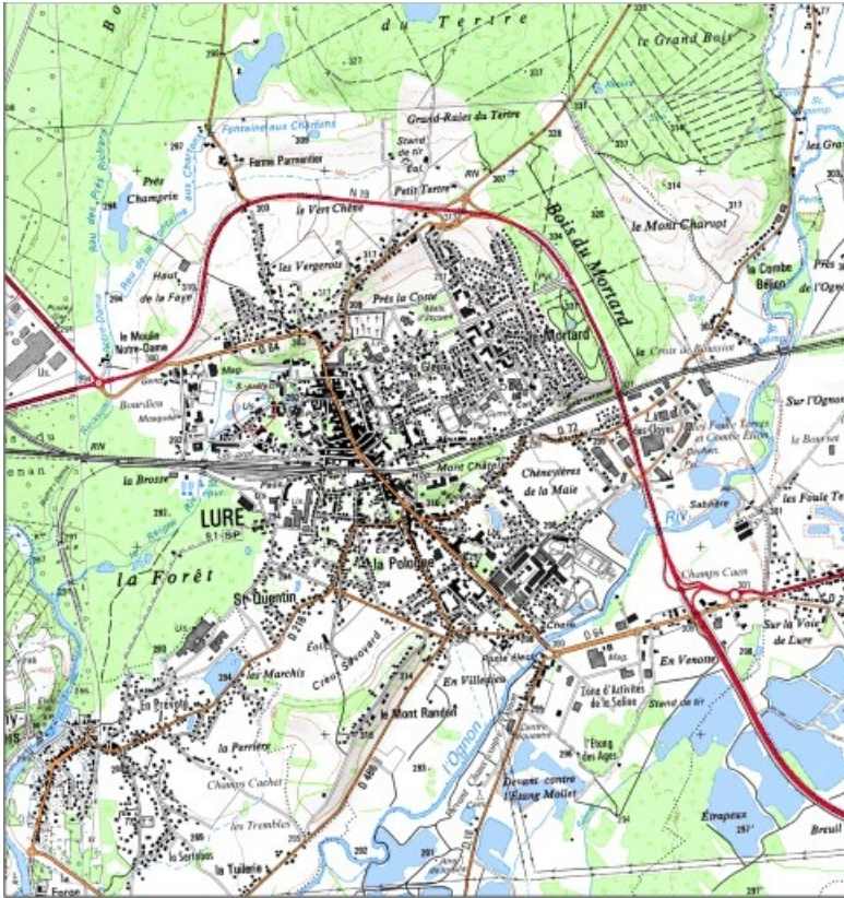
Carte de localisation. Carte topographique au 1:25000, I.G.N., Lure, 3521 O. 70, Lure, 4 rue Parmentier