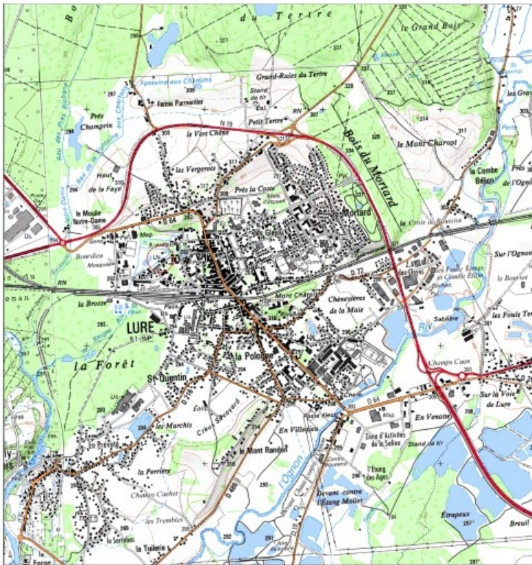
Carte de localisation. Carte topographique au 1:25000, I.G.N., Lure, 3521 O. Licence n°2008CISE29-68. 70, Lure, 4 rue Parmentier