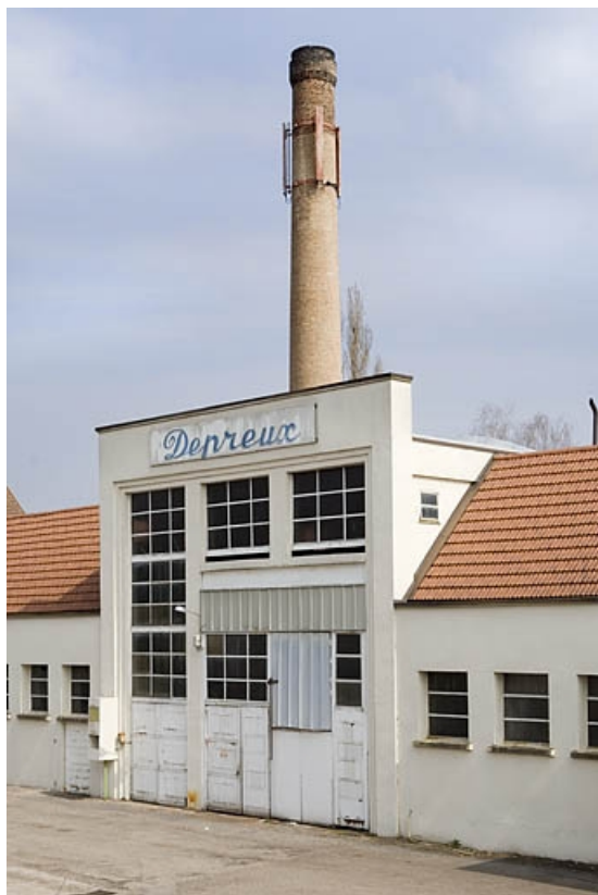
Cheminée et ancienne chaufferie vues de trois quarts.