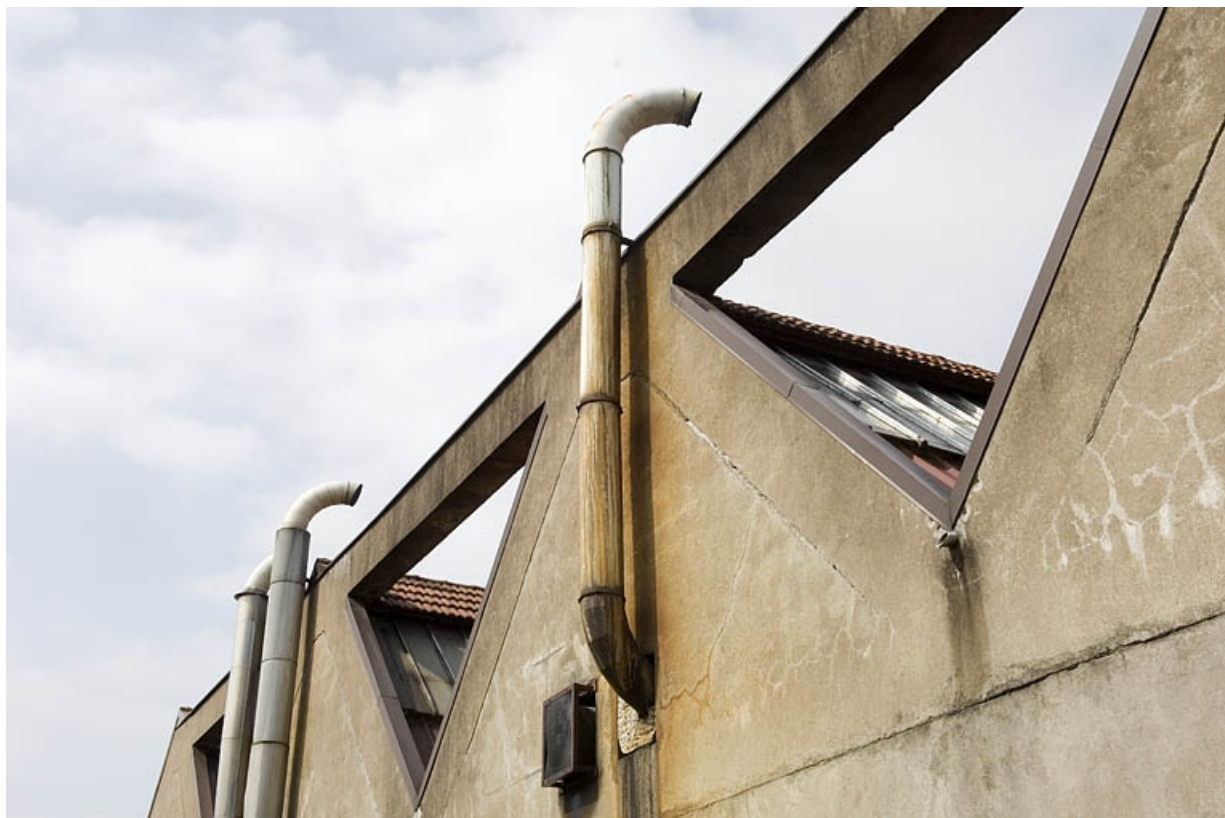
Pignons de l'atelier de fabrication. Détail.