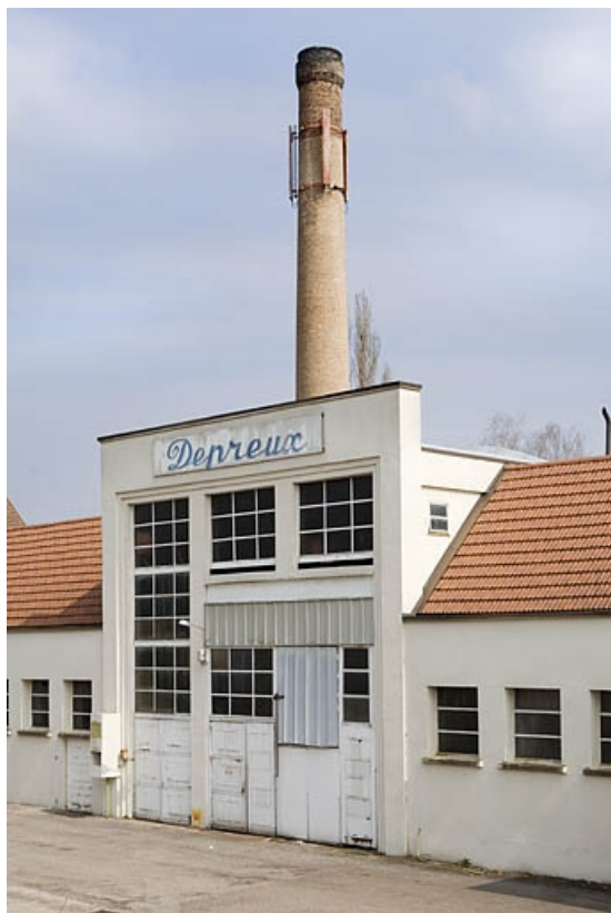
Cheminée et ancienne chaufferie vues de trois quarts.