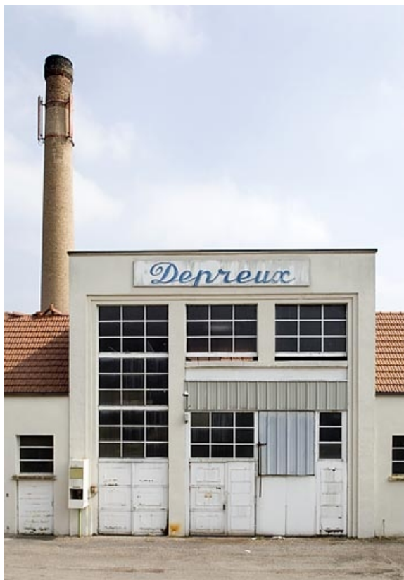
Cheminée et façade antérieure de l'ancienne chaufferie. 70, Luxeuil-les-Bains, 12 rue Henri Guy