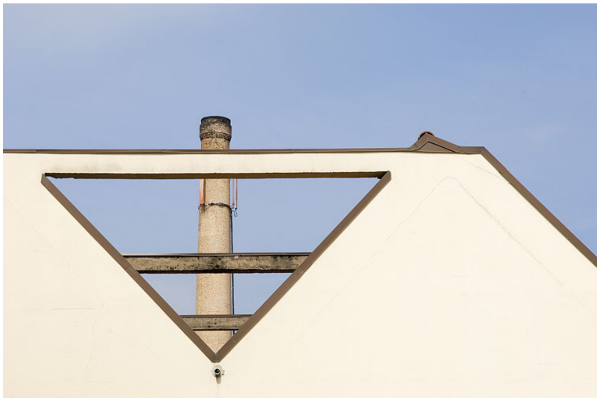
La cheminée vue à travers les poutrelles de la charpente en béton.