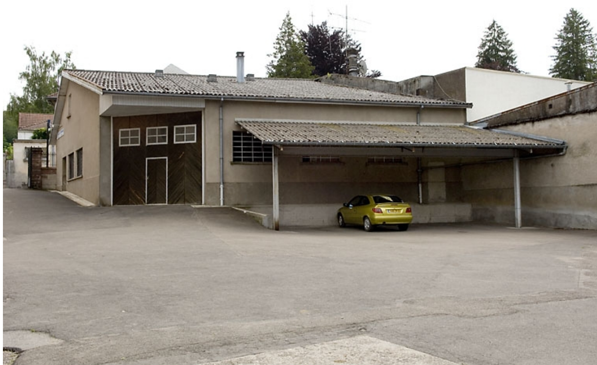
Atelier de fabrication (?). Vue depuis la cour. 70, Luxeuil-les-Bains, 11 rue de Grammont