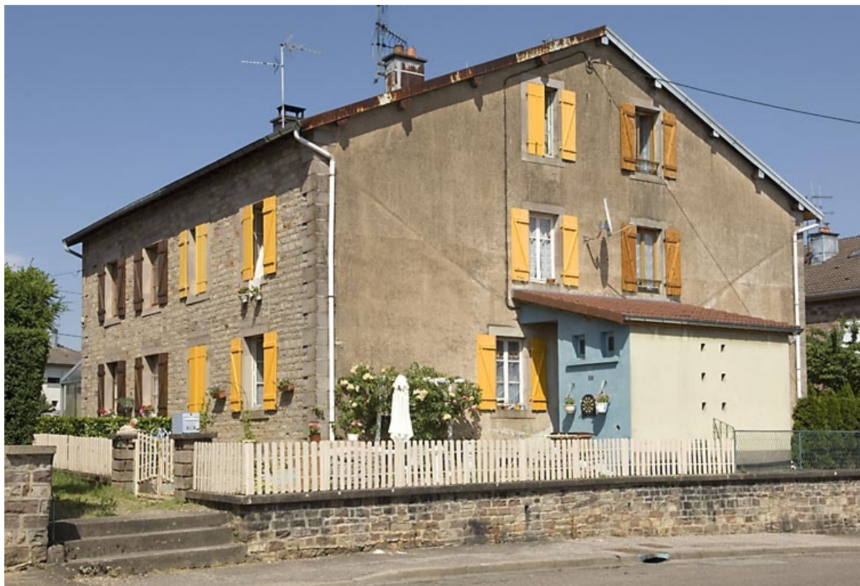
Logement d'ouvriers (rue Pergaud). 70, Luxeuil-les-Bains rue Louis Pergaud