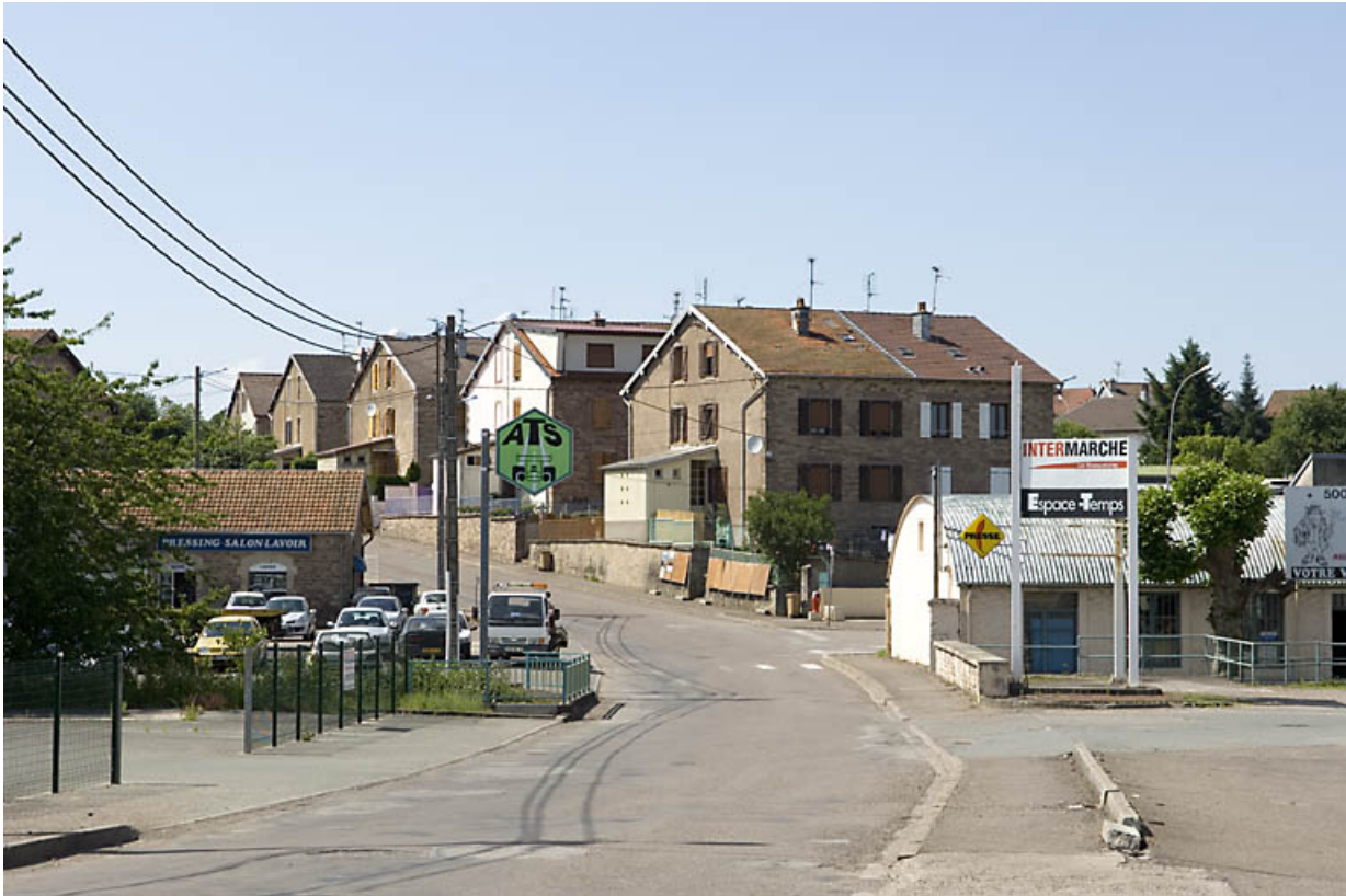
Vue d'ensemble de la cité ouvrière.