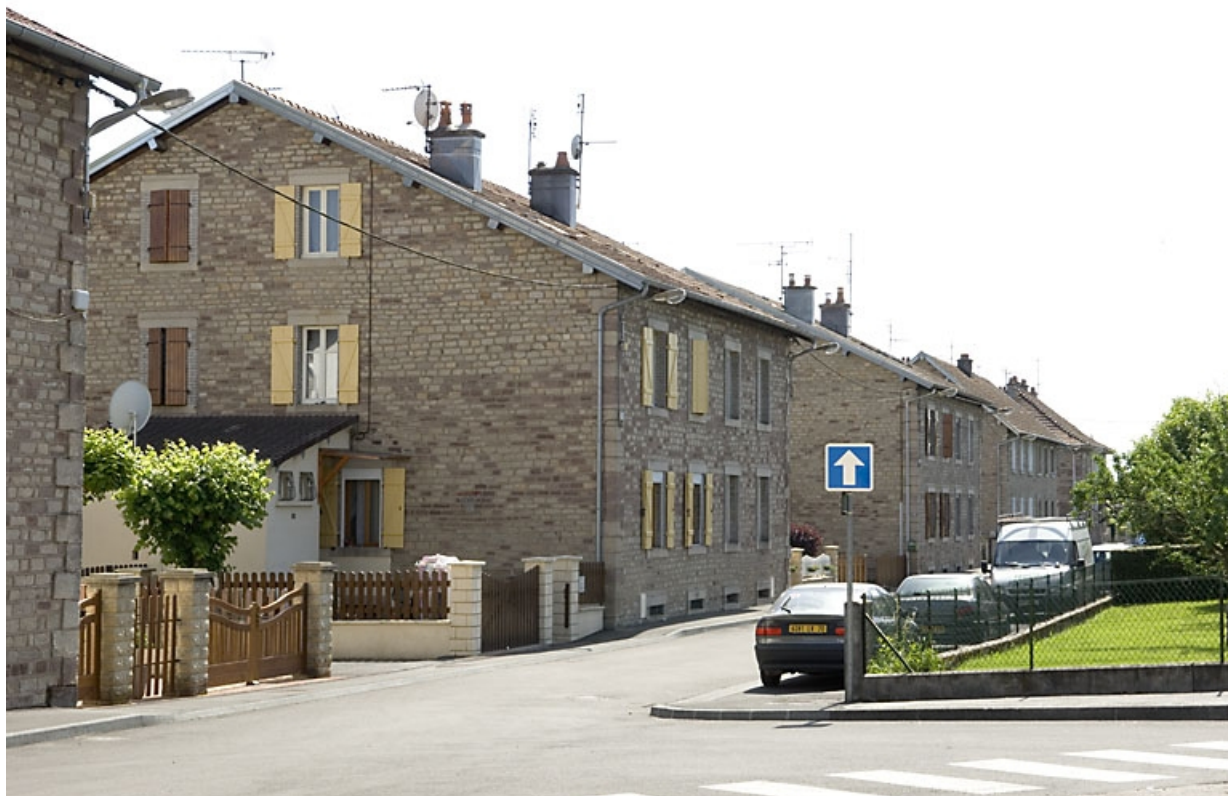
Logements d'ouvriers (rue du Tissage). 70, Luxeuil-les-Bains rue Louis Pergaud