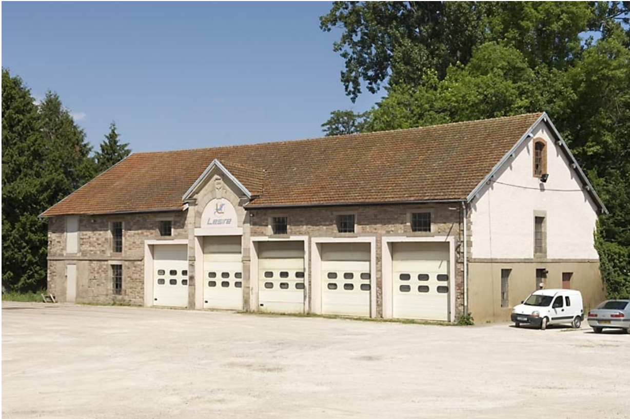
Atelier de fabrication. Vue de trois quarts. 70, Luxeuil-les-Bains, 12 rue Victor Hugo