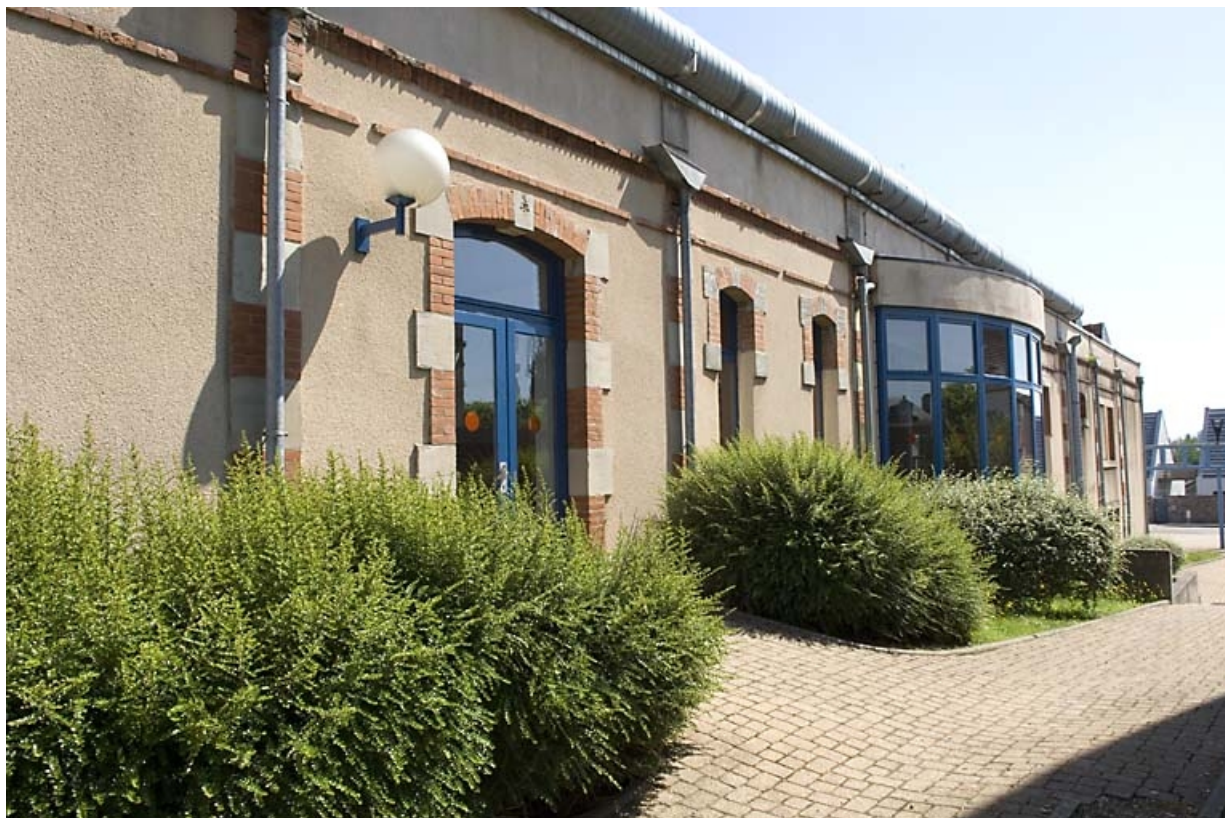
Façade sud de l'atelier de fabrication.

70, Luxeuil-les-Bains, 23 avenue Labiénus