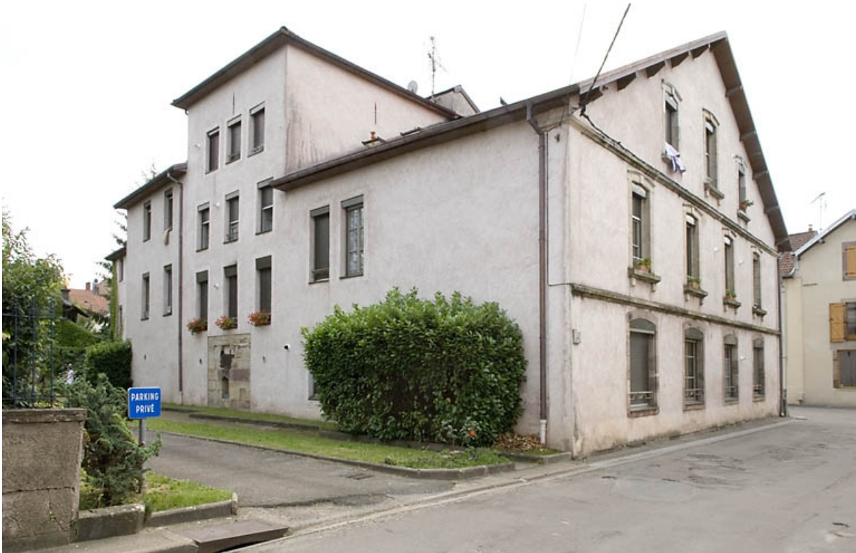
Façade postérieure vue de trois quarts.

70, Luxeuil-les-Bains, 17 rue des Cannes