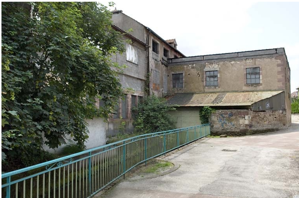
Façades postérieures donnant sur le bief. 70, Luxeuil-les-Bains, 21 rue des Cannes