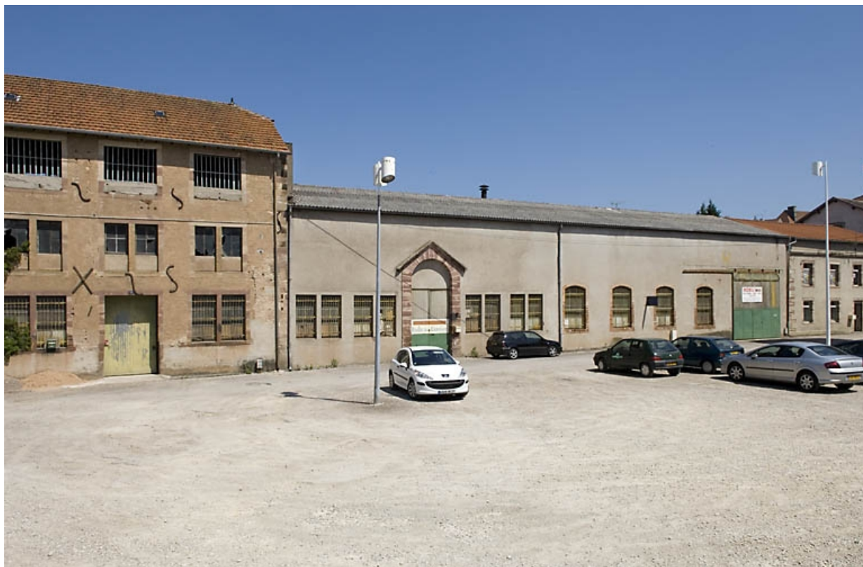
Moulin à papier et atelier de fabrication de l'usine de construction mécanique.