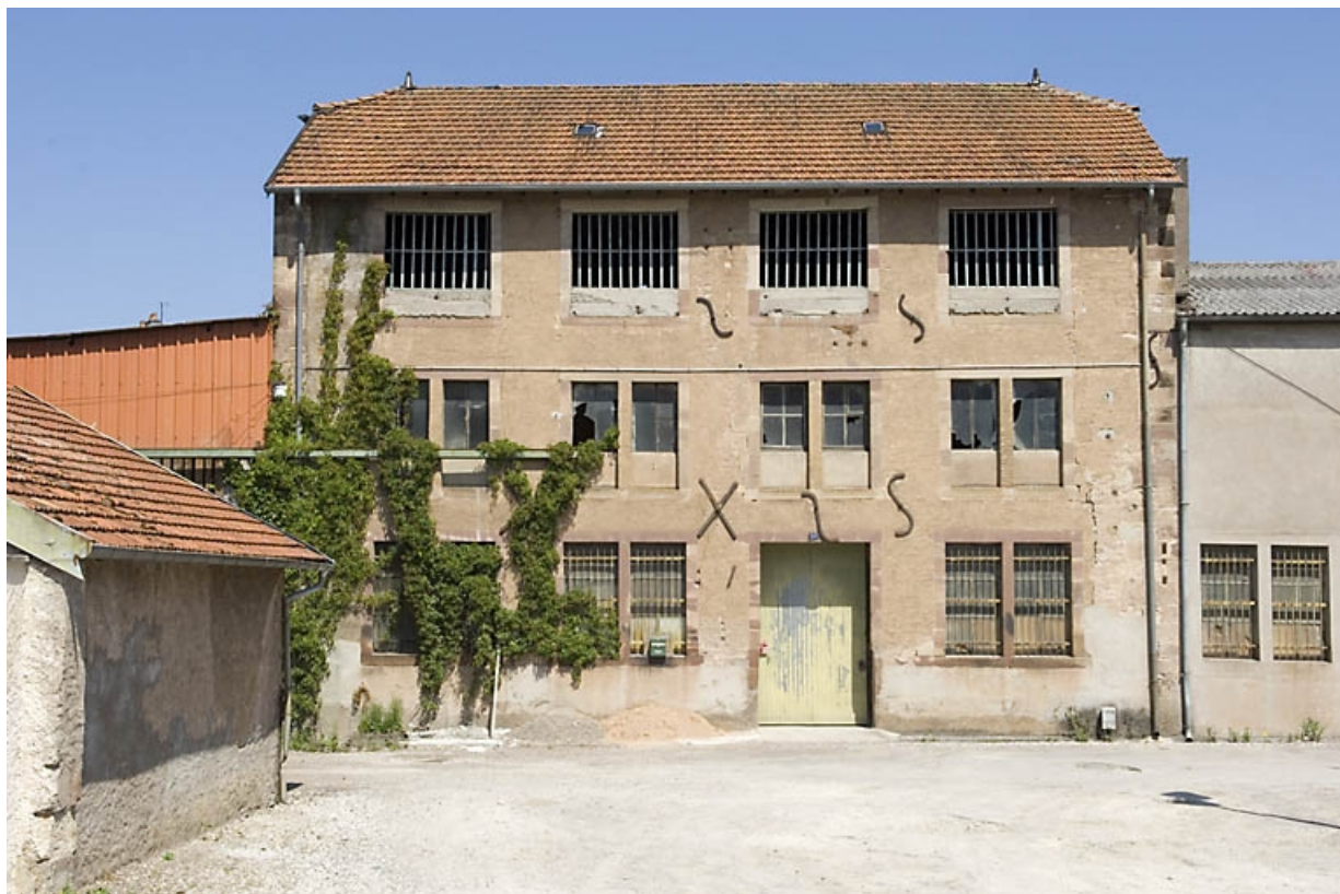
Façade sud du moulin à papier.

70, Luxeuil-les-Bains, 21 rue des Cannes