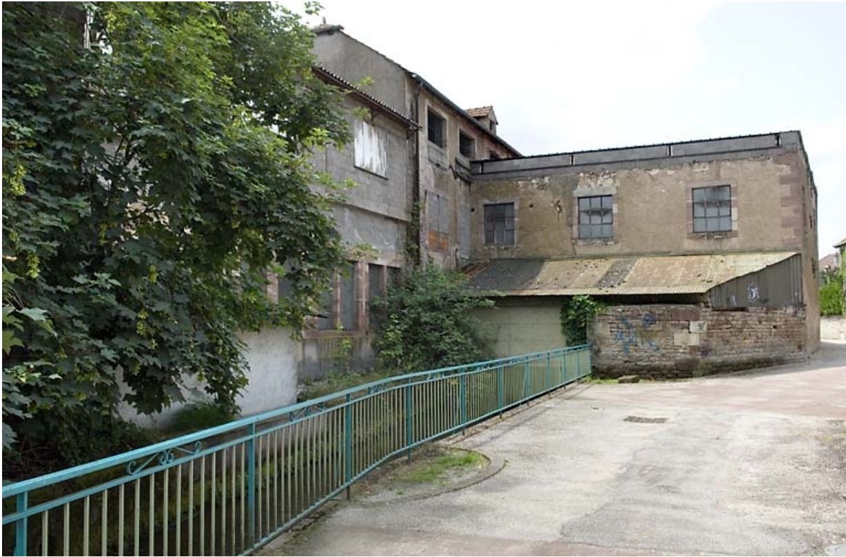
Façades postérieures donnant sur le bief.

70, Luxeuil-les-Bains, 21 rue des Cannes