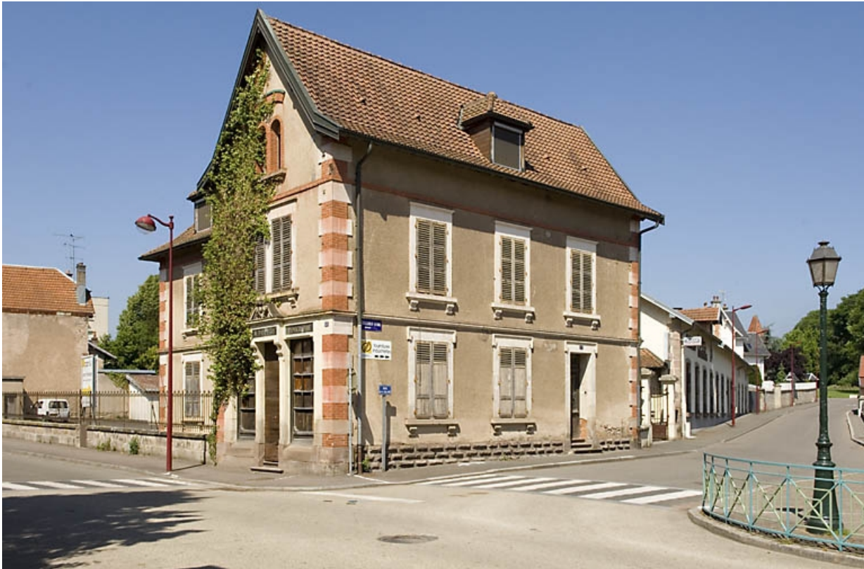
Logement patronal et atelier de fabrication depuis le sud-est.

70, Luxeuil-les-Bains, 2, 4 rue de la Saline