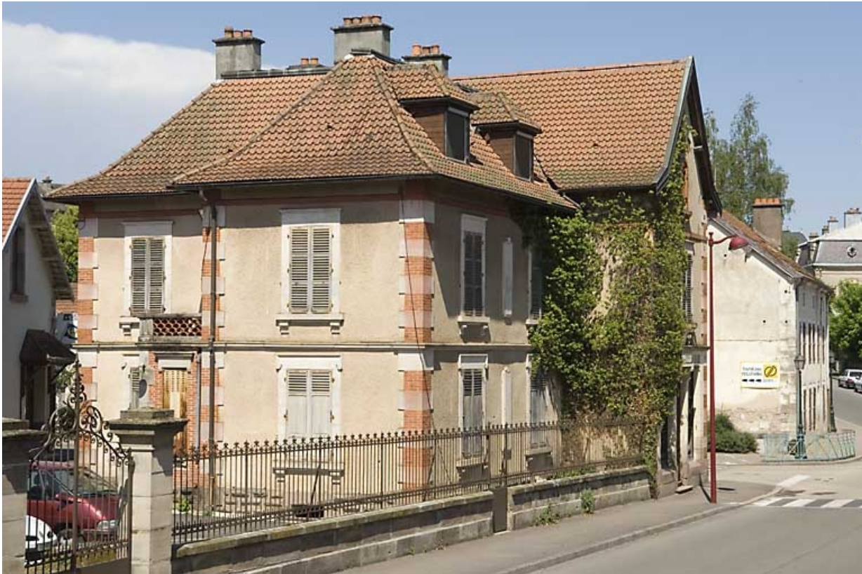
Logement patronal vu de trois quarts.

70, Luxeuil-les-Bains, 2, 4 rue de la Saline