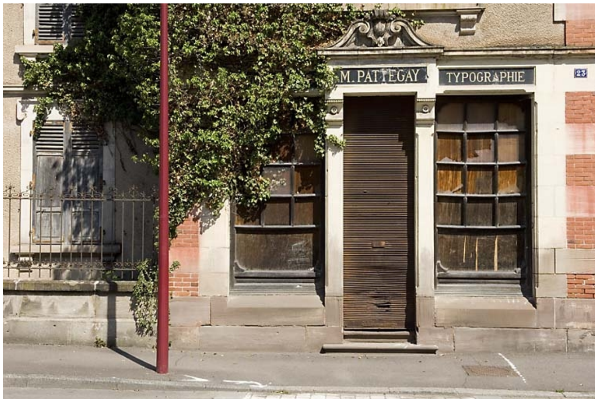
Logement patronal et bureaux. Devanture de l'imprimerie Pattegay. 70, Luxeuil-les-Bains, 2, 4 rue de la Saline