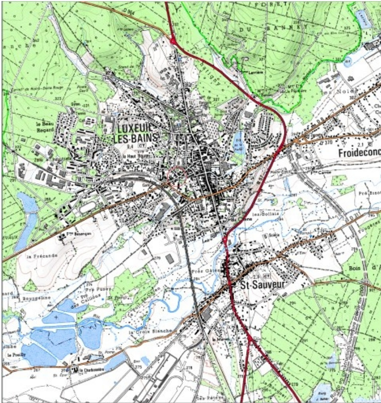
Carte de localisation. Carte topographique au 1:25000, I.G.N., Luxeuil-les-Bains, 3420 E. SCAN 25 © IGN - 2008, Licence n°2008CISE29-68.

70, Luxeuil-les-Bains, 2, 4 rue de la Saline