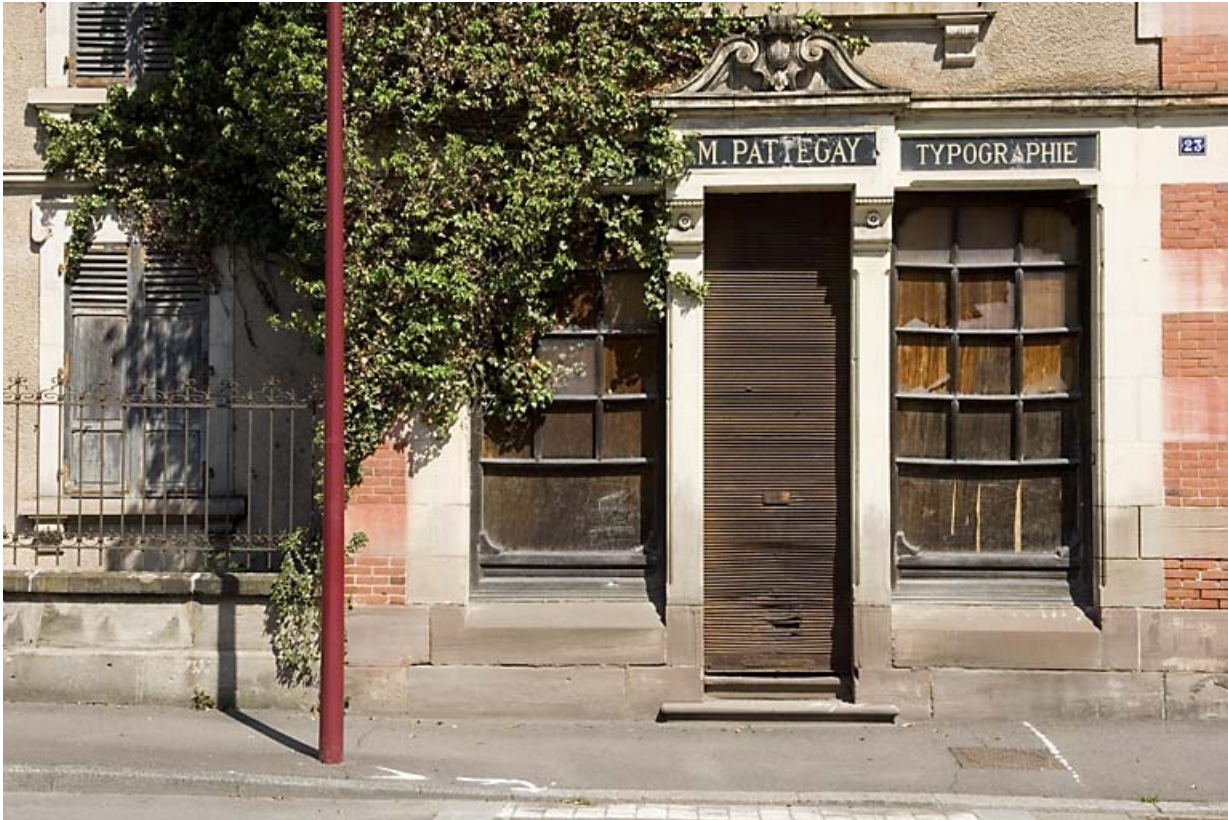
Logement patronal et bureaux. Devanture de l'imprimerie Pattegay. 70, Luxeuil-les-Bains, 2, 4 rue de la Saline