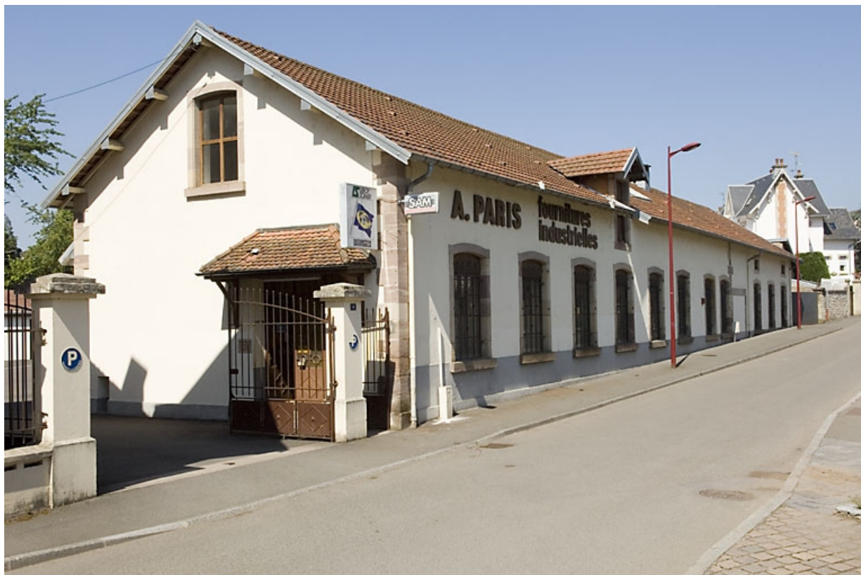
Atelier de fabrication vu de trois quarts. 70, Luxeuil-les-Bains, 2, 4 rue de la Saline