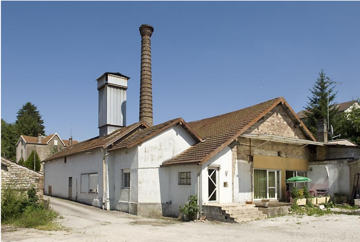
Vue depuis l'ouest.

70, Luxeuil-les-Bains, 6 bis impasse Victor Hugo