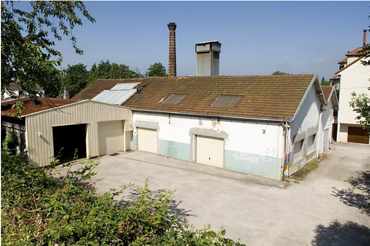
Vue depuis l'est.

70, Luxeuil-les-Bains, 6 bis impasse Victor Hugo