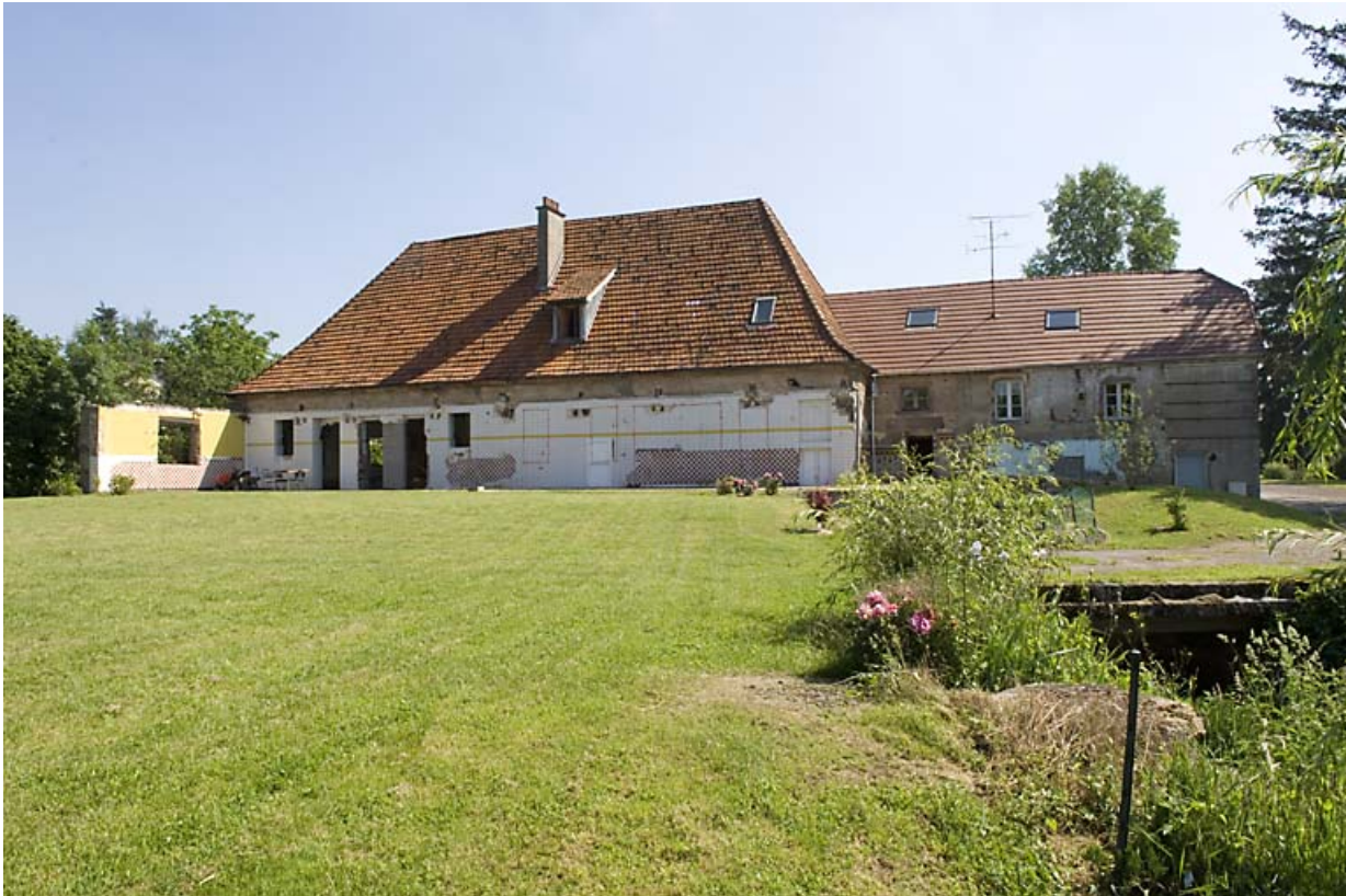
Atelier de fabrication et logement depuis l'ouest.

70, Luxeuil-les-Bains, 57 rue Edouard Herriot