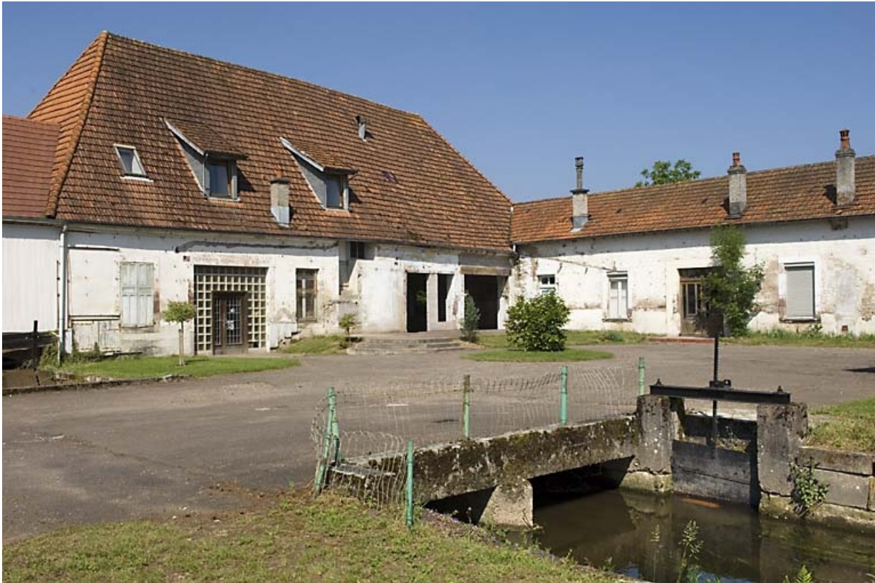
Atelier de fabrication depuis le sud-est.

70, Luxeuil-les-Bains, 57 rue Edouard Herriot