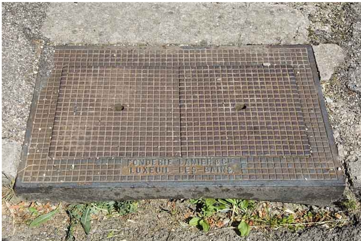
Plaque de voirie en fonte. (commune de Fougerolles).

70, Luxeuil-les-Bains, 37 rue du Haut-Bourey