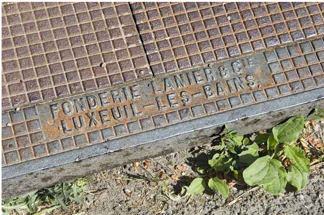
Plaque de voirie en fonte. Détail (commune de Fougerolles).

70, Luxeuil-les-Bains, 37 rue du Haut-Bourey