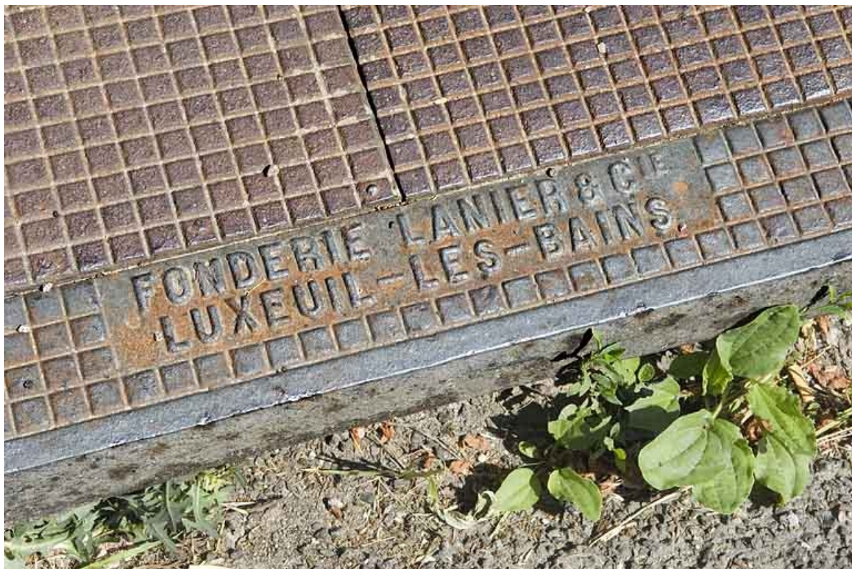
Plaque de voirie en fonte. Détail (commune de Fougerolles).

70, Luxeuil-les-Bains, 37 rue du Haut-Bourey