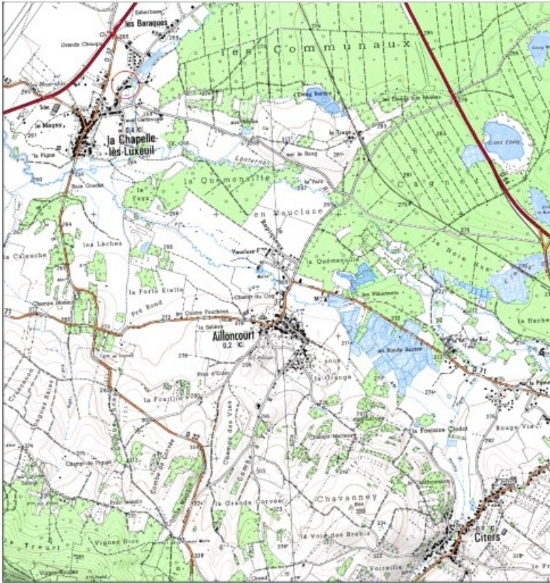
Carte de localisation. Carte topographique au 1:25000, I.G.N., Luxeuil-les-Bains, 3420 E. SCAN 25

70, La Chapelle-lès-Luxeuil, 17 rue du Moulin