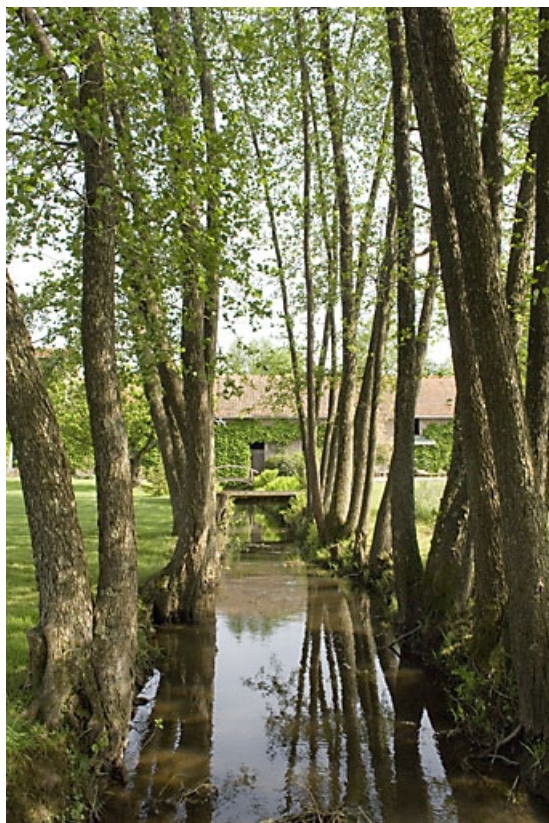
Bief de dérivation. Vue depuis l'aval.

70, La Chapelle-lès-Luxeuil, 17 rue du Moulin