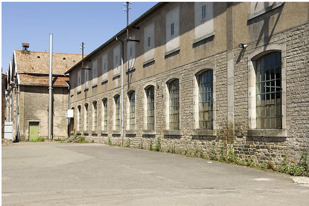
Élévation sur rue de l'atelier de préparation. 70, Saint-Sauveur, 44 rue du Maréchal Lyautey