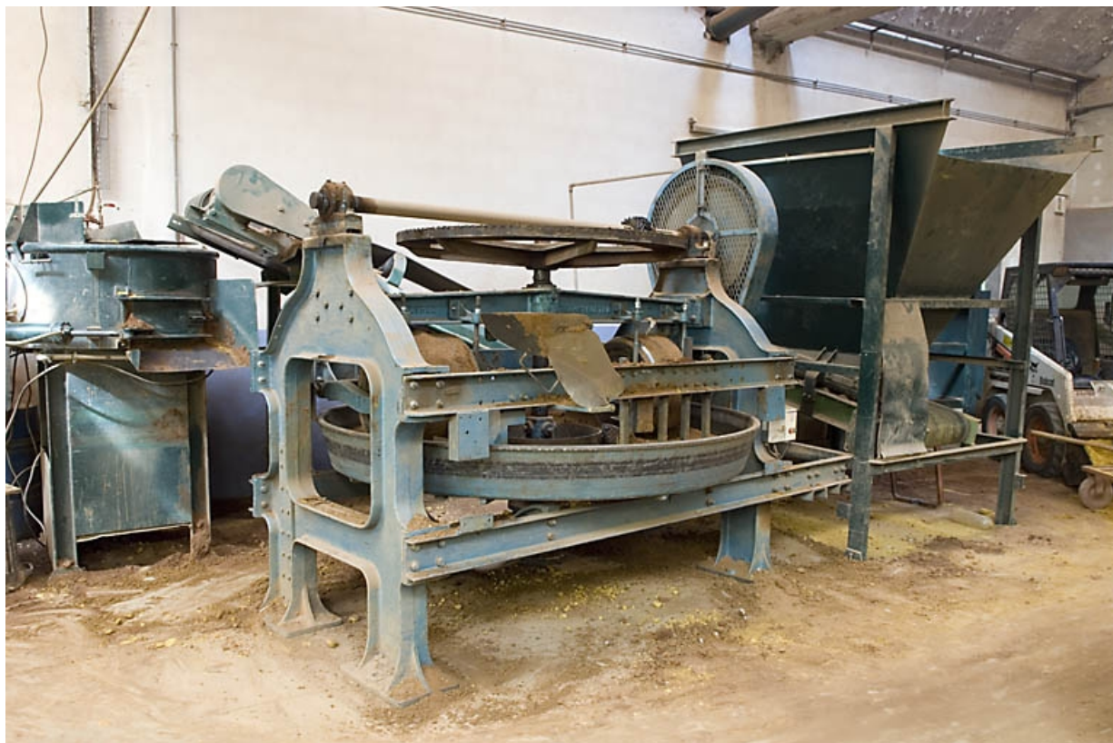
Malaxeur (préparation du sable pour les moules).

70, Saint-Sauveur, 44 rue du Maréchal Lyautey