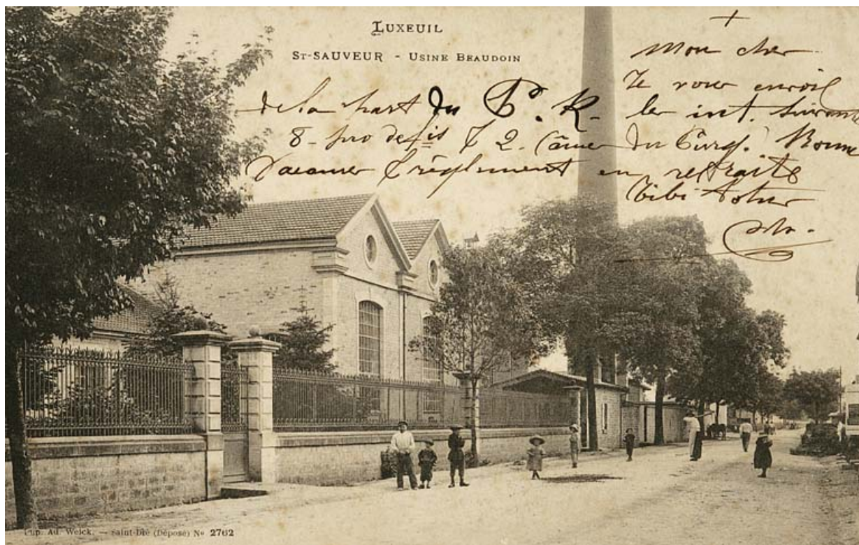
Luxeuil. Saint-Sauveur - Usine Beaudoin. 70, Saint-Sauveur, 44 rue du Maréchal Lyautey