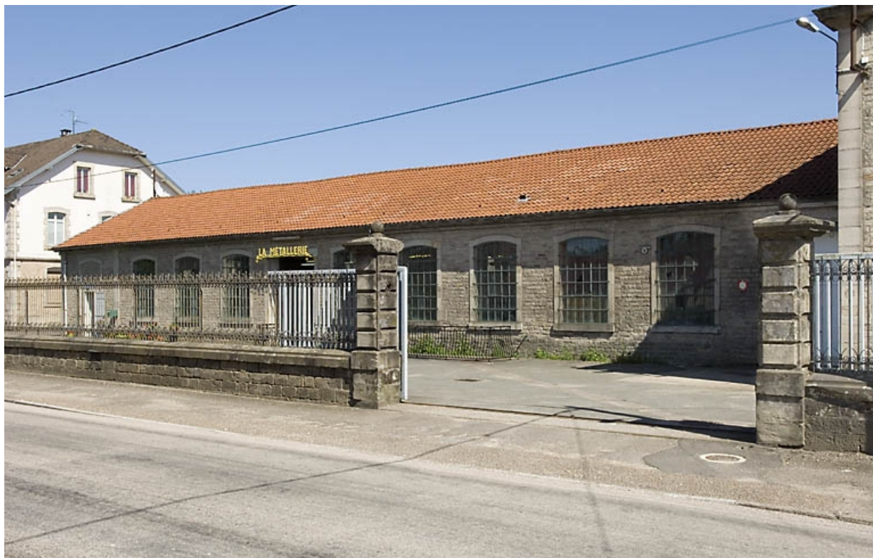
Cour et bâtiment nord en rez-de-chaussée. 70, Saint-Sauveur, 44 rue du Maréchal Lyautey