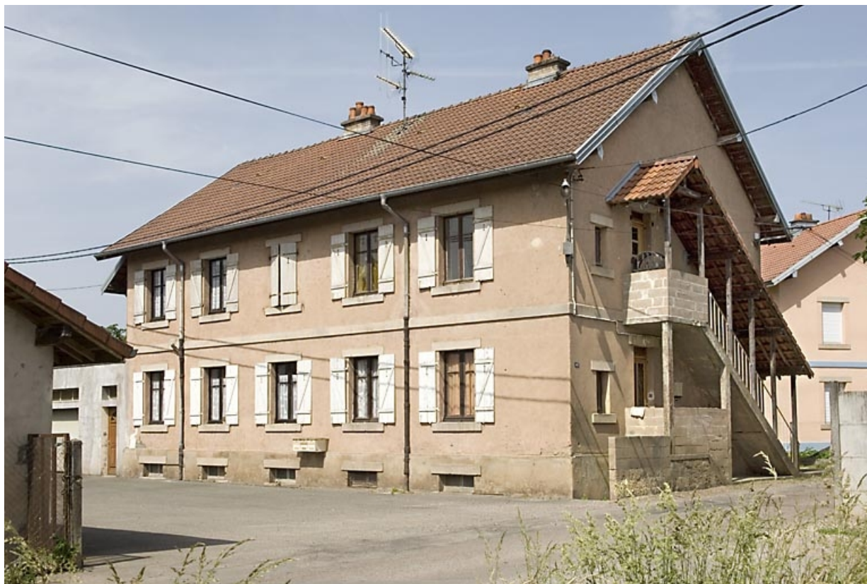
Logement ouvrier à 4 appartements (rue Jean Jaurès). 70, Saint-Sauveur, 44 rue du Maréchal Lyautey