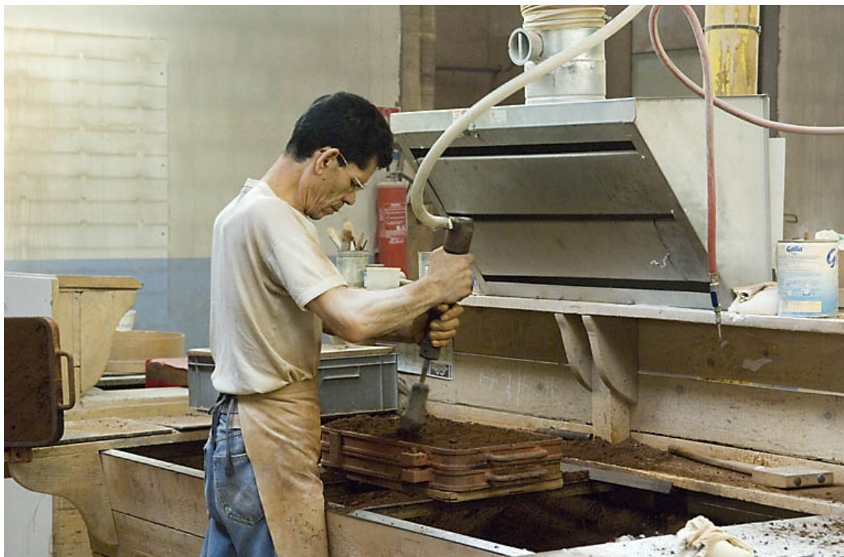
Poste de moulage. Le sable est tassé avec un outils pneumatique.

70, Saint-Sauveur, 44 rue du Maréchal Lyautey