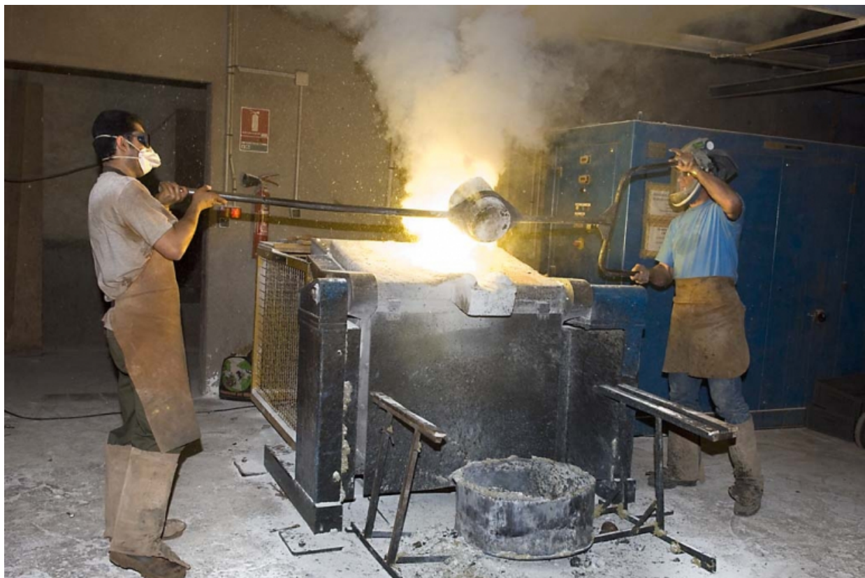
Le contenu de la poche est reversé dans le four.

70, Saint-Sauveur, 44 rue du Maréchal Lyautey