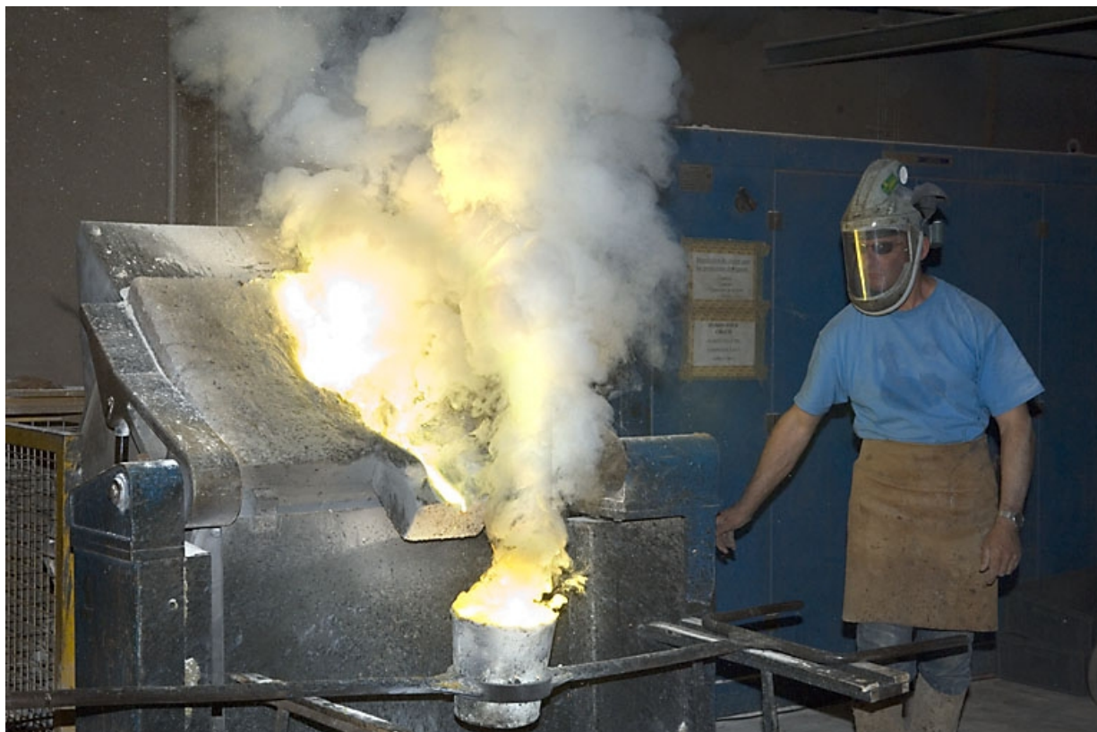
Bascule du four pour le second remplissage de la poche.

70, Saint-Sauveur, 44 rue du Maréchal Lyautey