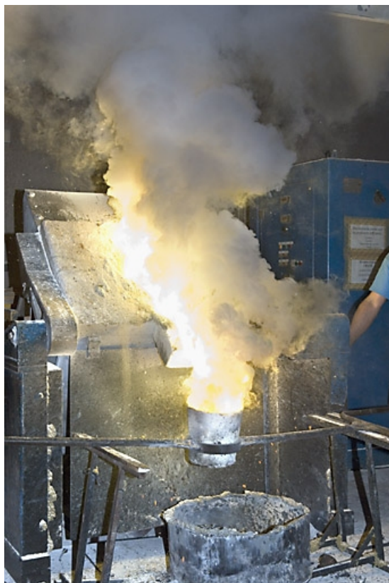
Four électrique. Remplissage de la poche (vue rapprochée). 70, Saint-Sauveur, 44 rue du Maréchal Lyautey