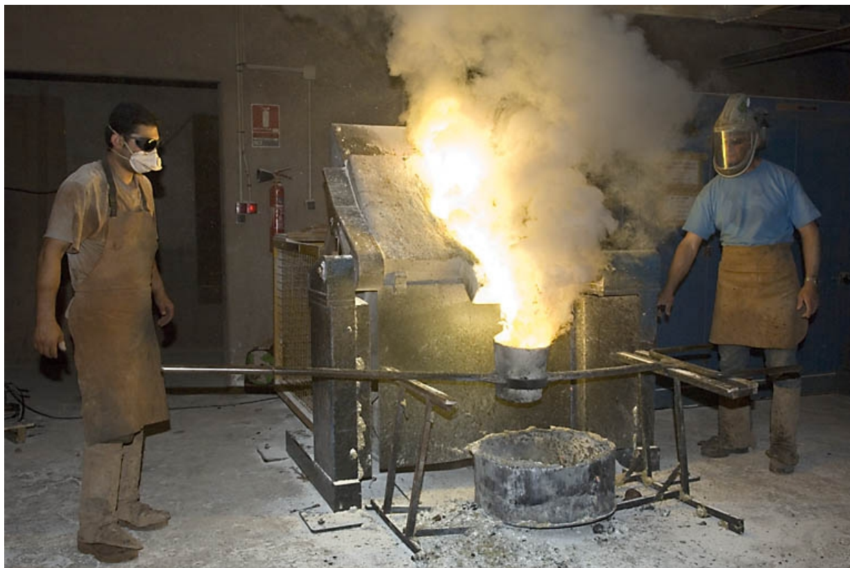
Four électrique. Remplissage de la poche.

70, Saint-Sauveur, 44 rue du Maréchal Lyautey