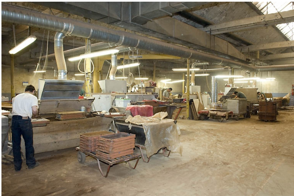
Atelier de moulage. Vue d'ensemble depuis l'ouest.

70, Saint-Sauveur, 44 rue du Maréchal Lyautey