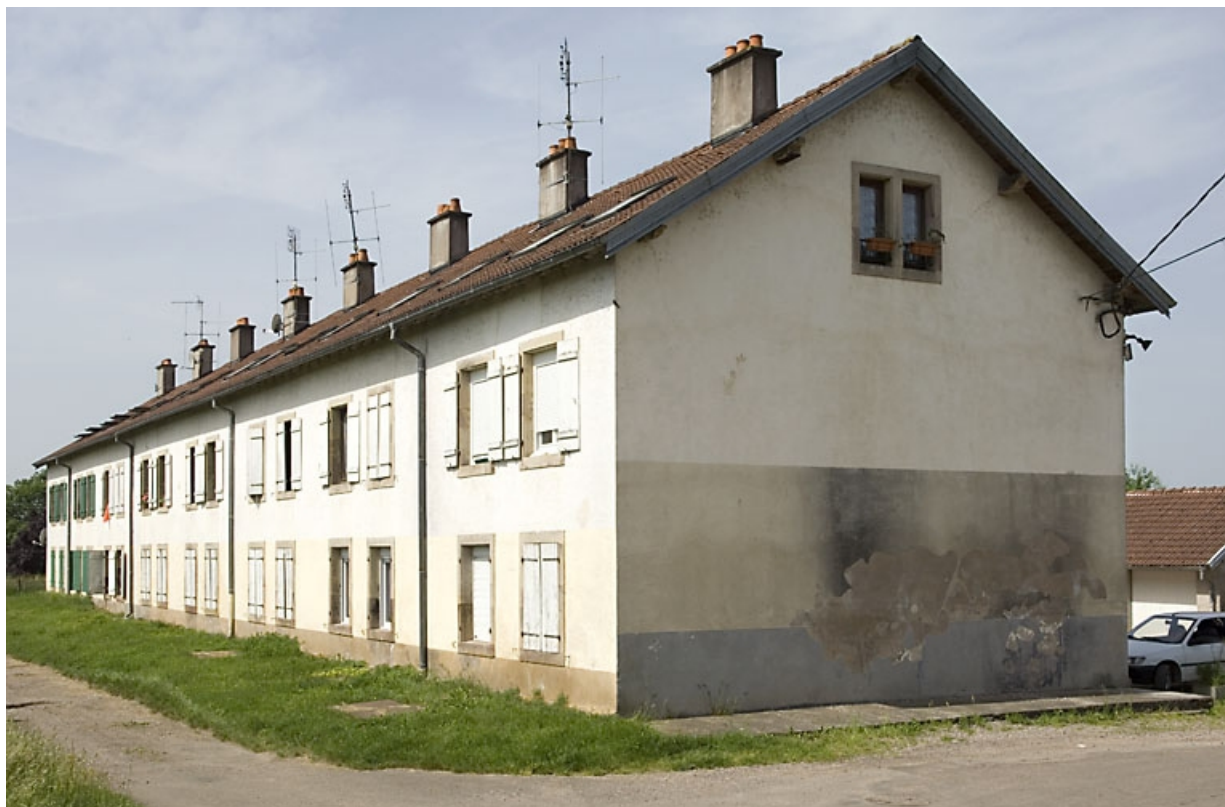
Logement ouvrier collectif (rue Jean Jaurès). 70, Saint-Sauveur, 44 rue du Maréchal Lyautey