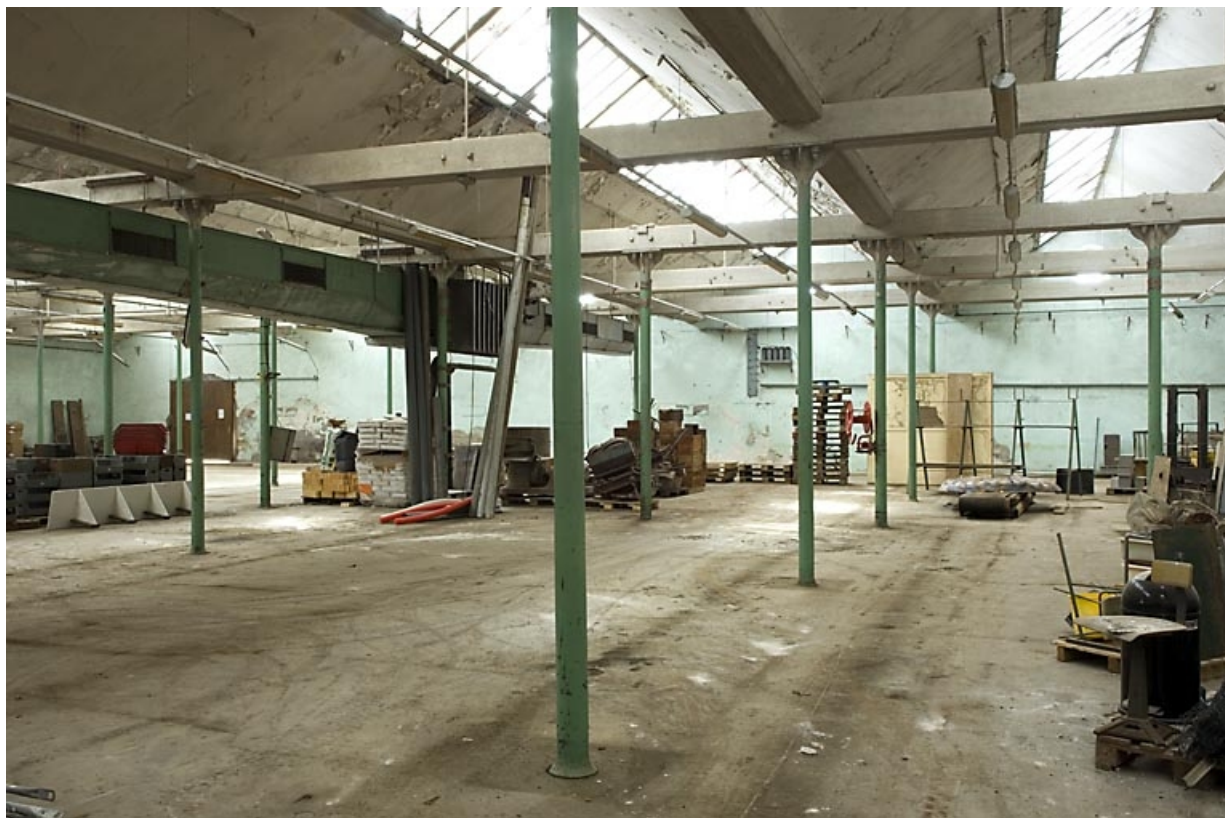
Atelier de fabrication de l'ancienne filature. Travées délimitées par des colonnes de fonte et couvertes de sheds. 70, Saint-Sauveur, 44 rue du Maréchal Lyautey