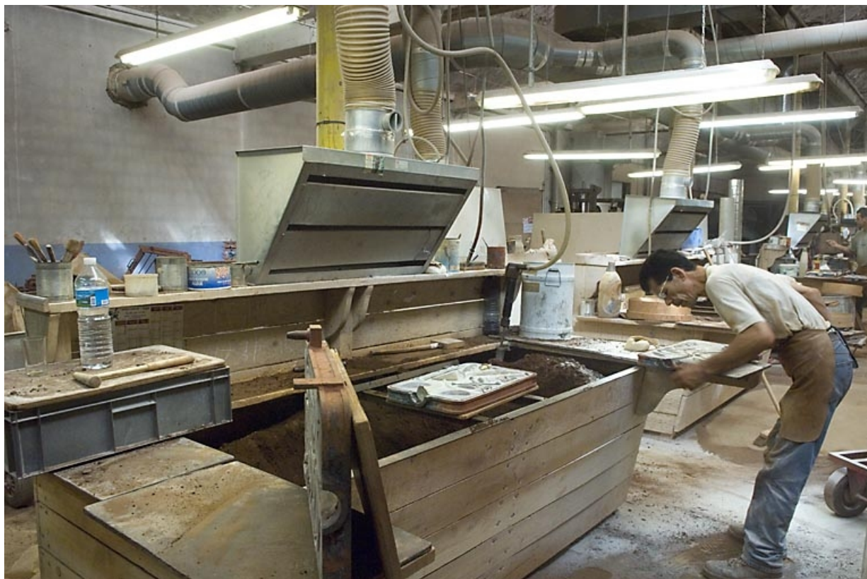
Poste de moulage. Préparation d'un moule. 70, Saint-Sauveur, 44 rue du Maréchal Lyautey