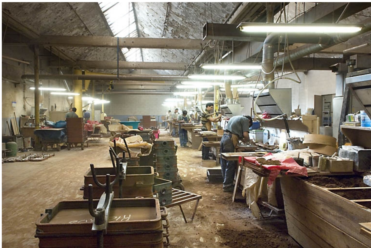
Atelier de moulage. Vue d'ensemble depuis le nord-ouest.

70, Saint-Sauveur, 44 rue du Maréchal Lyautey