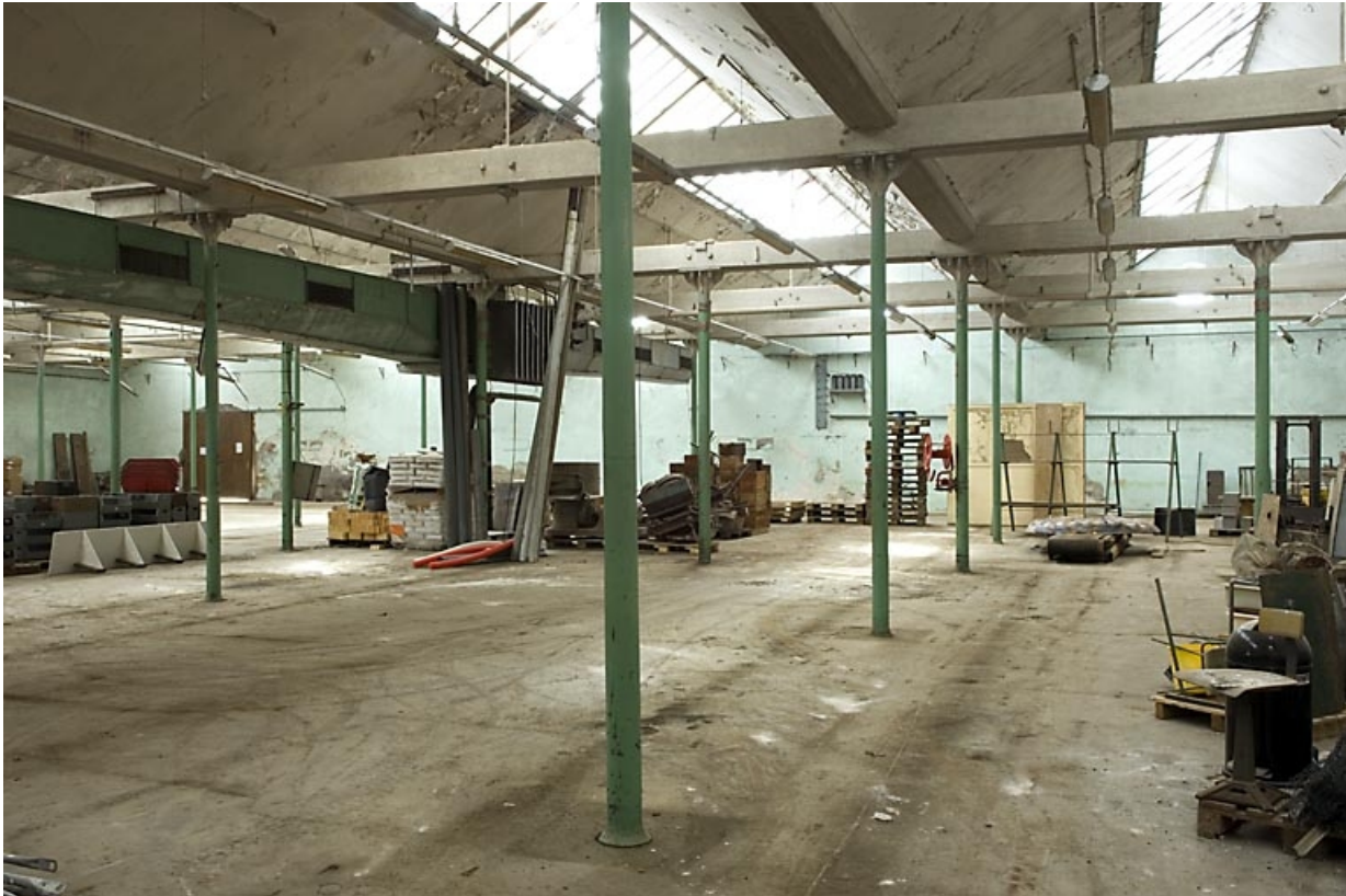
Atelier de fabrication de l'ancienne filature. Travées délimitées par des colonnes de fonte et couvertes de sheds. 70, Saint-Sauveur, 44 rue du Maréchal Lyautey