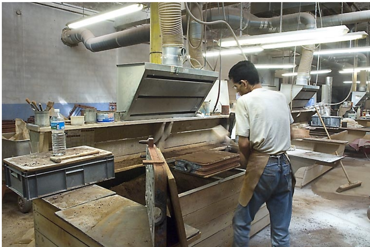
Poste de moulage. Le sable est tassé avec un instrument manuel.

70, Saint-Sauveur, 44 rue du Maréchal Lyautey