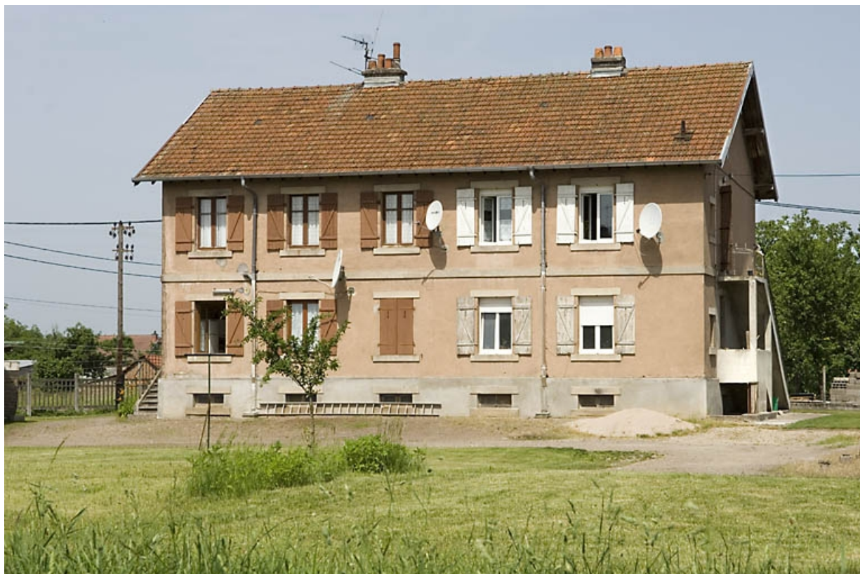
Logement ouvrier à 4 appartements. Elévation sud.

70, Saint-Sauveur, 44 rue du Maréchal Lyautey