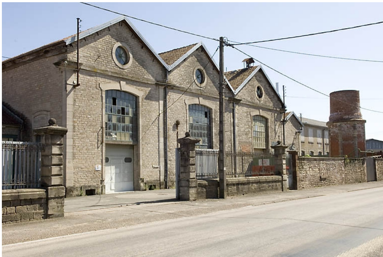
Murs-pignons de la salle des machines. Vue de trois quarts.

70, Saint-Sauveur, 44 rue du Maréchal Lyautey