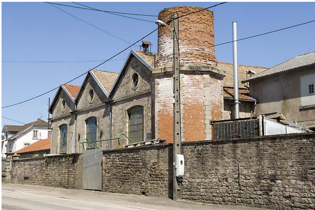
Salle des machines et base de la cheminée vues de trois quarts.

70, Saint-Sauveur, 44 rue du Maréchal Lyautey