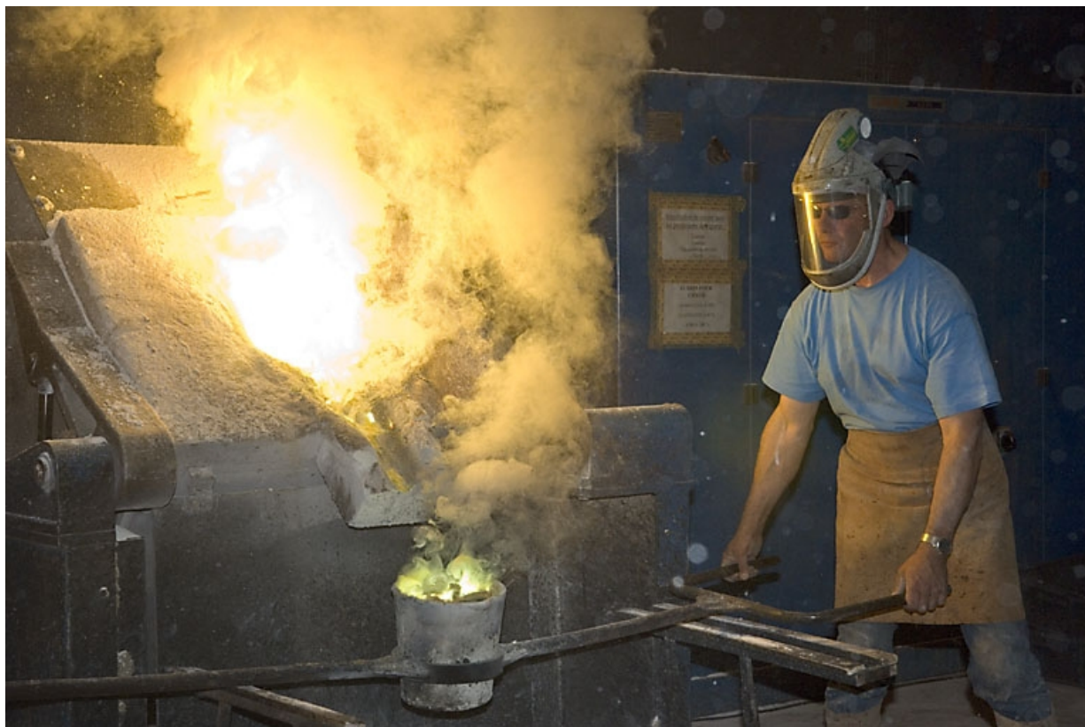
Transport de la poche de bronze.