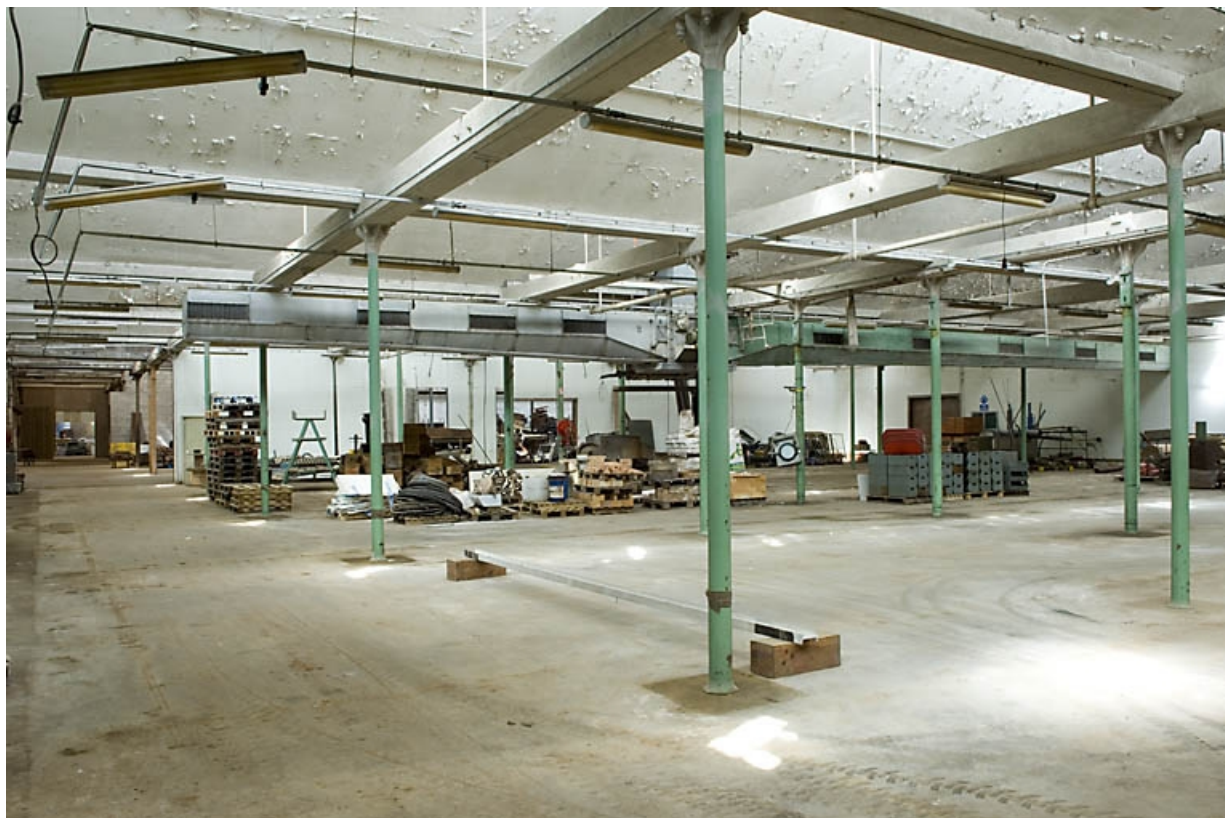
Atelier de fabrication de l'ancienne filature. Vue d'ensemble.

70, Saint-Sauveur, 44 rue du Maréchal Lyautey