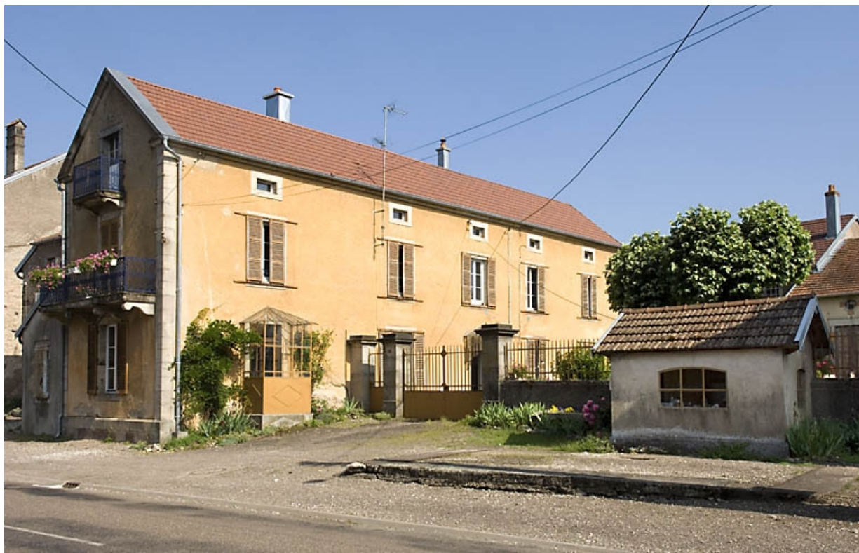
Logement et local de la balance du pont bascule.