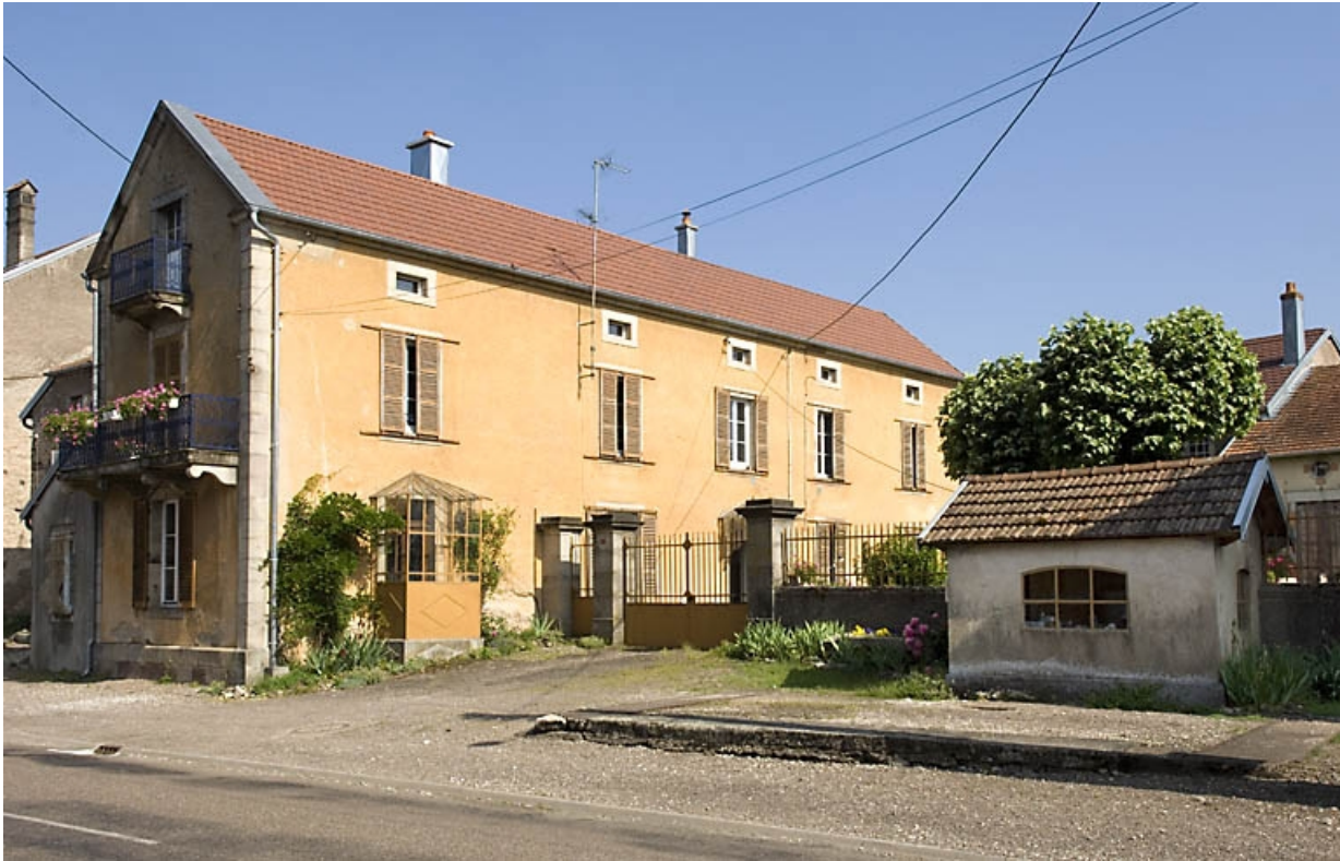
Logement et local de la balance du pont bascule.