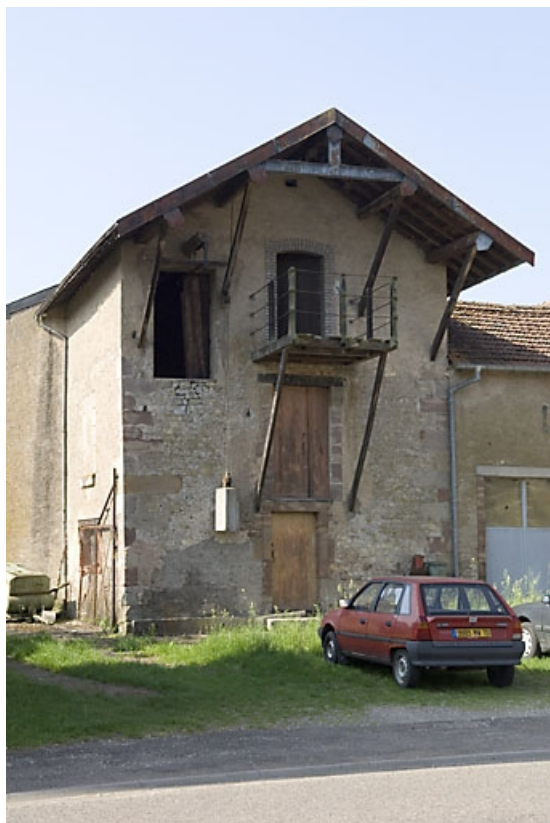
Façade de l'entrepôt industriel. 70, Baudoncourt rue de la Chapelle