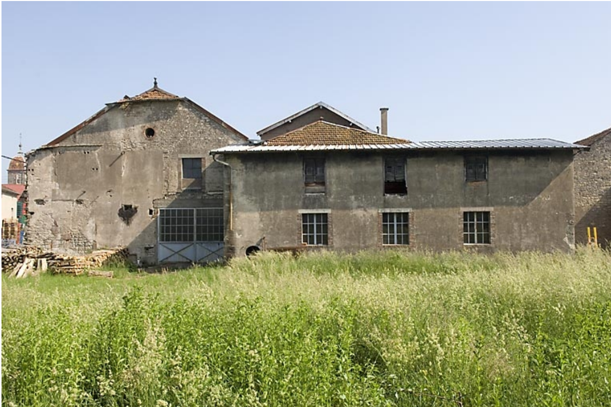
Façades postérieures de la féculerie.