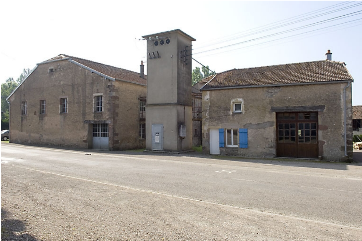
Vue d'ensemble depuis le nord.