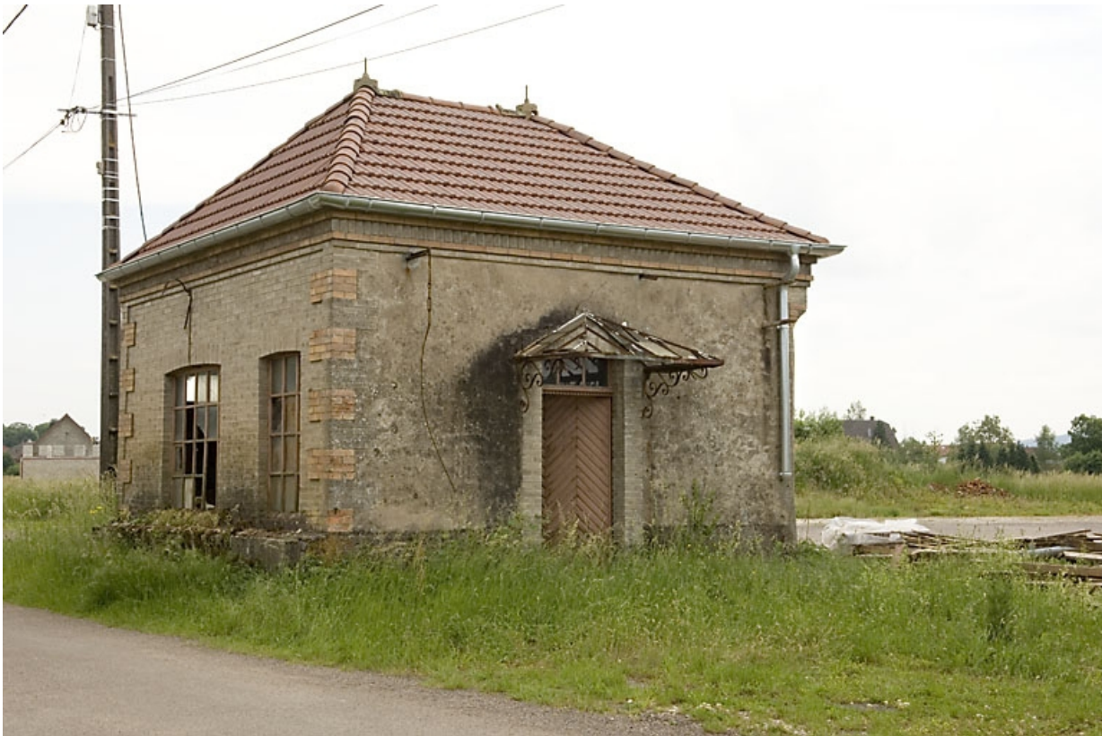
Local de la balance du pont bascule.