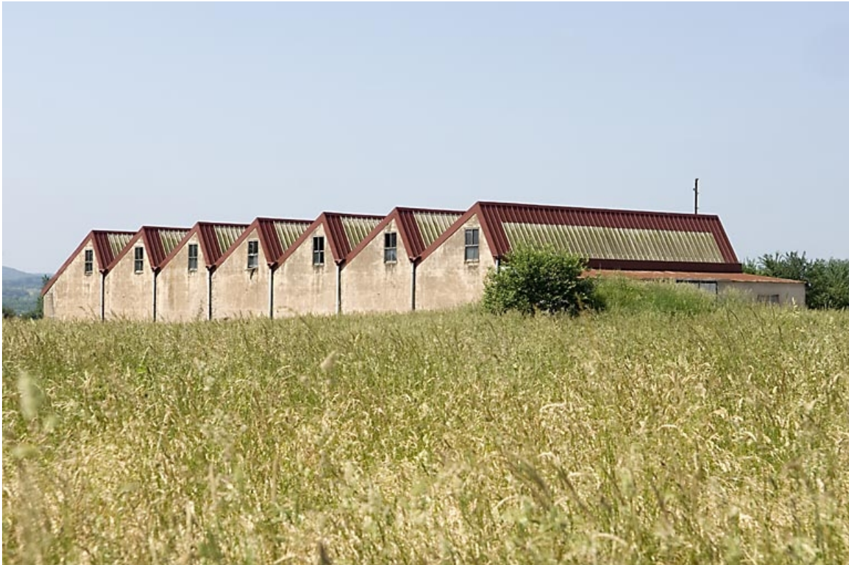
Atelier de fabrication (retorderie). Vue depuis l'est.