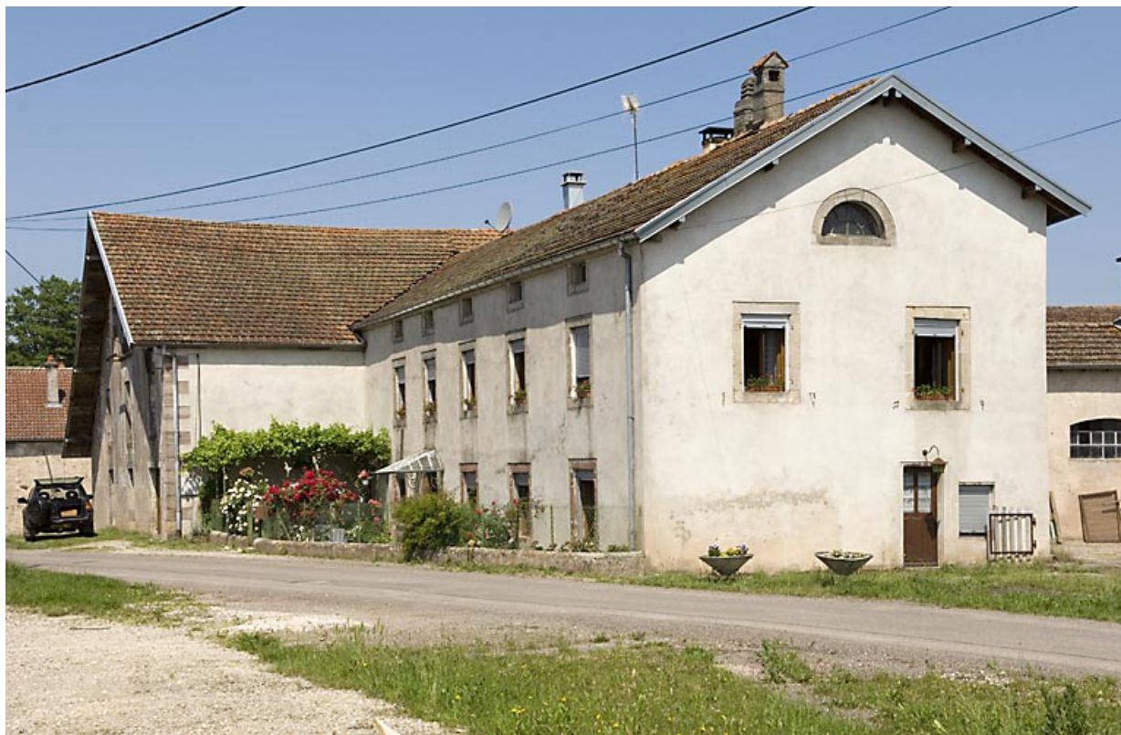
Atelier de fabrication et logement depuis le sud-est.