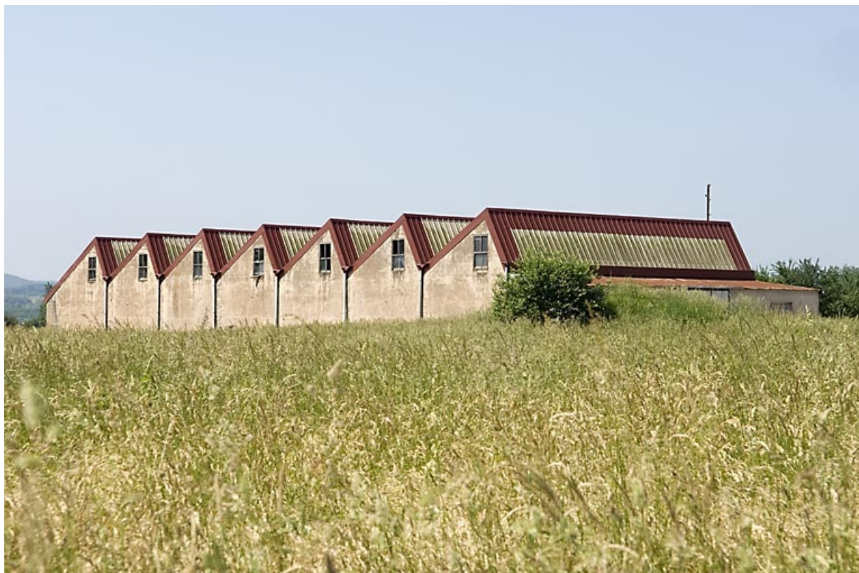
Atelier de fabrication (retorderie). Vue depuis l'est.