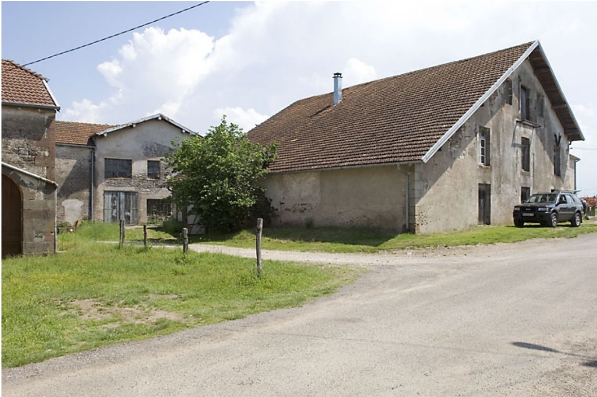
Atelier de fabrication vu de trois quarts.