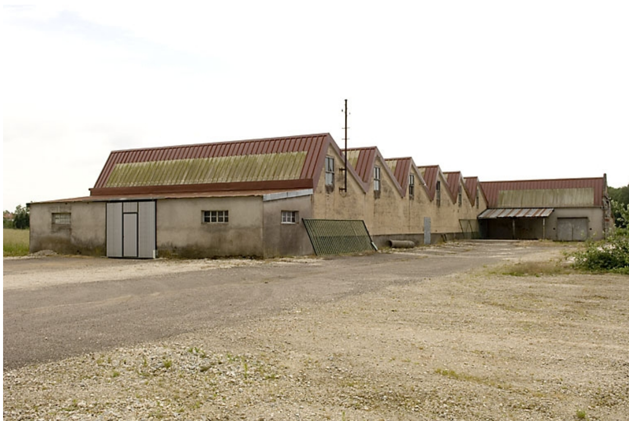
Atelier de fabrication (retorderie). Vue depuis le nord.