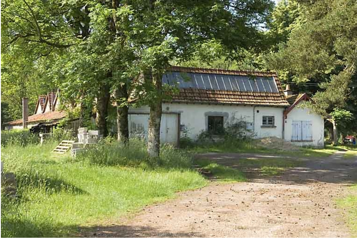
Vue d'ensemble depuis la route.

70, Breuches, 16 route de Saint-Sauveur, lieudit : le Preilly