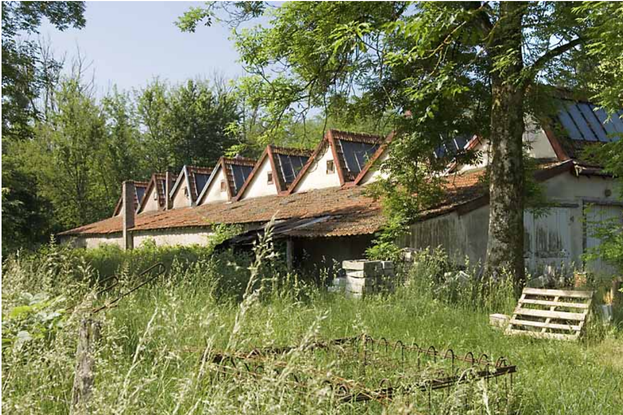
Pignons ouest de l'atelier de fabrication.

70, Breuches, 16 route de Saint-Sauveur, lieudit : le Preilly