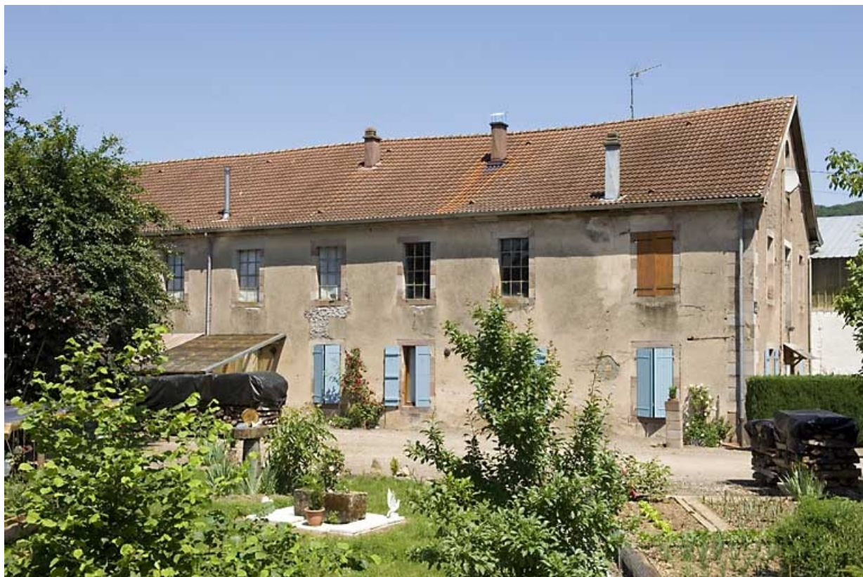
Extrémité de la façade sud de l'atelier de fabrication.