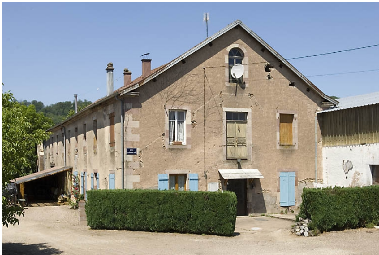
Atelier de fabrication. Vue depuis le sud-est. 70, Breuchotte rue du Grand Pré