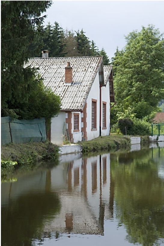
Atelier de réparation sur le bief d'amenée.