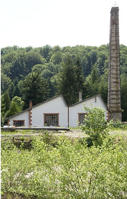
Atelier de réparation et cheminée depuis le nord. 70, Breuchotte rue de Bouhay d'Amont