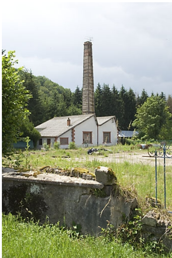
Atelier de réparation et cheminée depuis l'est.