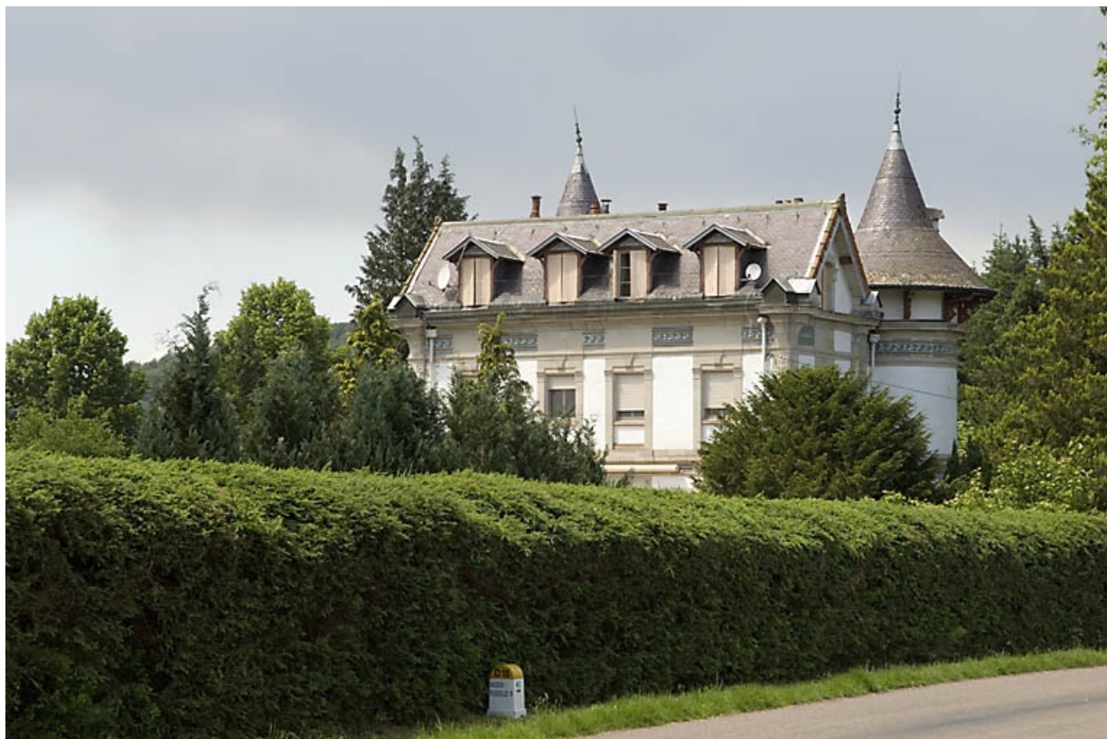
Logement patronal. Vue depuis le sud-est. 70, Breuchotte rue de Bouhay d'Amont