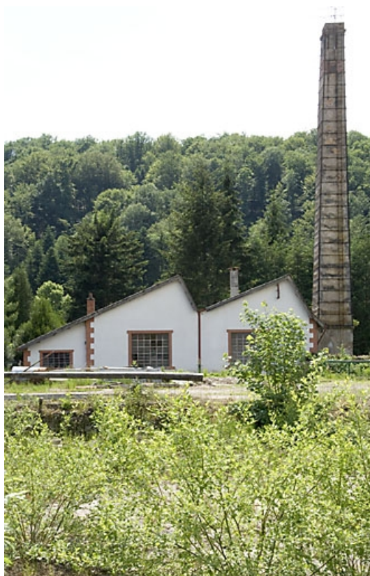
Atelier de réparation et cheminée depuis le nord. 70, Breuchotte rue de Bouhay d'Amont