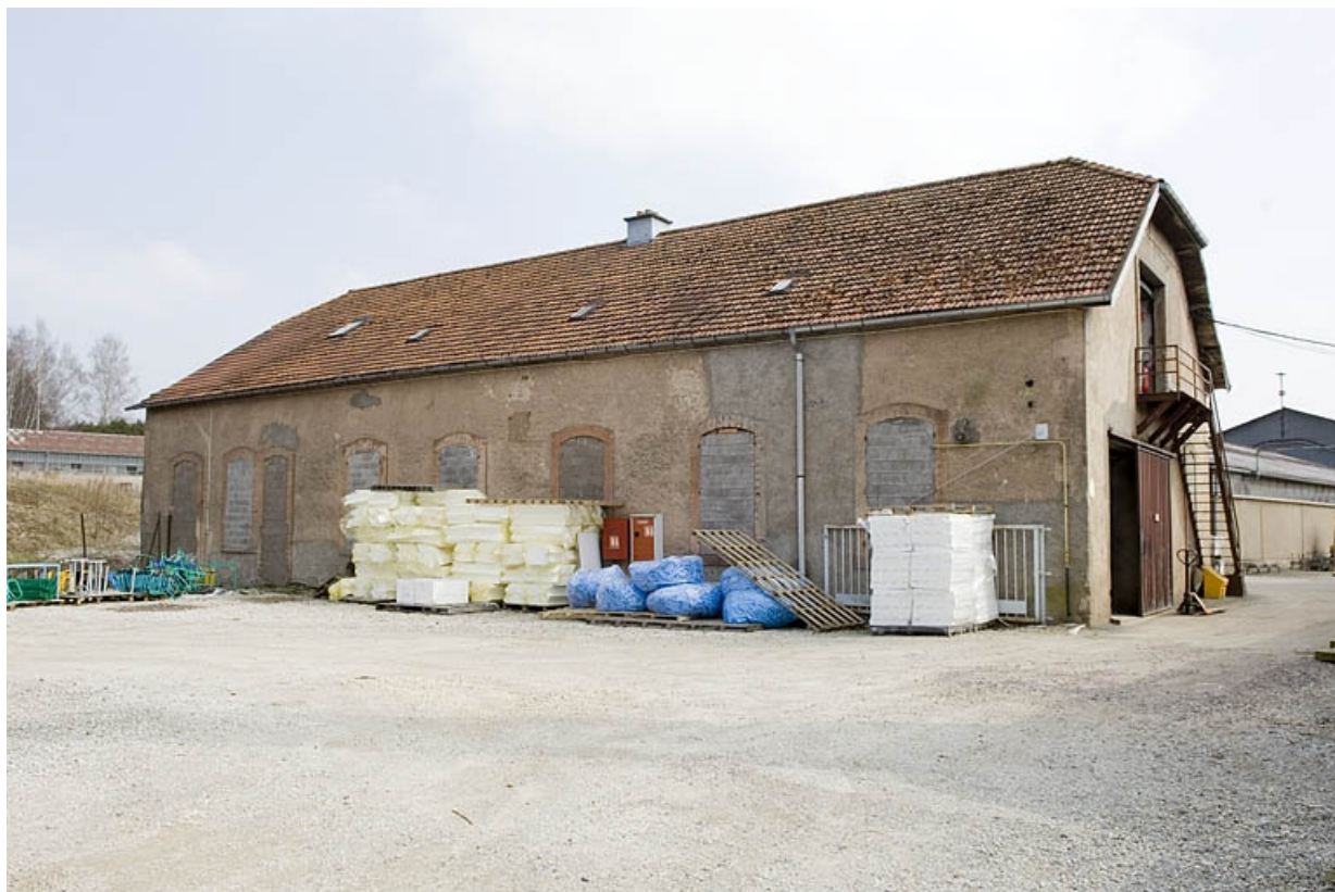
Moulin d'aval. Vue de trois quarts arrière.

70, Froideconche, 118 avenue de la Vallée du Breuchin, lieudit : la Corveraine