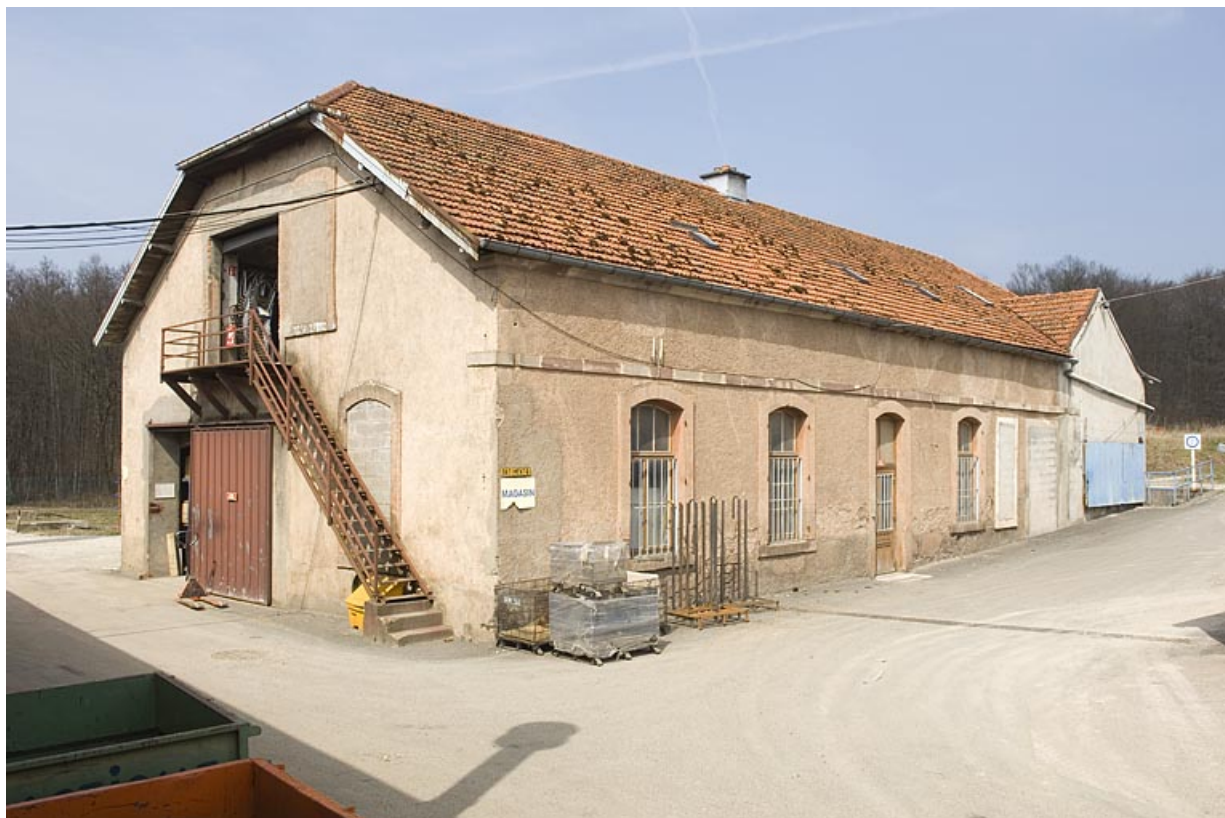
Moulin d'aval. Vue de trois quarts.

70, Froideconche, 118 avenue de la Vallée du Breuchin, lieudit : la Corveraine