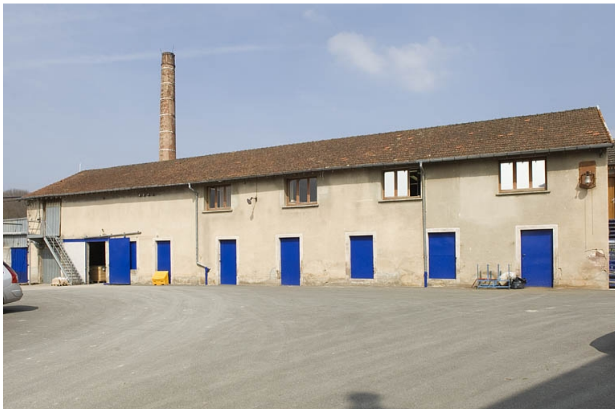
Atelier de fabrication original de l'usine de meubles. Façade ouest.

70, Froideconche, 118 avenue de la Vallée du Breuchin, lieudit : la Corveraine