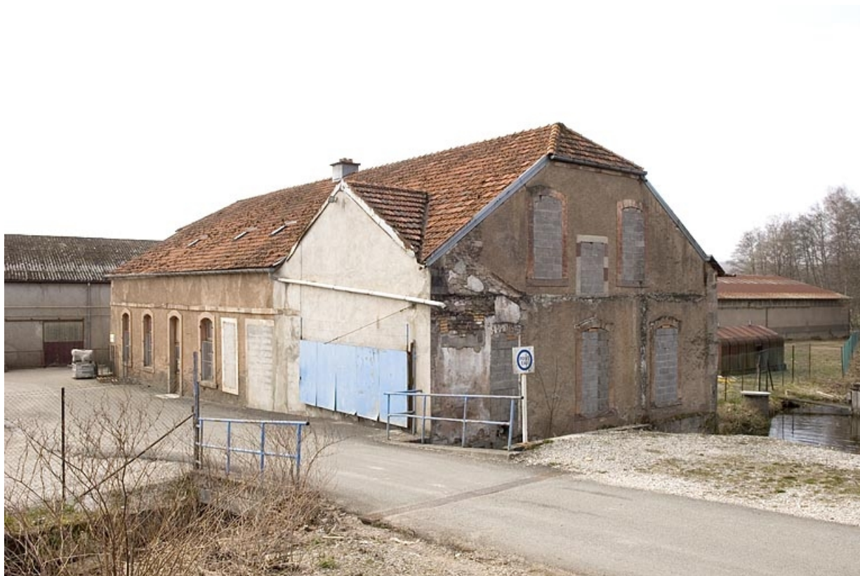
Moulin d'aval. Vue depuis l'est.

70, Froideconche, 118 avenue de la Vallée du Breuchin, lieudit : la Corveraine