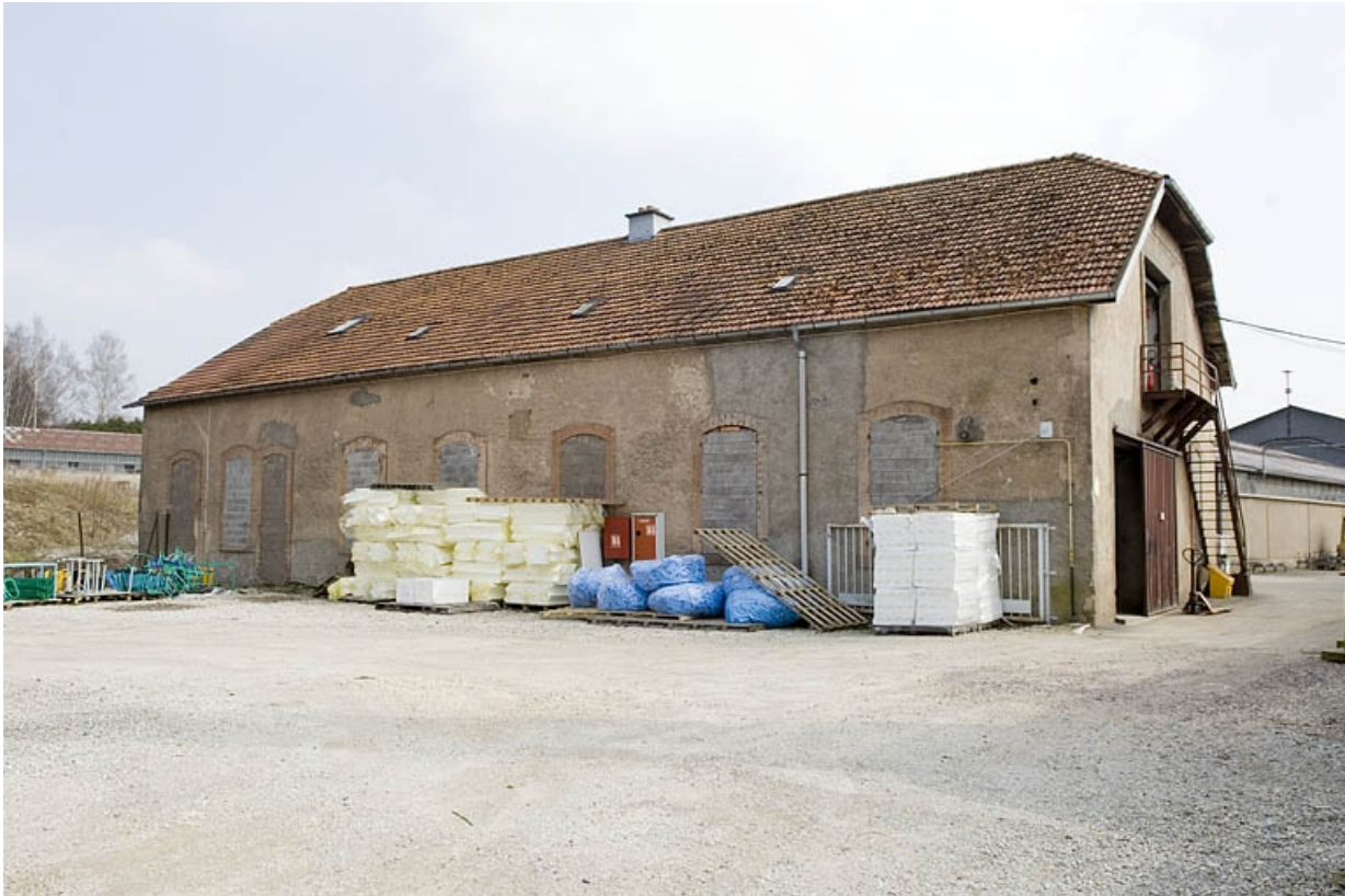
Moulin d'aval. Vue de trois quarts arrière.

70, Froideconche, 118 avenue de la Vallée du Breuchin, lieudit : la Corveraine