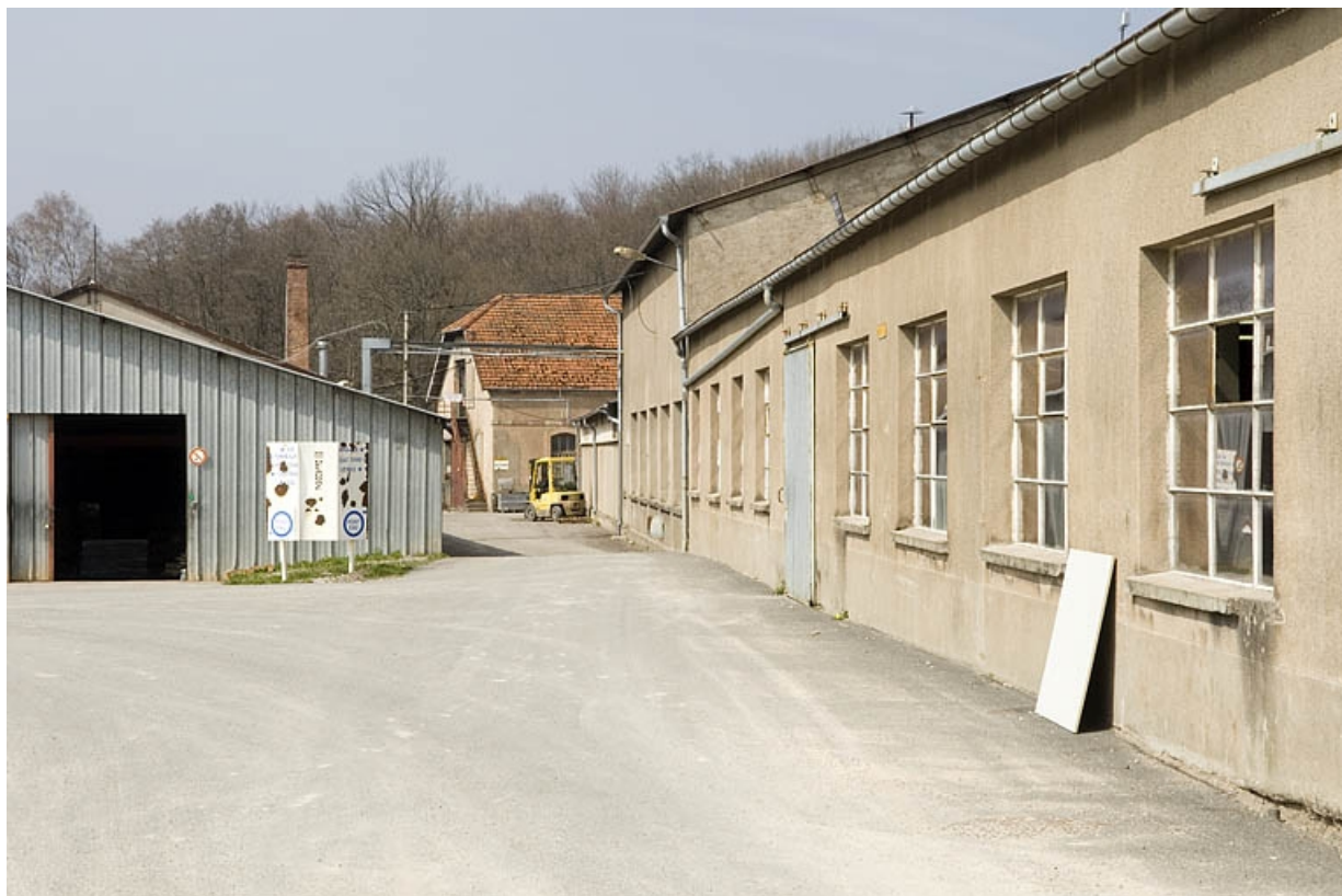
Façade ouest d'un atelier de menuiserie.

70, Froideconche, 118 avenue de la Vallée du Breuchin, lieudit : la Corveraine