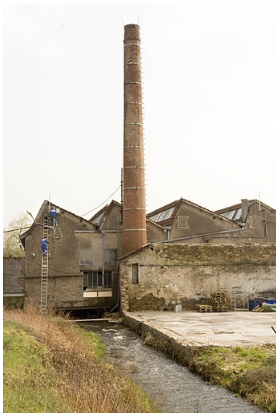
Façade nord-ouest de l'atelier de fabrication et cheminée.

70, Froideconche, 118 avenue de la Vallée du Breuchin, lieudit : la Corveraine