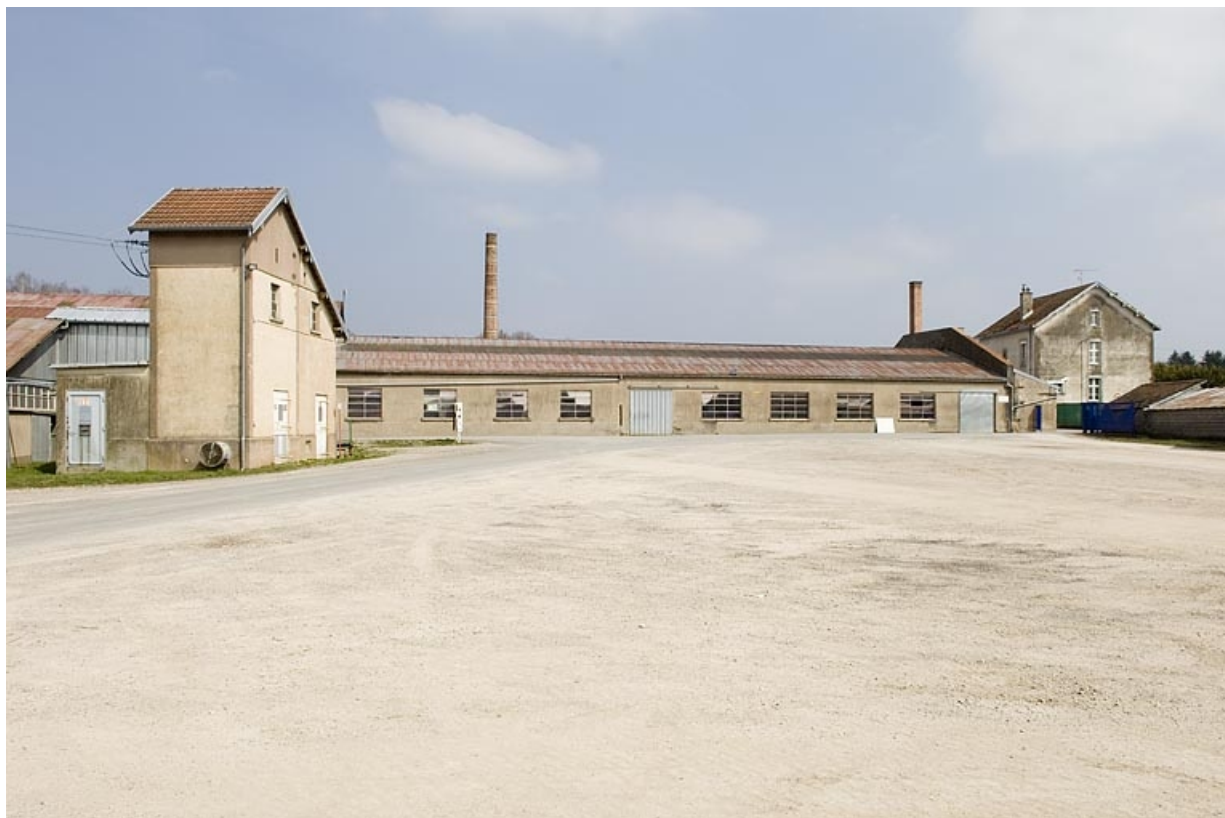
Transformateur, atelier de fabrication et logement patronal depuis l'ouest. 70, Froideconche, 118 avenue de la Vallée du Breuchin, lieudit : la Corveraine