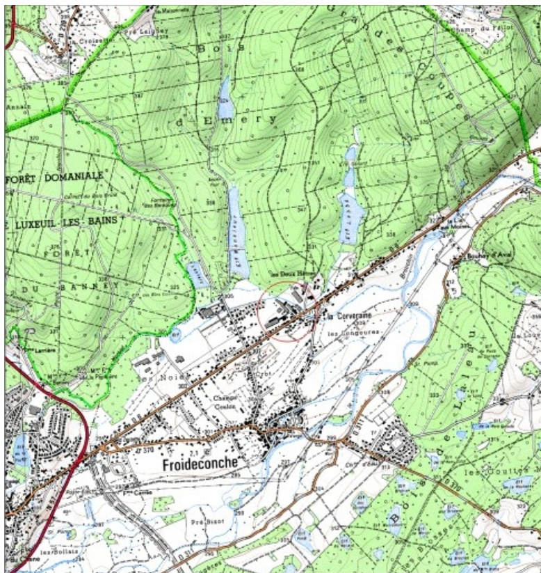
Carte de localisation. Carte topographique au 1:25000, I.G.N., Luxeuil-les-Bains, 3420 E. SCAN 25 © IGN - 2008, Licence n°2008CISE29-68.

70, Froideconche, 118 avenue de la Vallée du Breuchin, lieudit : la Corveraine