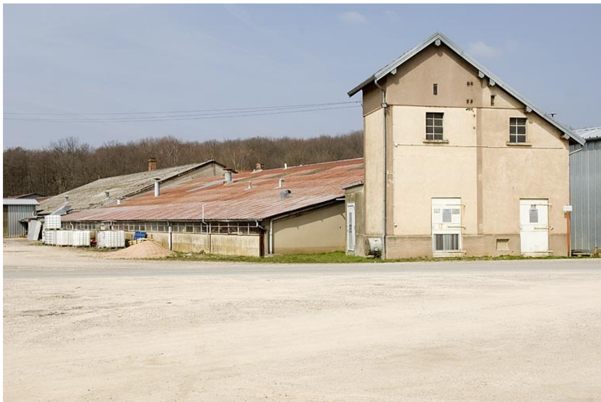
Atelier de fabrication et transformateur depuis la cour sud.

70, Froideconche, 118 avenue de la Vallée du Breuchin, lieudit : la Corveraine