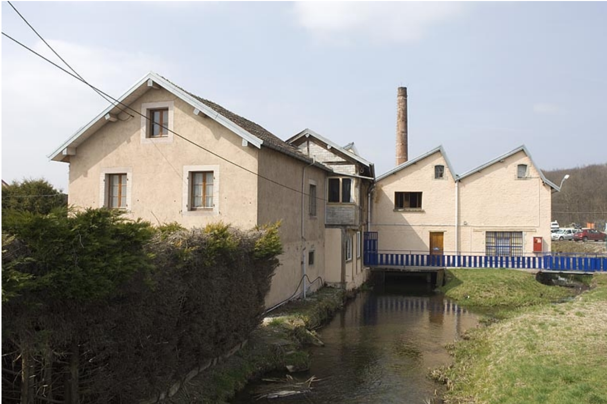
Bureaux et ateliers depuis l'amont du bief du Morbief.

70, Froideconche, 118 avenue de la Vallée du Breuchin, lieudit : la Corveraine