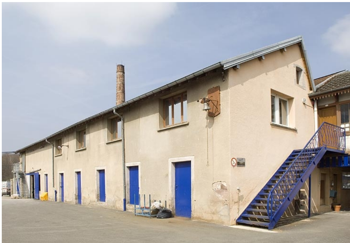
Atelier de fabrication originel de l'usine de meubles. Vue de trois quarts. 70, Froideconche, 118 avenue de la Vallée du Breuchin, lieudit : la Corveraine