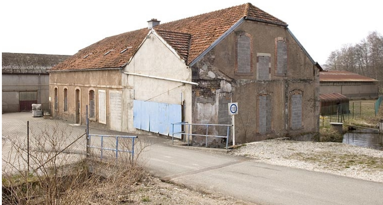
Moulin d'aval. Vue depuis l'est.

70, Froideconche, 118 avenue de la Vallée du Breuchin, lieudit : la Corveraine