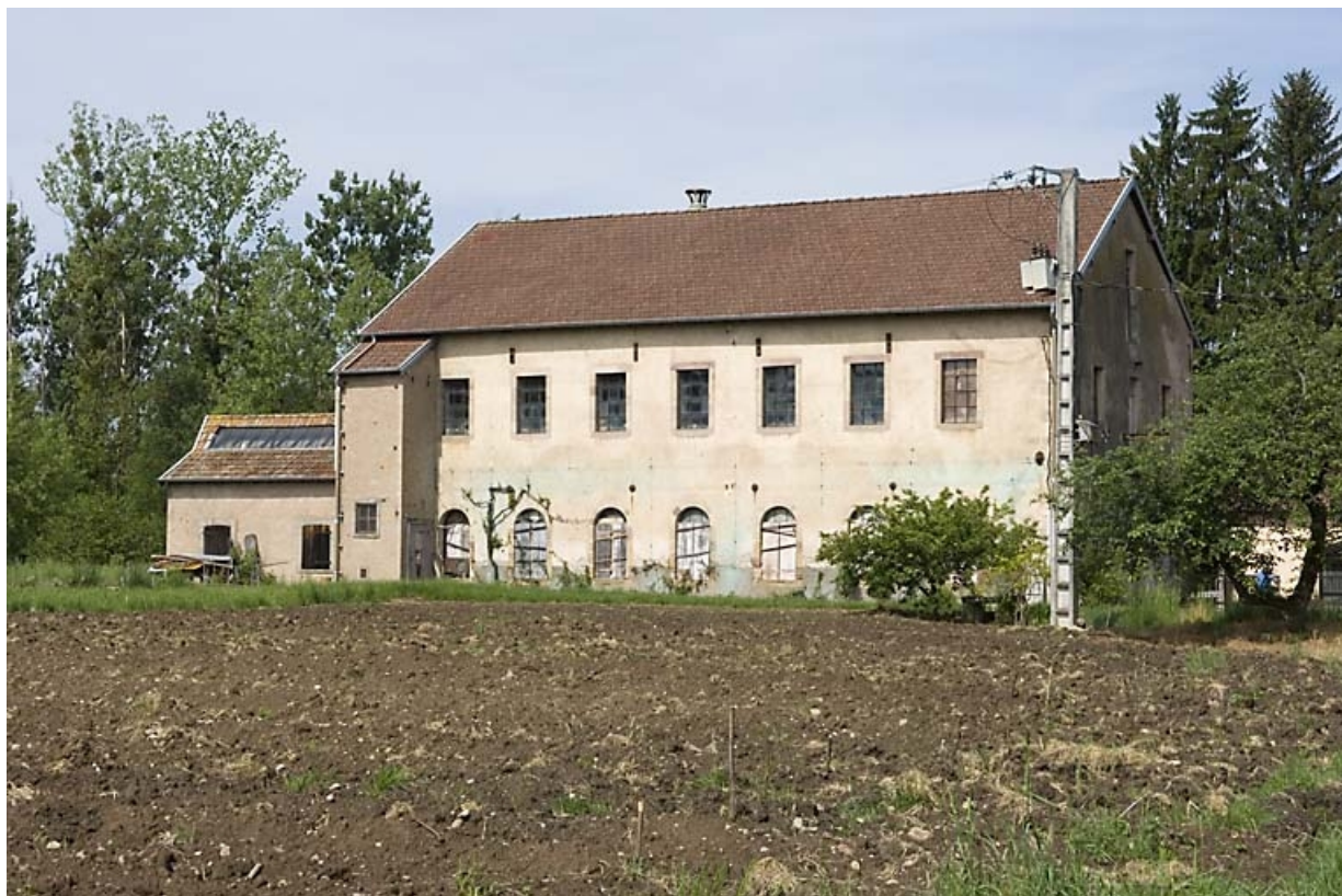
Façade orientale de l'atelier de filature.

70, Citers rue de la Hache, lieudit : la Hache