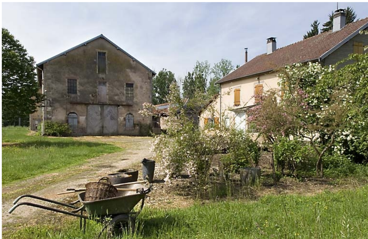
Atelier de filature et logement depuis l'est.

70, Citers rue de la Hache, lieudit : la Hache