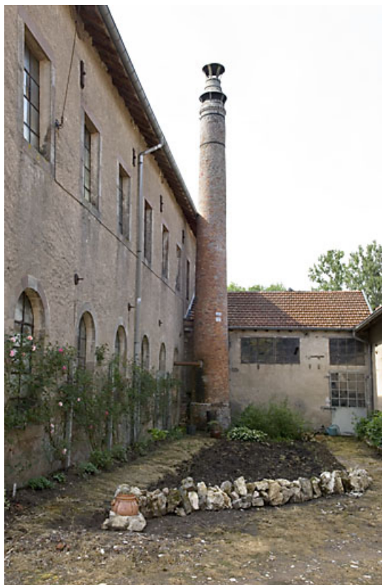
Façade occidentale de l'atelier de filature, cheminée et chaufferie.

70, Citers rue de la Hache, lieudit : la Hache