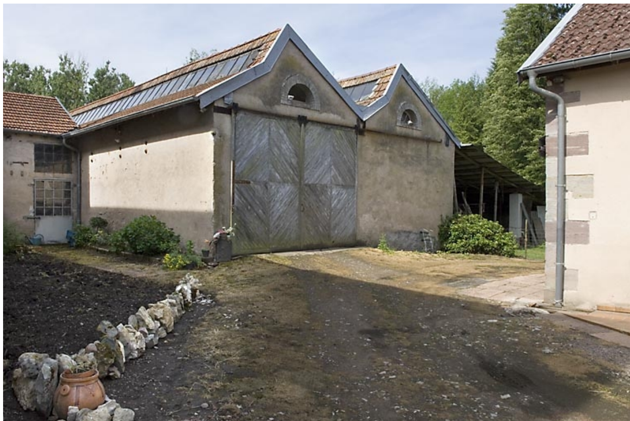
Extension ouest (atelier de fabrication ?). 70, Citers rue de la Hache, lieudit : la Hache