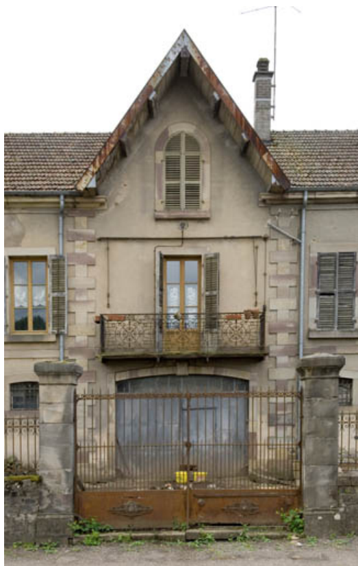
Façade antérieure. Pignon central.