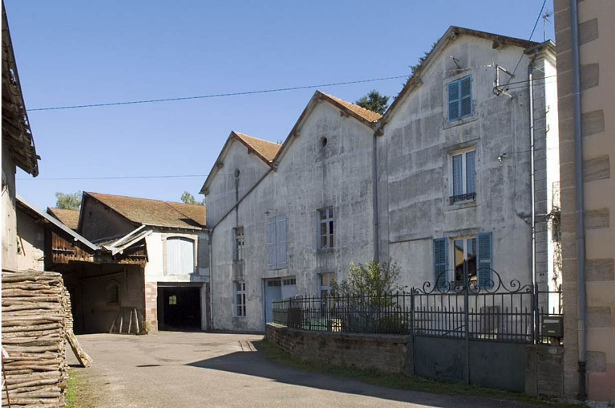
Atelier de fabrication et logement.