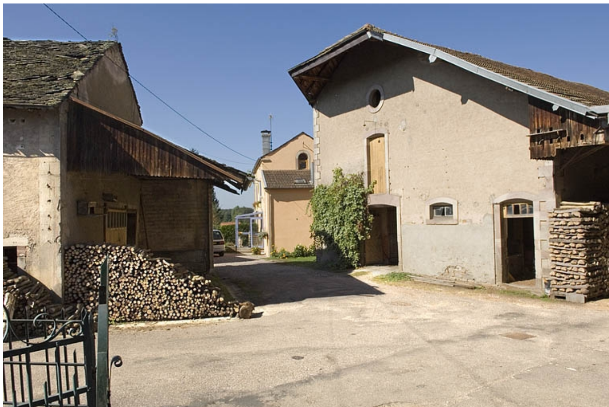
Bâtiments industriels. Vue depuis le logement patronal.