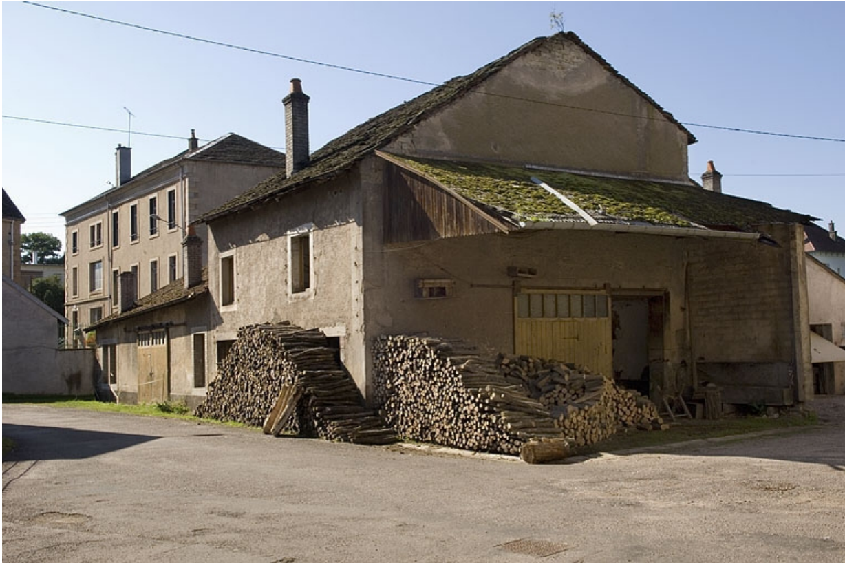
Atelier de fabrication sud.