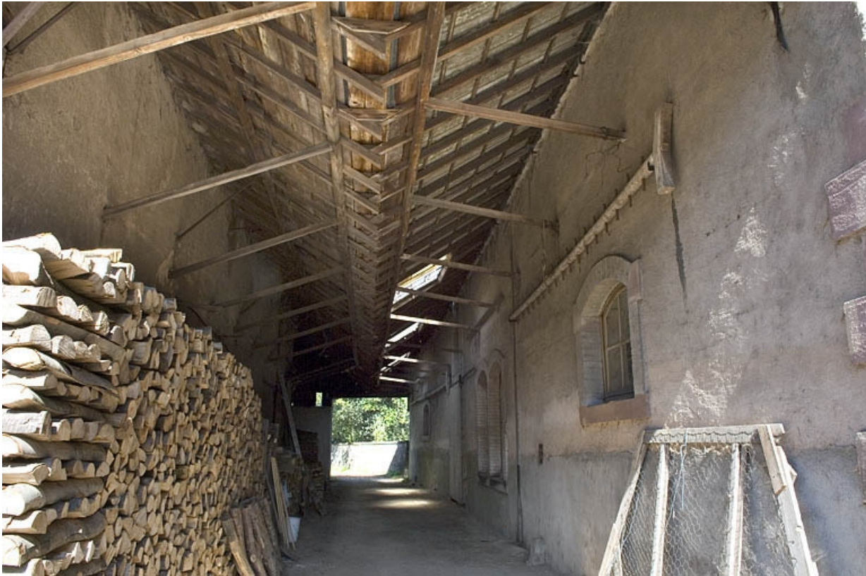
Passage couvert entre les ateliers de fabrication nord. 70, Fougerolles rue des Canes