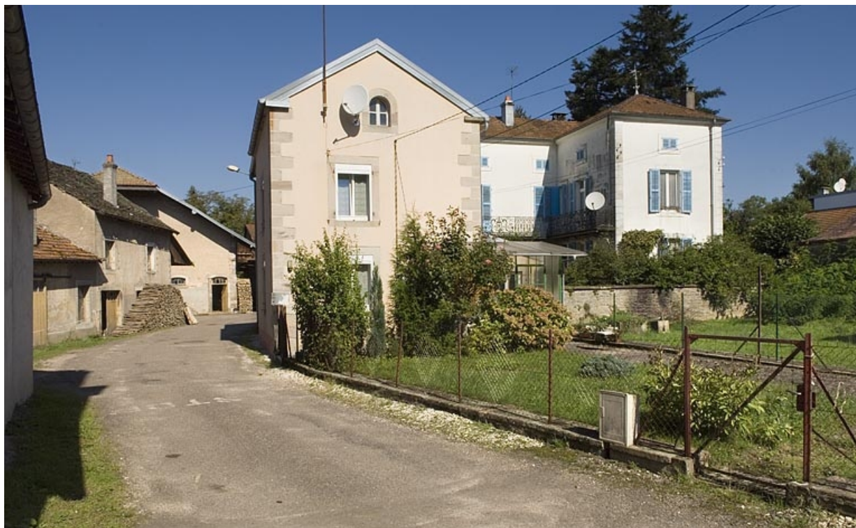
Vue d'ensemble depuis le sud. 70, Fougerolles rue des Canes