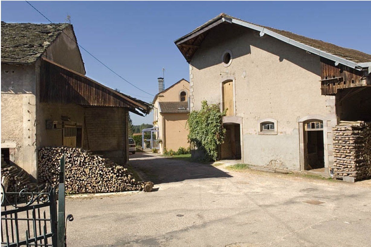
Bâtiments industriels. Vue depuis le logement patronal.