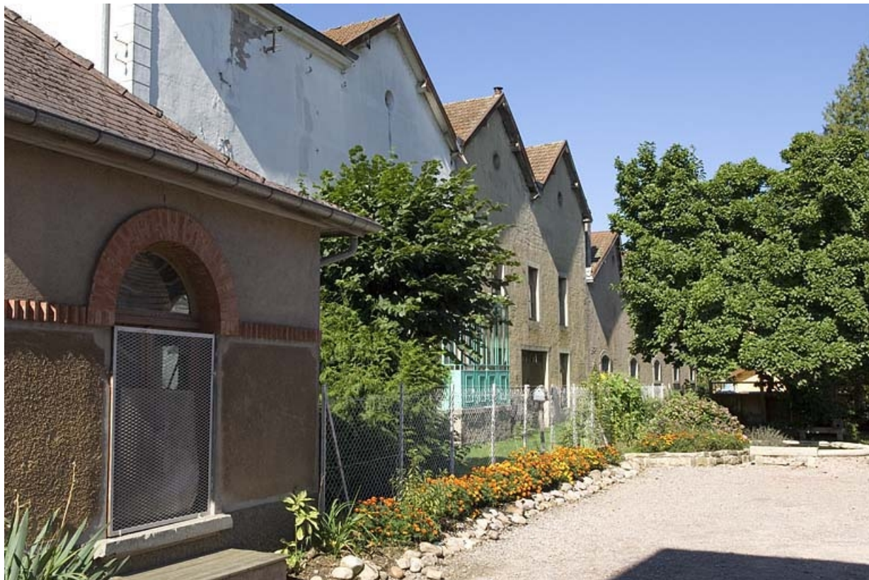
Façade postérieure de l'atelier de fabrication nord. 70, Fougerolles rue des Canes