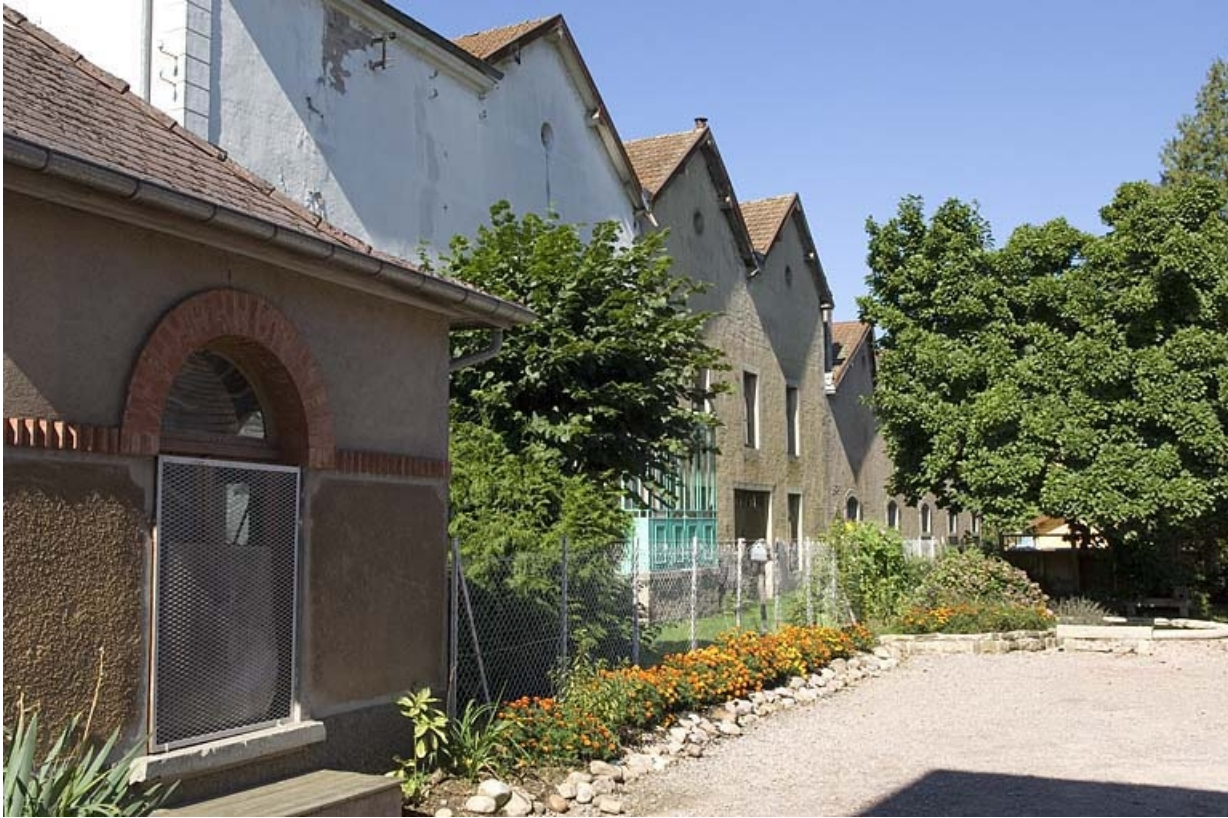
Façade postérieure de l'atelier de fabrication nord. 70, Fougerolles rue des Canes