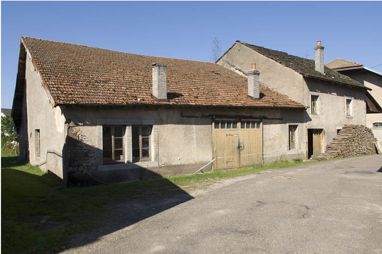
Atelier de fabrication sud. Vue depuis l'entrée. 70, Fougerolles rue des Canes