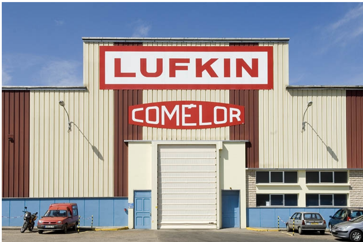
Détail de la façade antérieure.