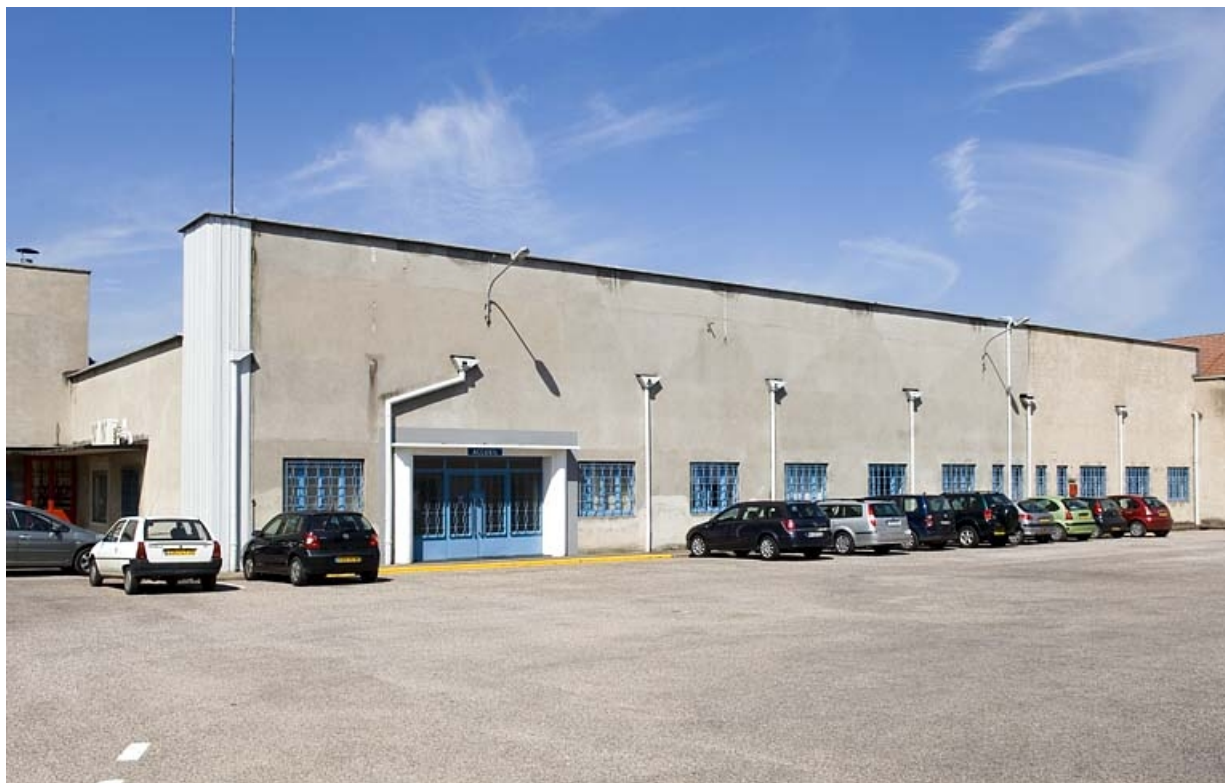
Façade des bureaux.