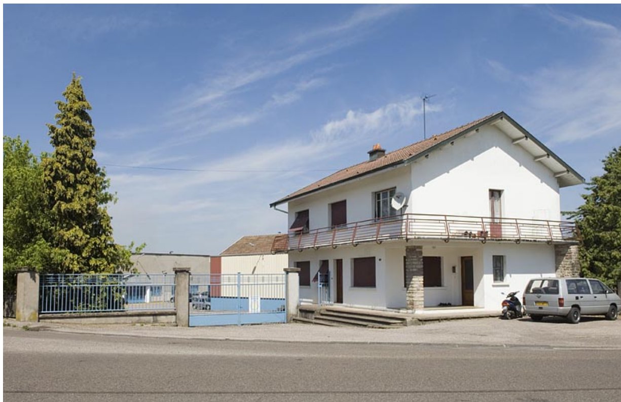
Ancien accès de l'usine et conciergerie.