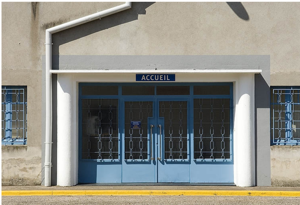
Façade des bureaux. Détail de l'entrée.