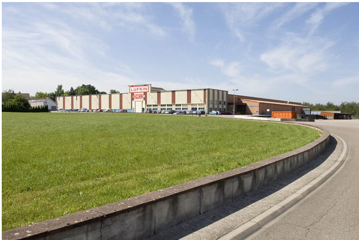
Vue d'ensemble depuis le nord-est.