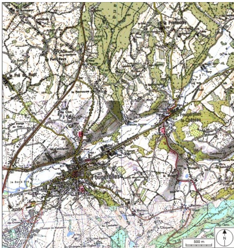
Carte de localisation. Carte topographique au 1:25000, I.G.N., Remiremont, 3519 O. SCAN 25 © IGN - 2008, Licence n°2008CISE29-68.