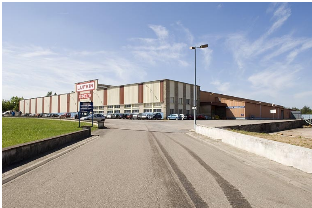
Vue rapprochée depuis le nord-est.