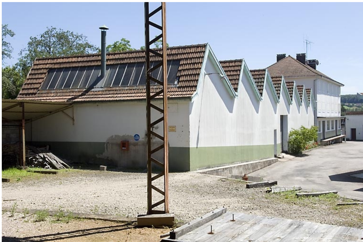
Extension nord de l'usine. Magasin industriel et menuiserie.