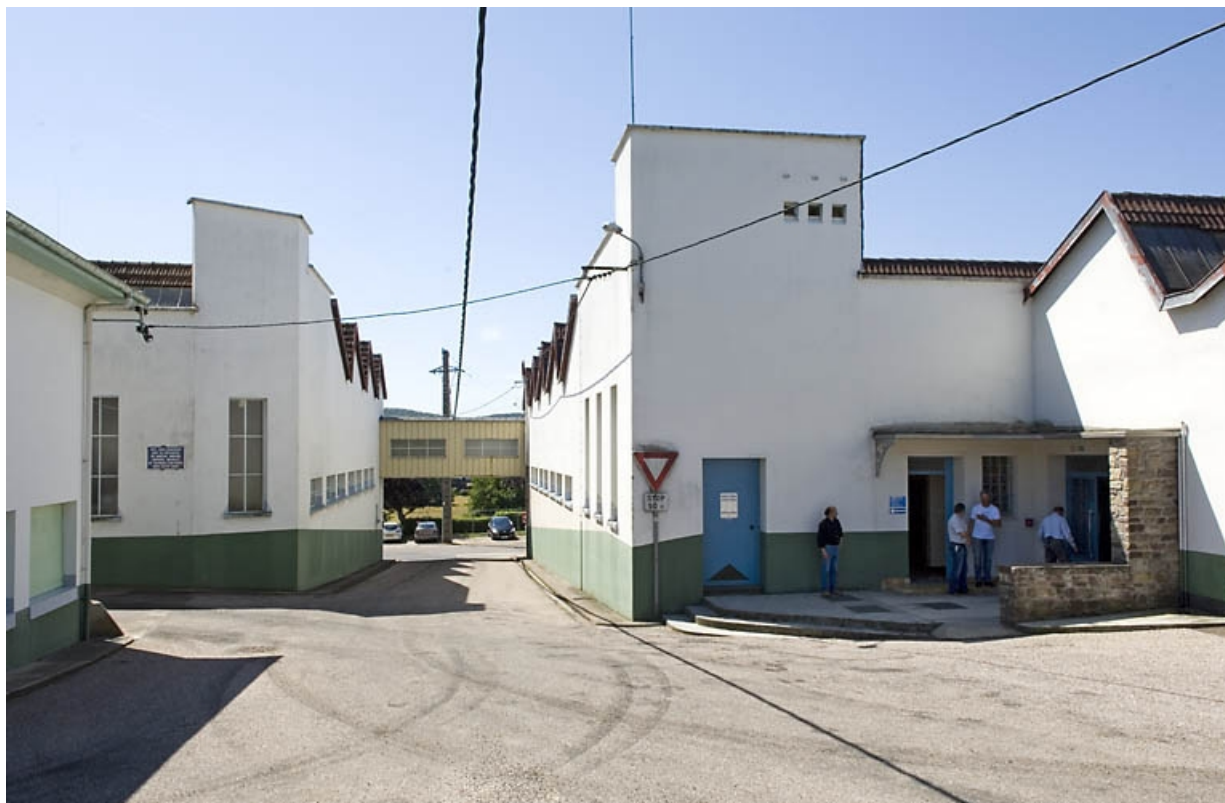
La rue des Calouettes, entre les ateliers est et ouest.