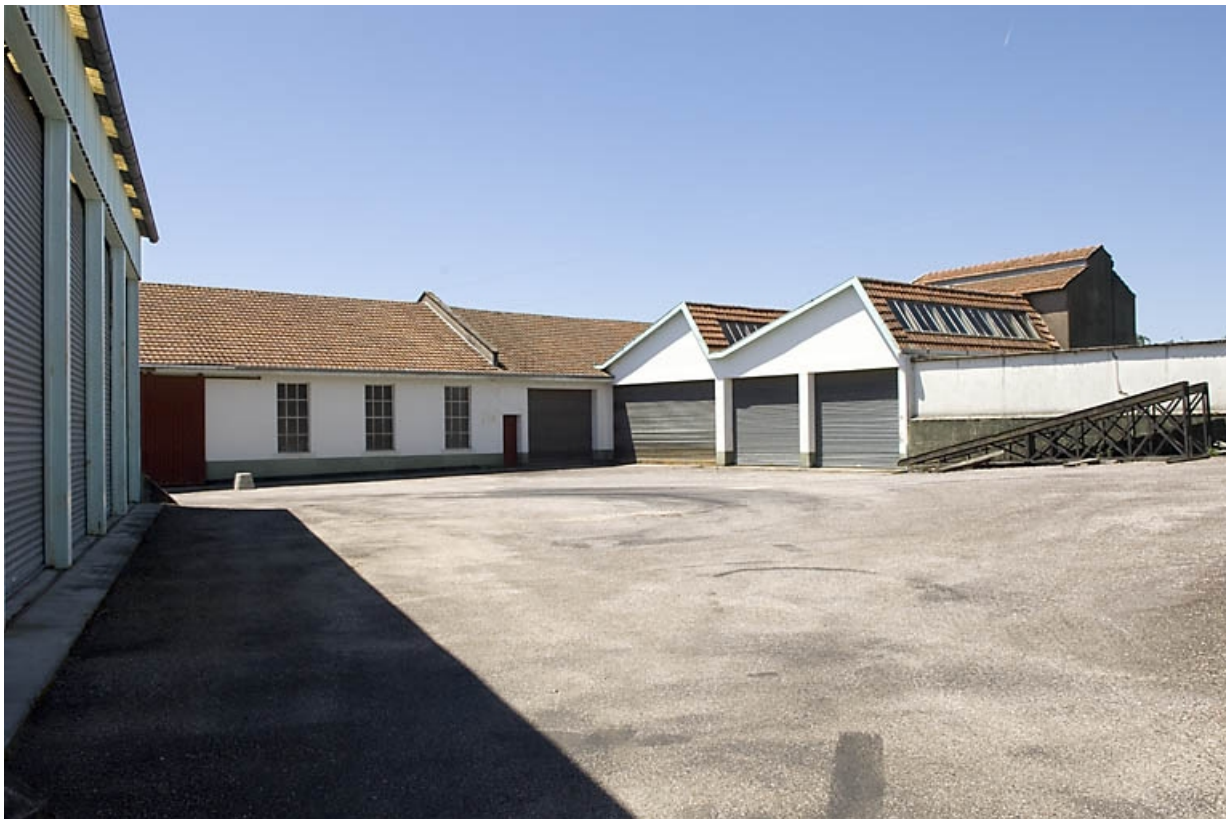
Extension nord de l'usine. Garages. 70, Fougerolles, 2 rue des Calouettes