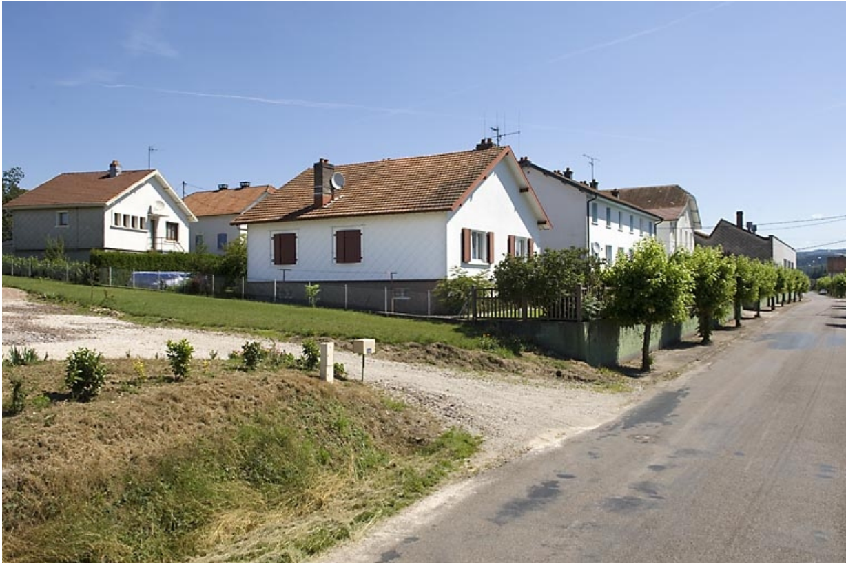
Logements. Vue d'ensemble depuis l'ouest.