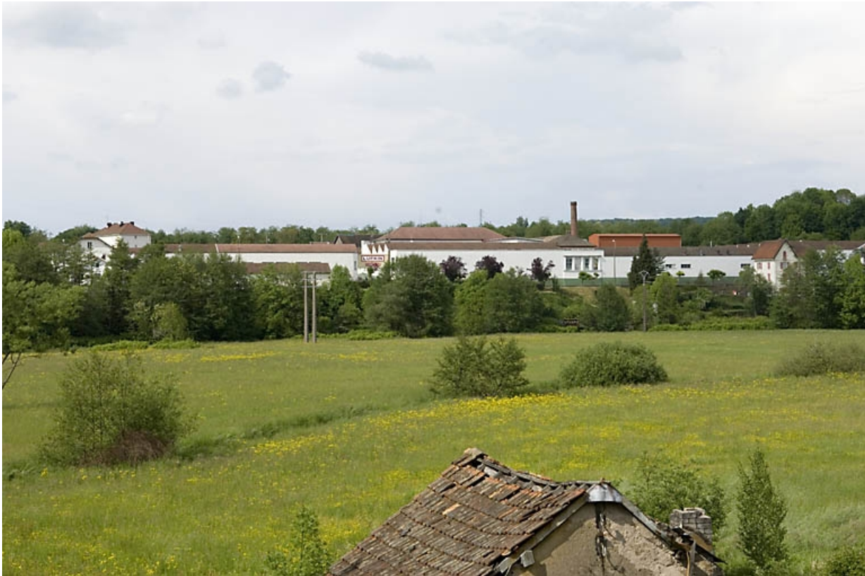
Vue d'ensemble depuis le sud.