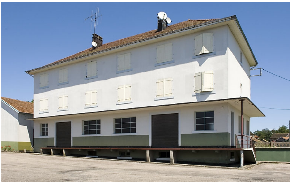
Extension nord de l'usine. Réception des matériaux et logements.