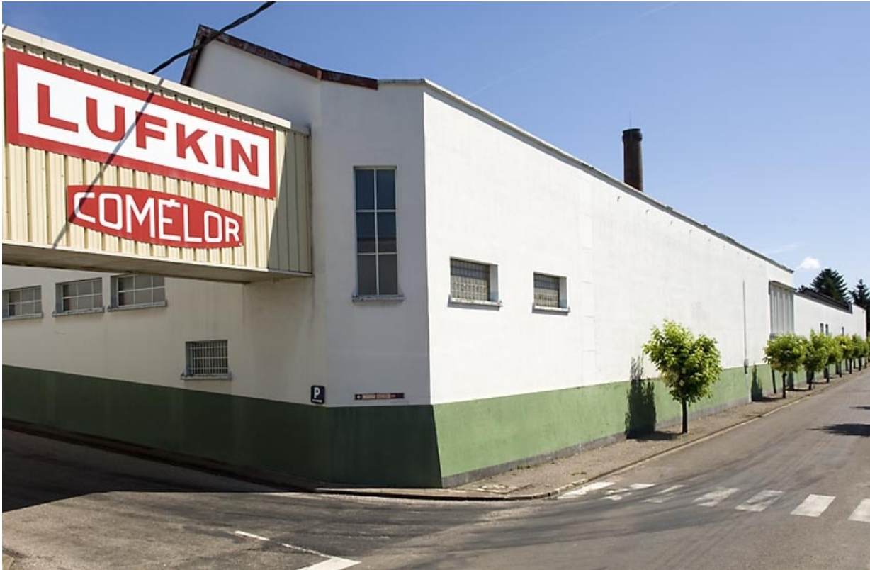
Façade sur rue des ateliers est.