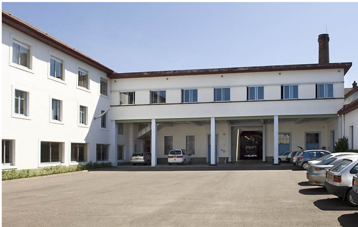
Cour de l'usine. Vue depuis l'ouest.