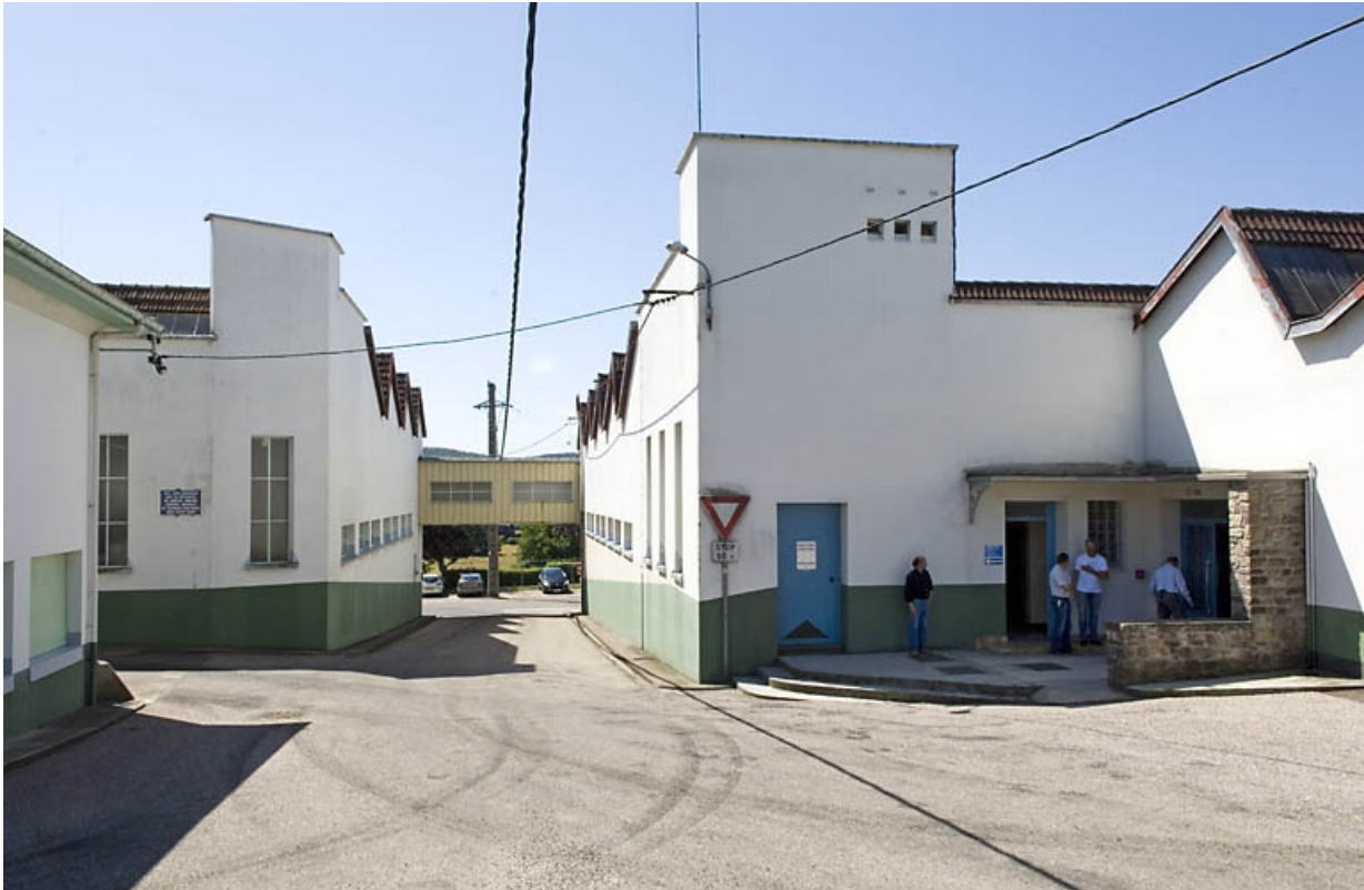
La rue des Calouettes, entre les ateliers est et ouest.