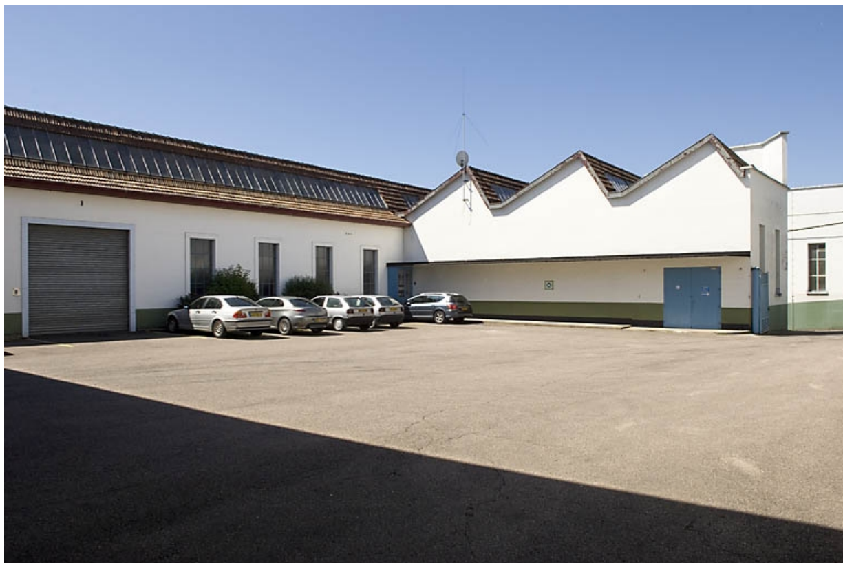
Cour de l'usine. Vue depuis le nord-est. 70, Fougerolles, 2 rue des Calouettes