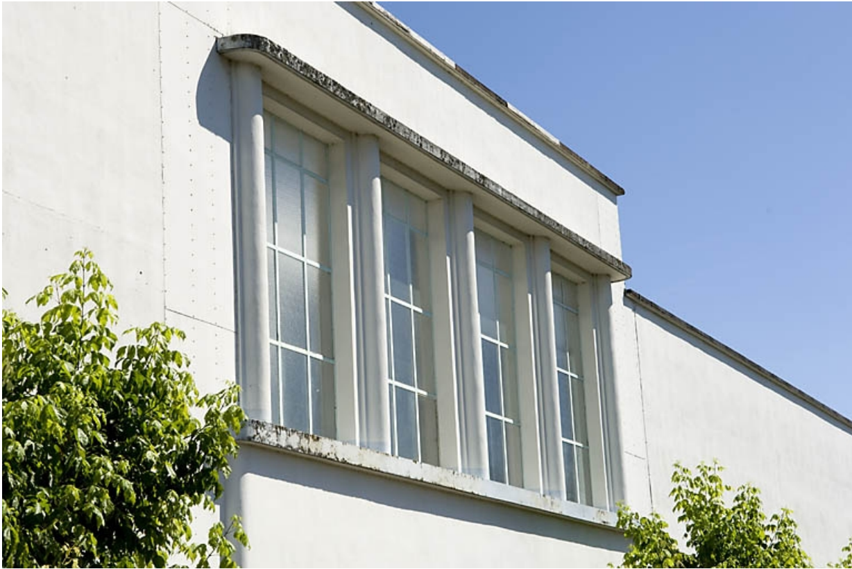
Façade sur rue des ateliers est. Détail d'une baie.