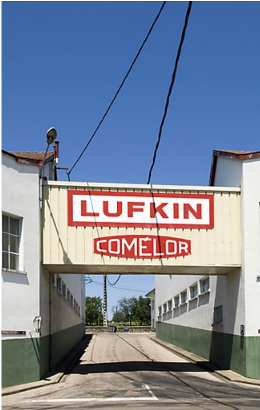
Passerelle de communication entre les ateliers ouest et est.