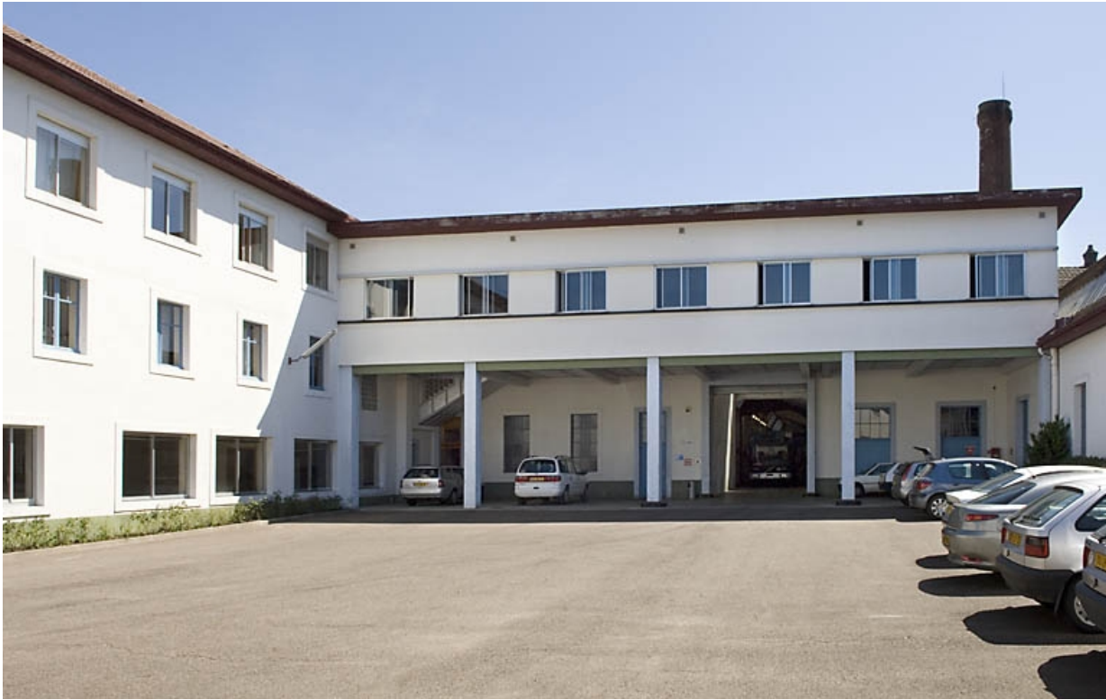
Cour de l'usine. Vue depuis l'ouest.