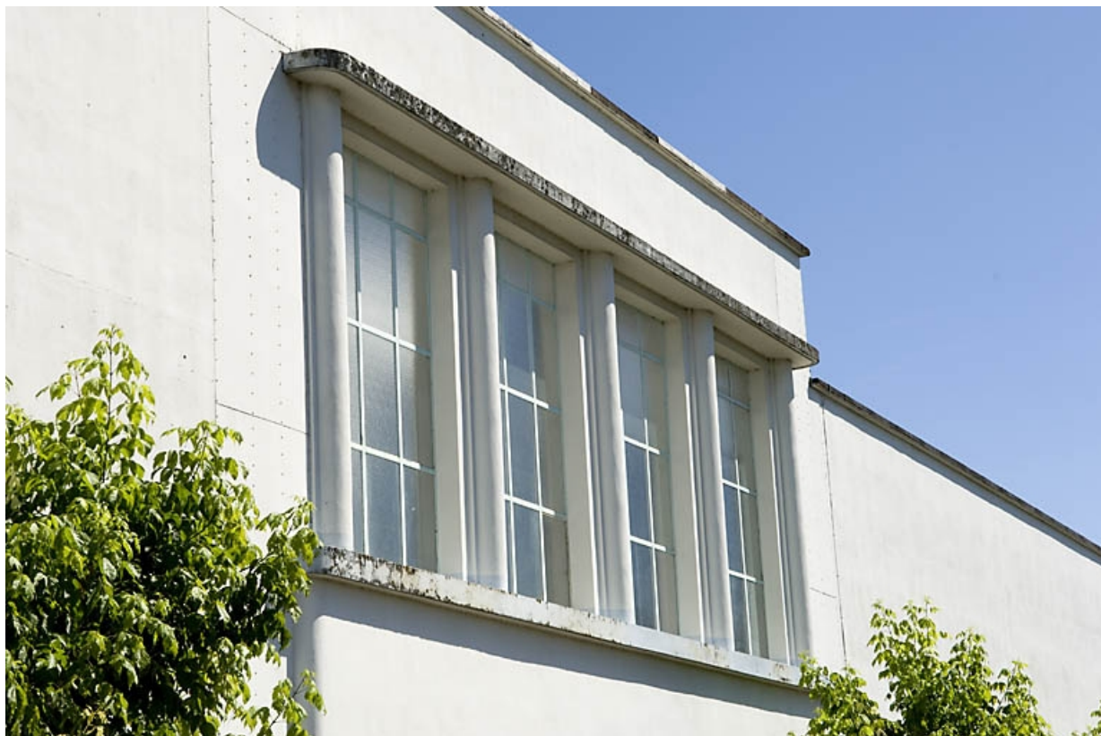
Façade sur rue des ateliers est. Détail d'une baie.