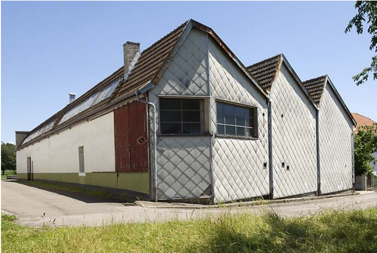
Bâtiments industriels. Vue depuis l'ouest.