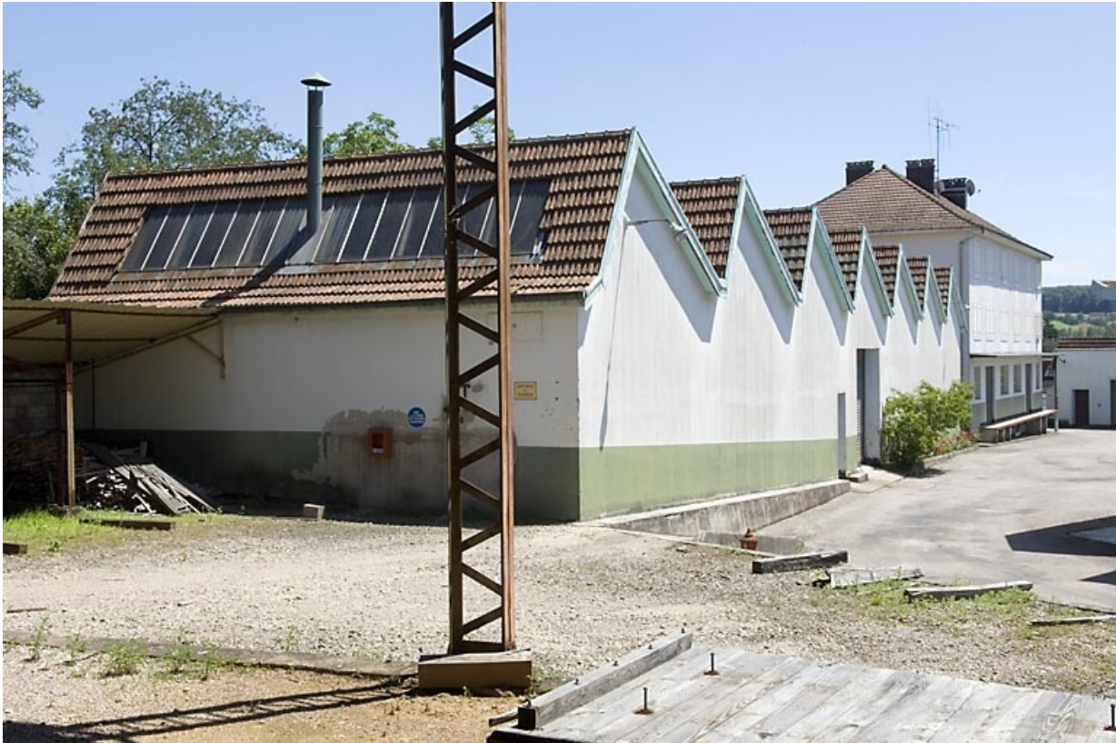
Extension nord de l'usine. Magasin industriel et menuiserie.