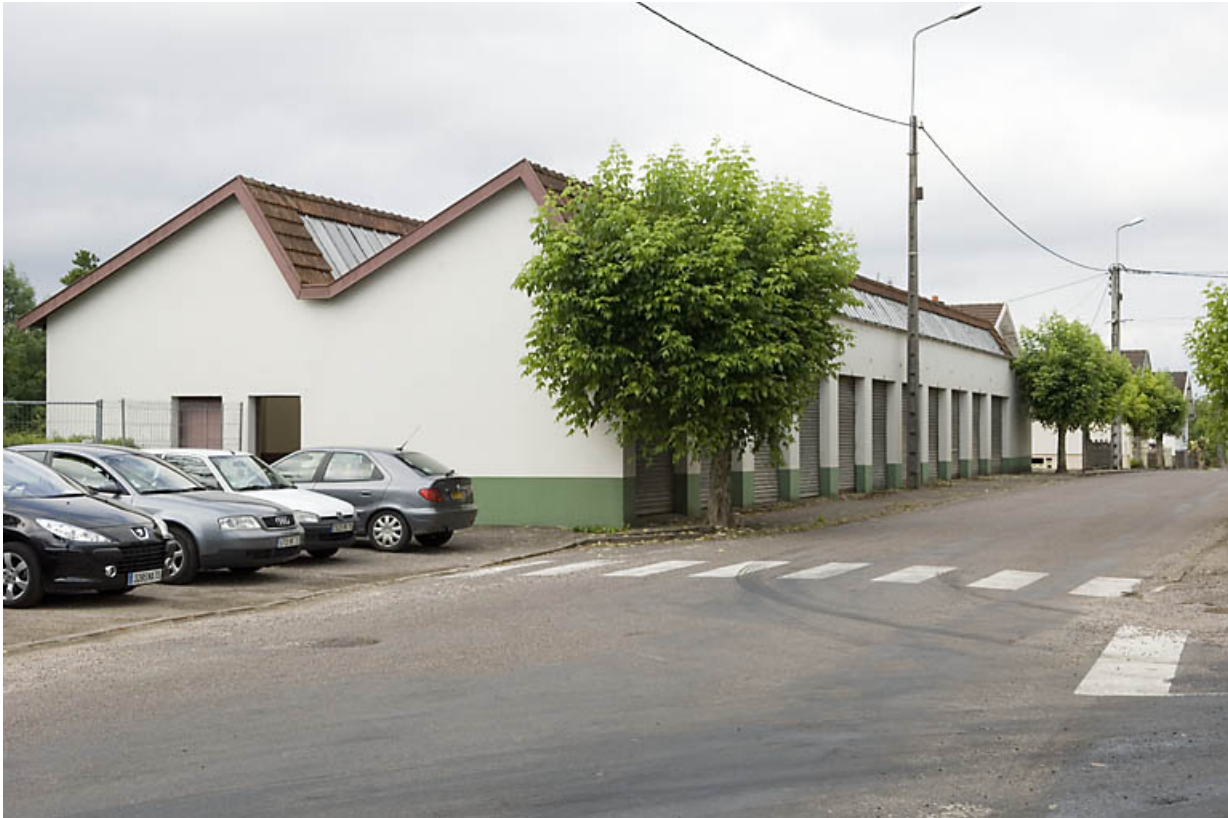
Garages le long de la rue des Chavannes.