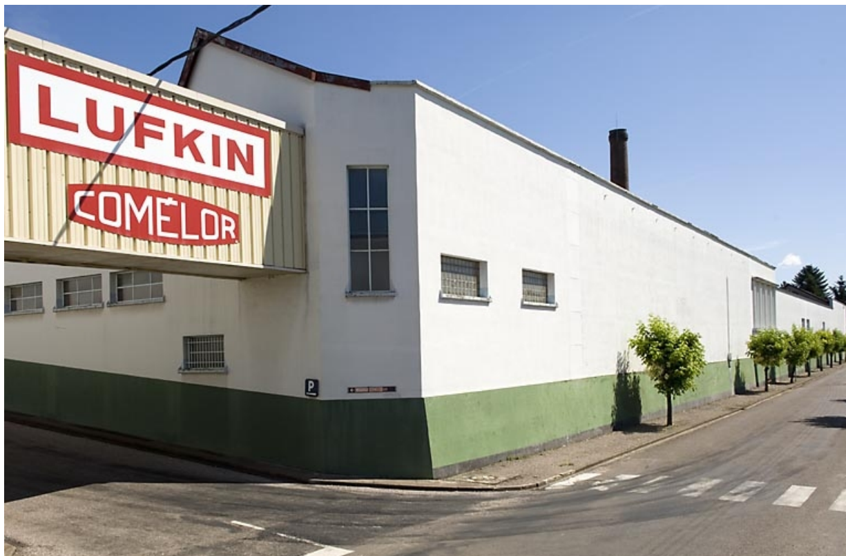
Façade sur rue des ateliers est.