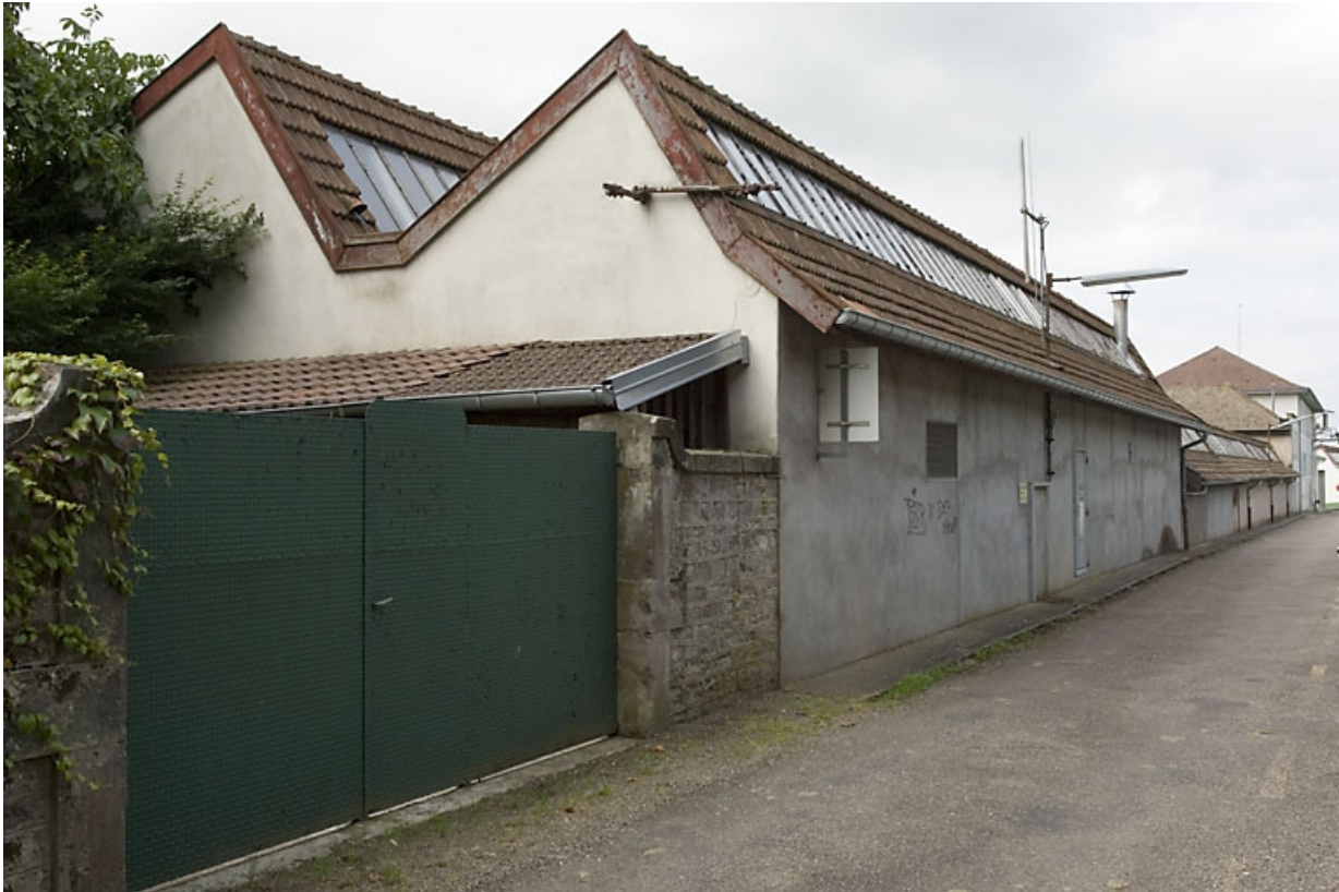
Façade nord de l'atelier de fabrication.