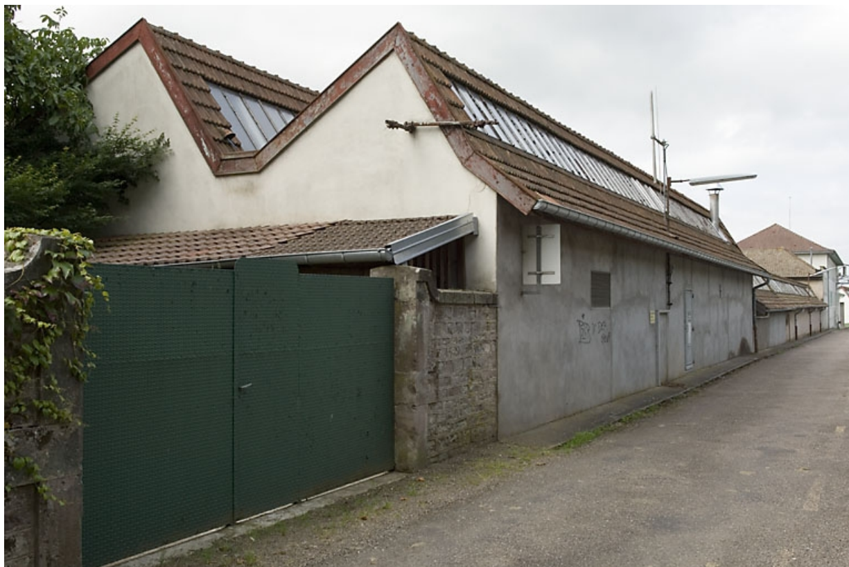
Façade nord de l'atelier de fabrication.