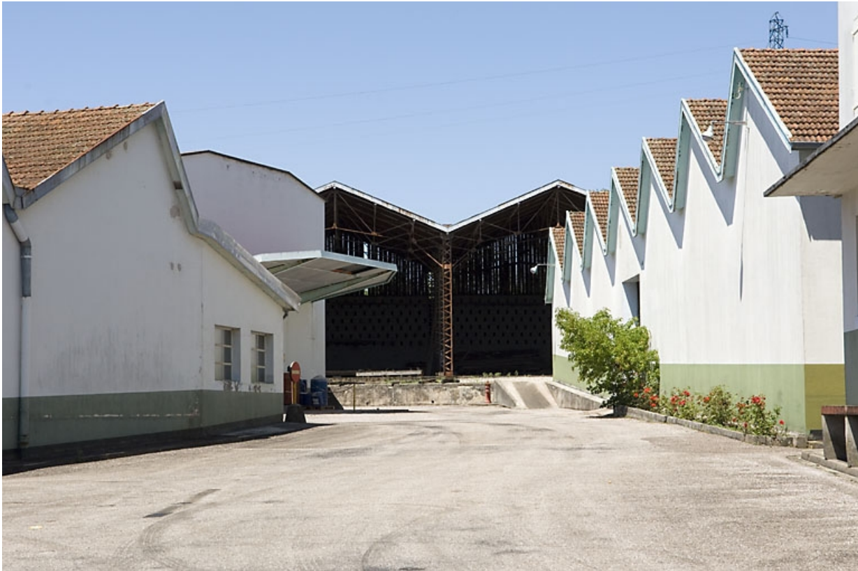
Extension nord de l'usine. Garages, entrepôt industriel (au fond) et magasin et menuiserie (à droite). 70, Fougerolles, 2 rue des Calouettes