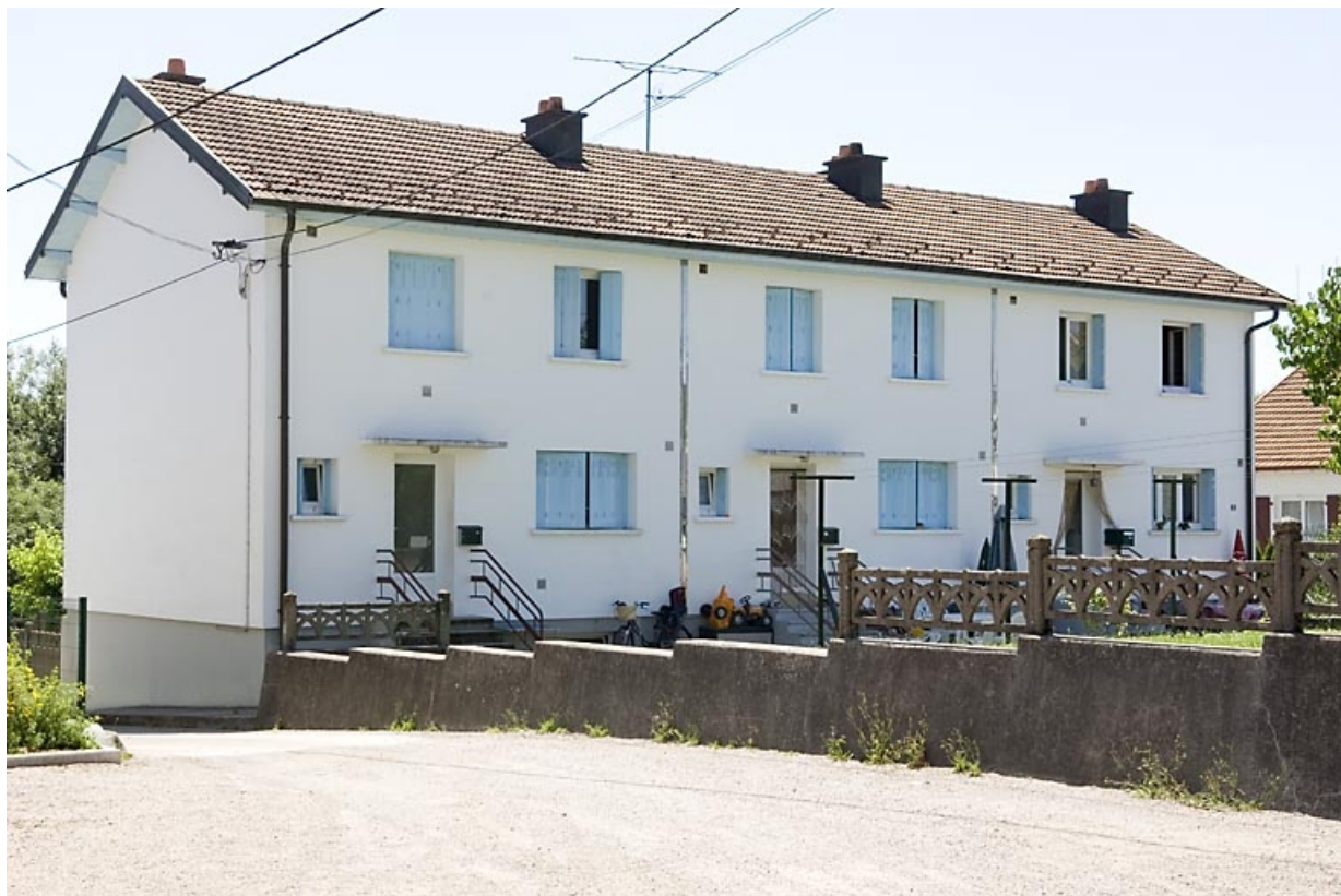
Logement ouvrier collectif (n° 36-38). Vue de trois quarts arrière.