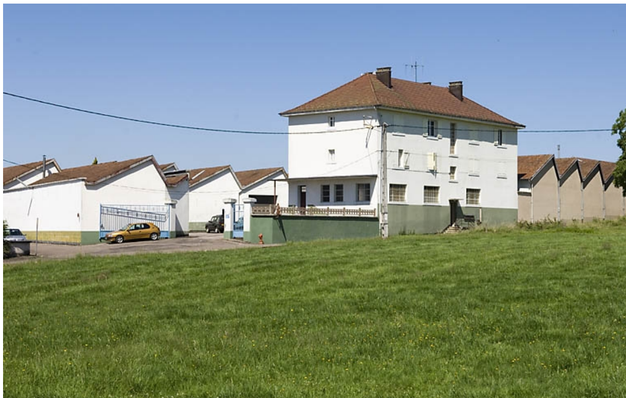
Extension nord de l'usine (réception et stockage des matières premières). 70, Fougerolles, 2 rue des Calouettes