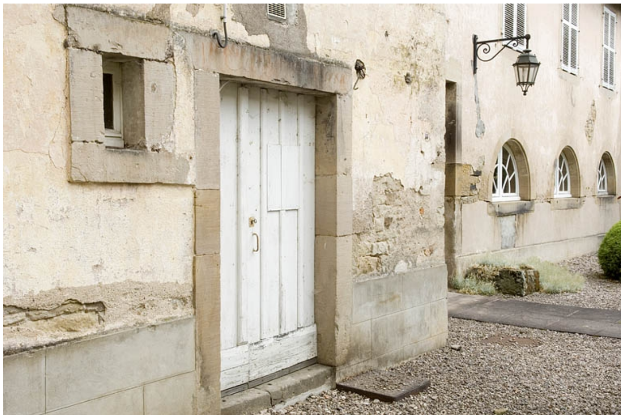
Détail de la façade de l'aile nord.