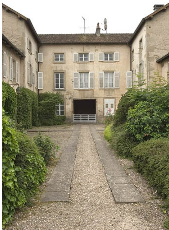
Façade antérieure du relais de poste.