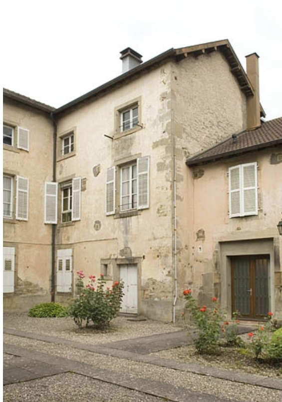
Aile en retour du relais de poste.