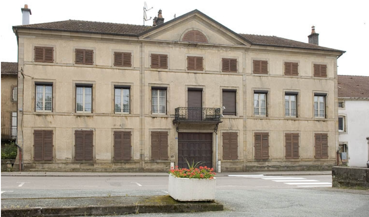
Vue de face du relais de poste.