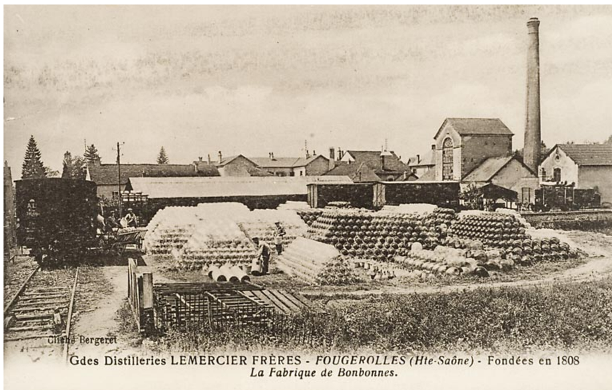
Grandes distilleries Lemerrier Frères. Fougerolles [...]. La fabrique de bonbonnes.