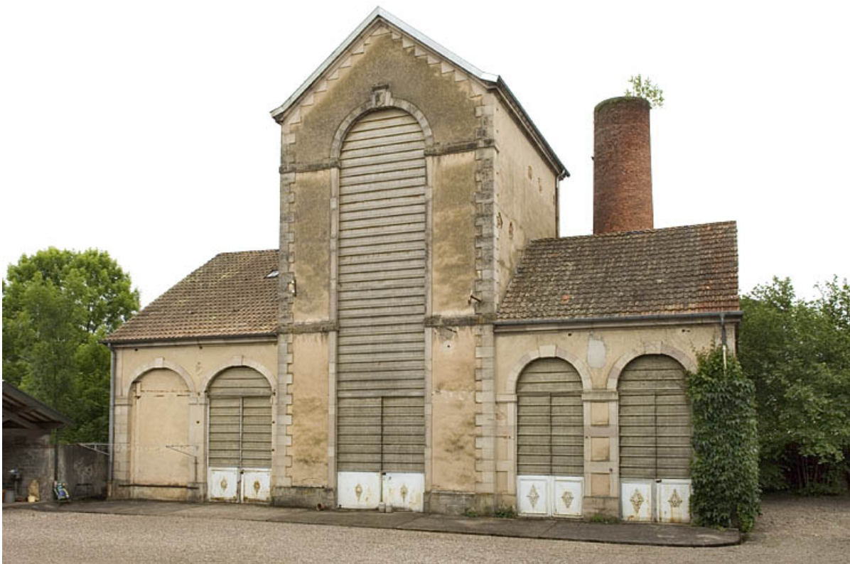
Bâtiment de rectification vu de face.