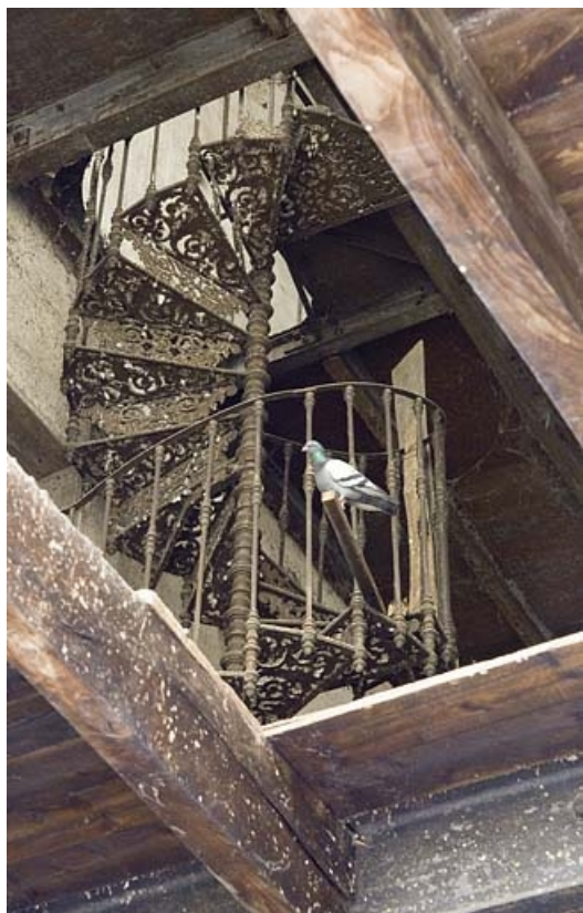
Bâtiment de rectification. Escalier intérieur en fonte.