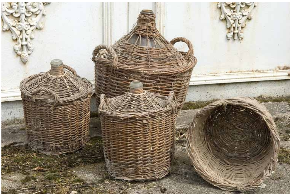
Bonbonnes et panier.