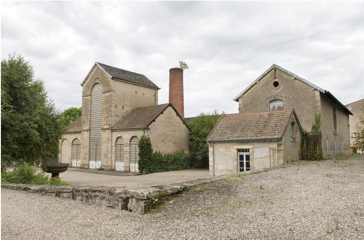
Bâtiment de rectification, bureau et entrepôt industriel.