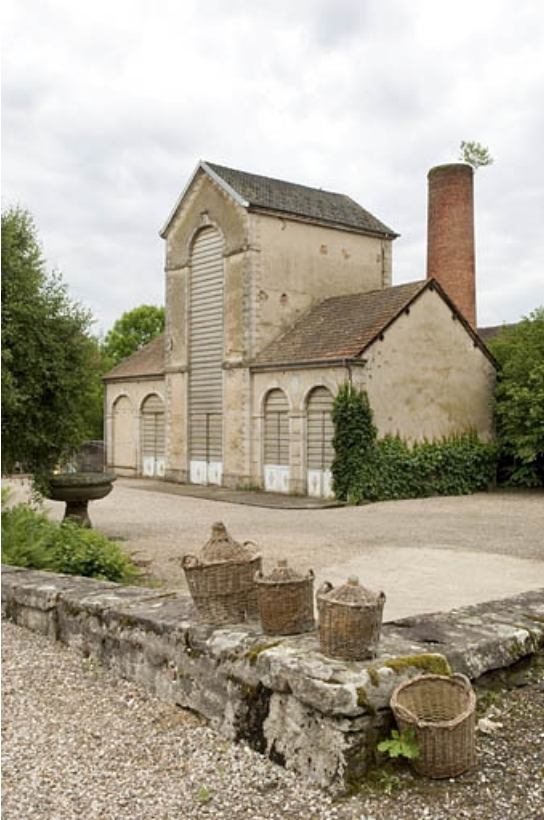
Bâtiment de rectification et sa cheminée vus de trois quarts.