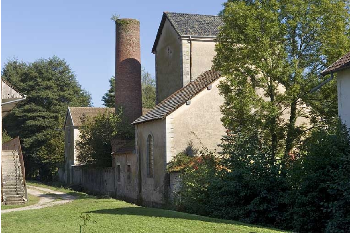
Vue de trois quarts arrière.