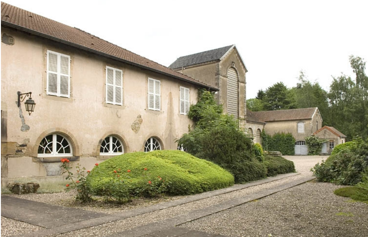
Aile nord (anciennes écuries).