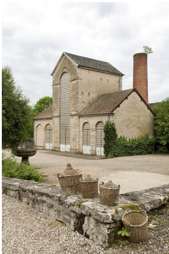
Bâtiment de rectification et sa cheminée vus de trois quarts.