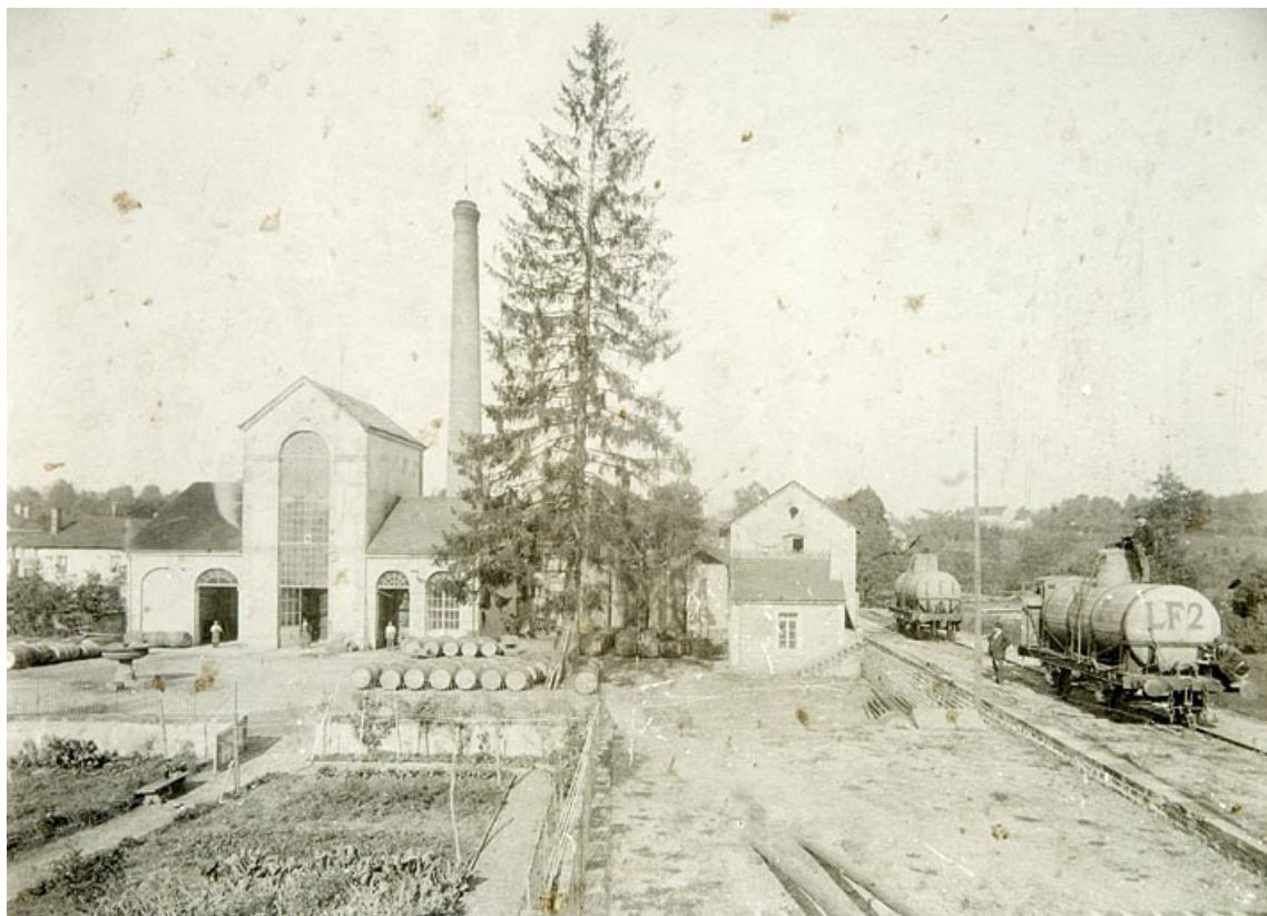
Vue d'ensemble depuis le sud 70, Fougerolles, 20 Grande-Rue

Photographie, Besançon, s.d. [vers 1900], par Le Blanc, A. (photographe). Lieu de conservation : Archives privées Lieu de conservation : Archives privées