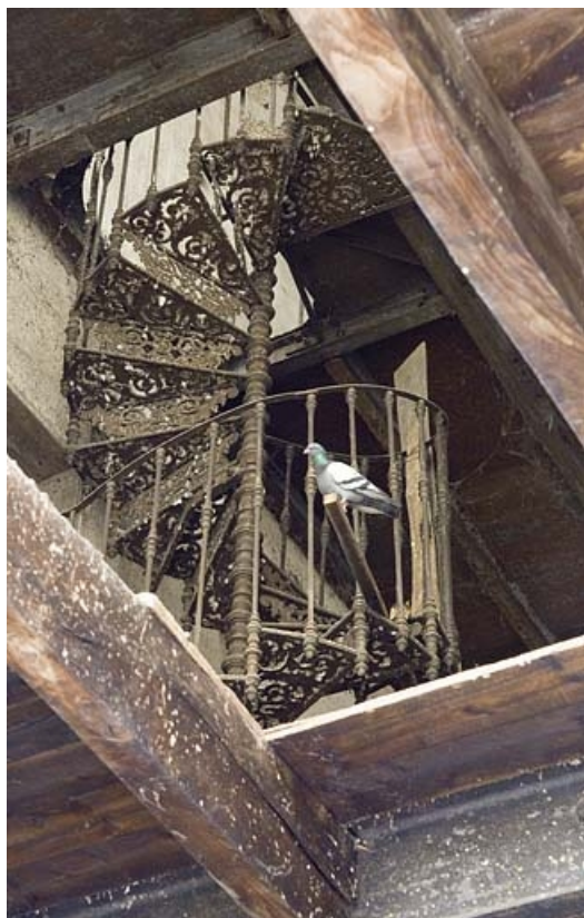
Bâtiment de rectification. Escalier intérieur en fonte.