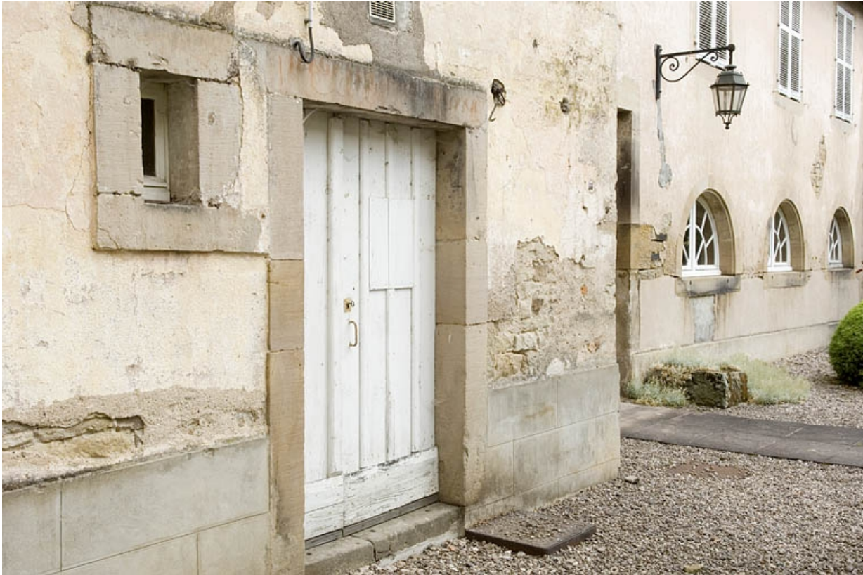
Détail de la façade de l'aile nord.