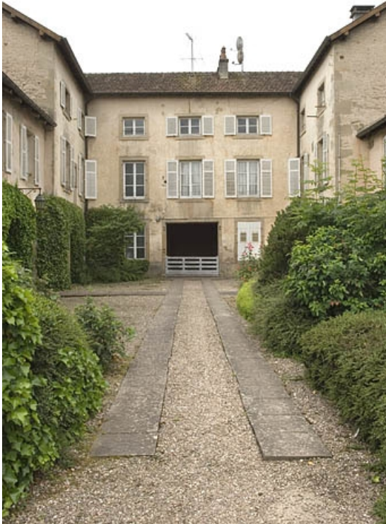
Façade antérieure du relais de poste.