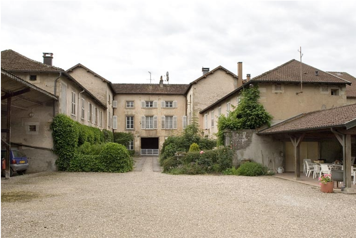
Le relais de poste vu depuis l'est.