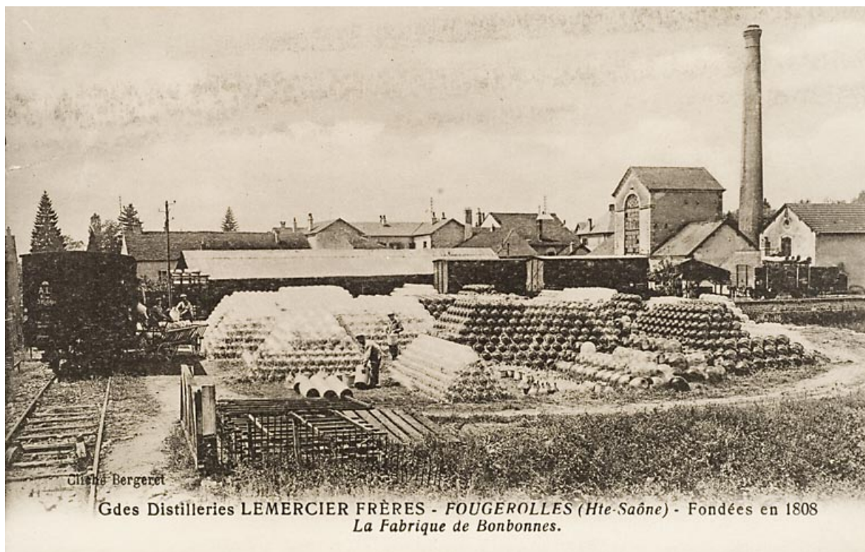
Grandes distilleries Lemercier Frères. Fougerolles [...]. La fabrique de bonbonnes.