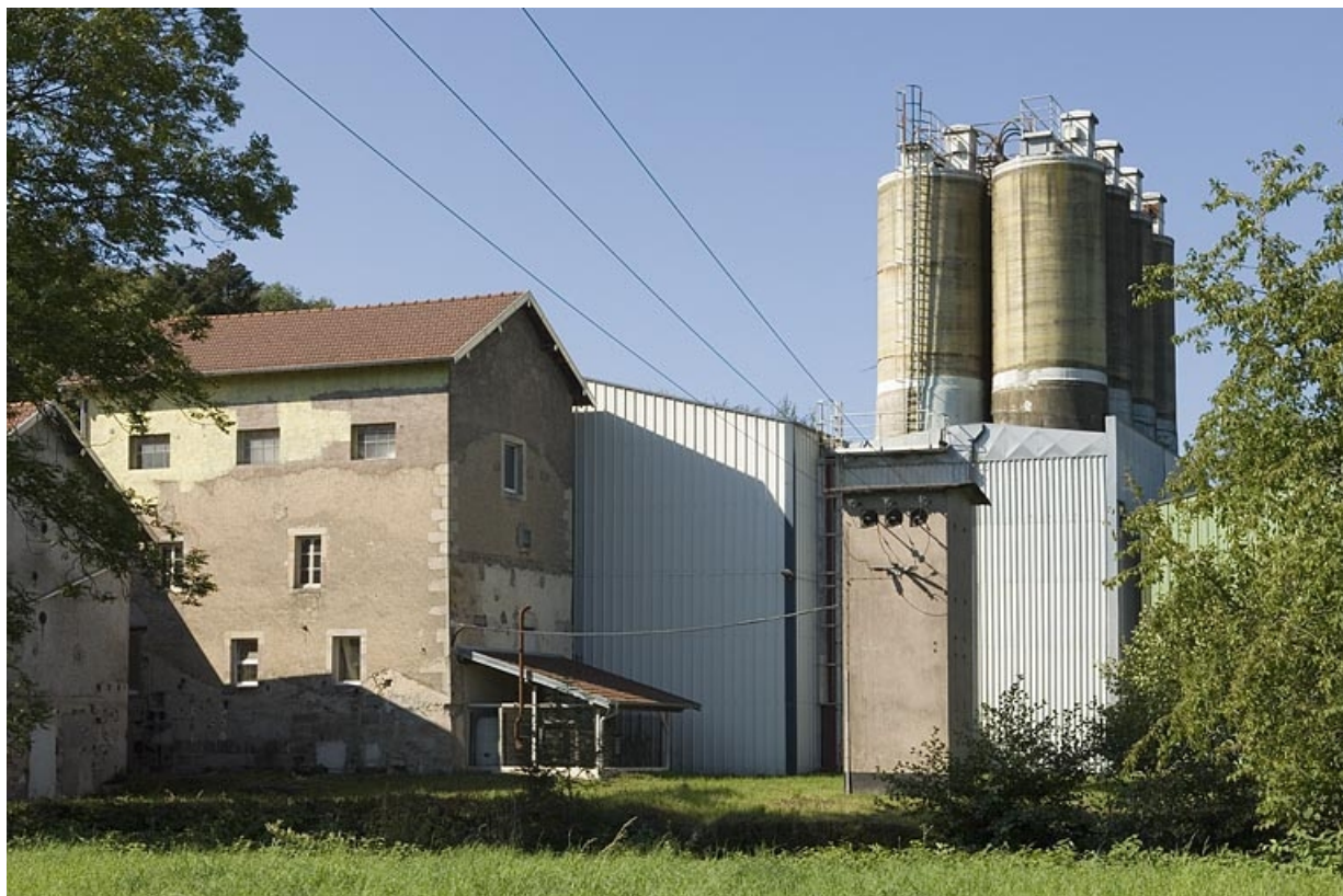
Le moulin et ses extensions. Vue de trois quarts arrière

70, Fougerolles, lieudit : Fougerolles-le-Château