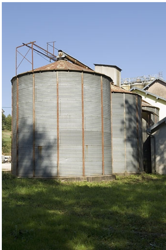
Silos métalliques. Vue depuis l'ouest.

70, Fougerolles, lieudit : Fougerolles-le-Château