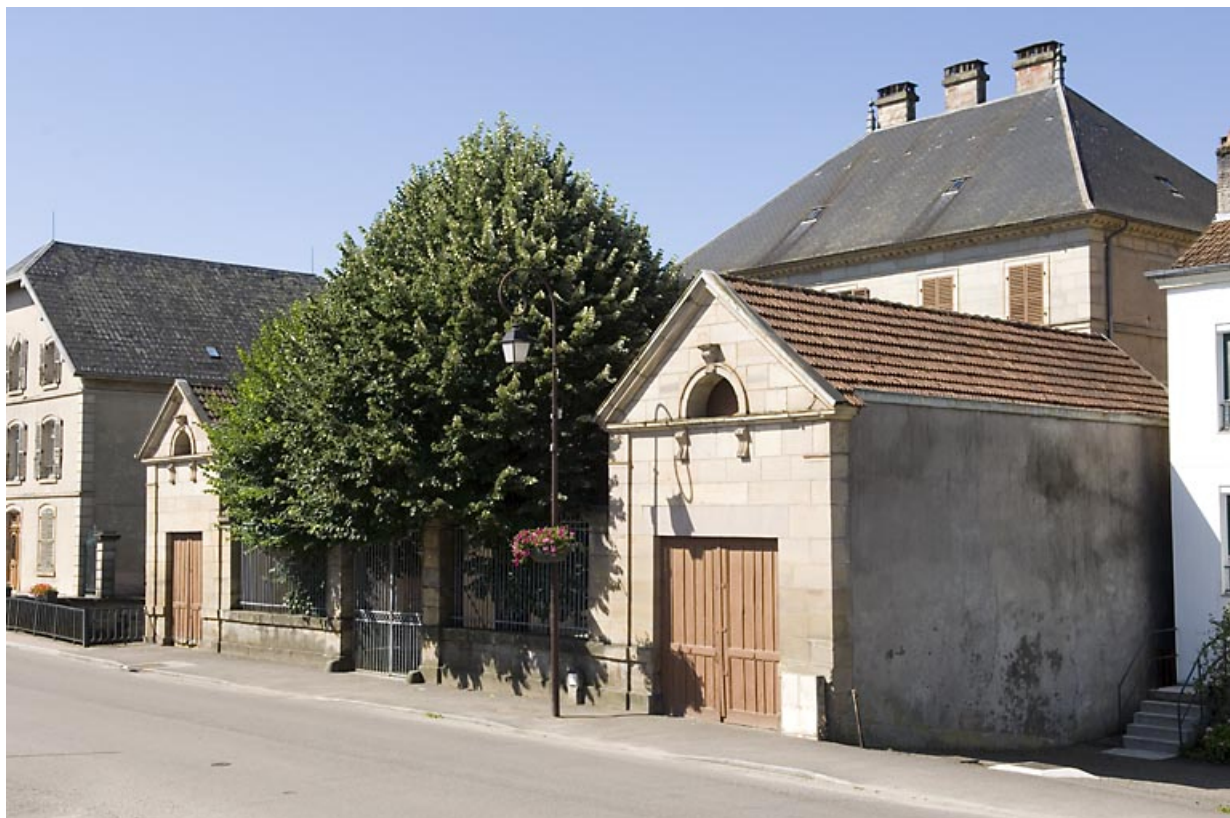
Vue d'ensemble depuis le nord-est. 70, Fougerolles Grande-Rue