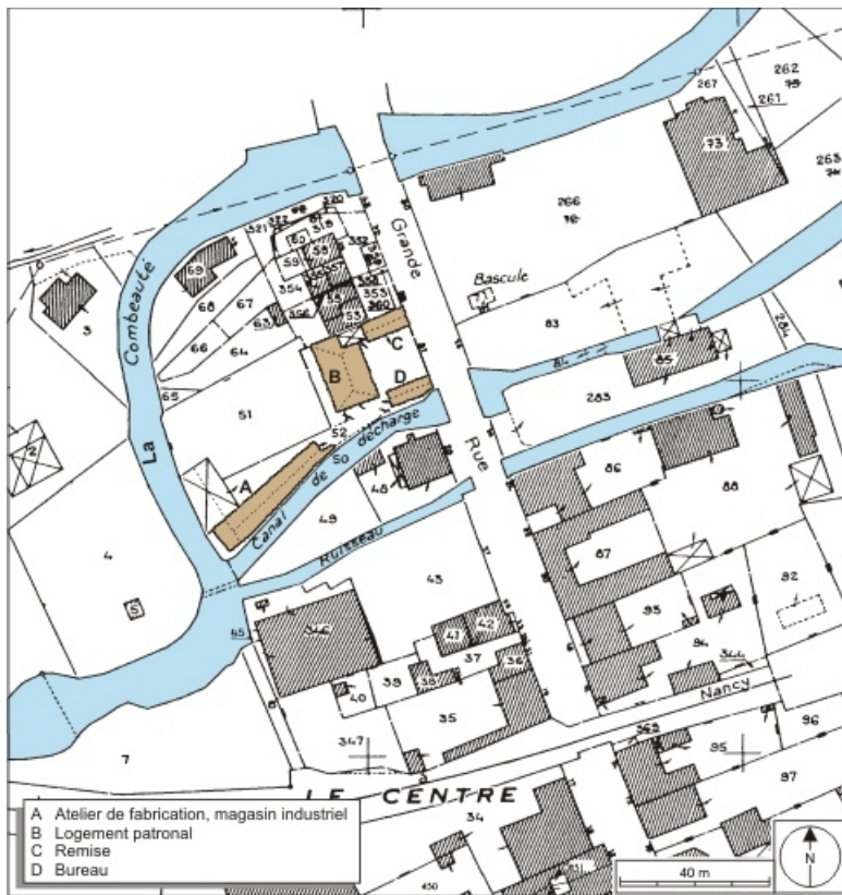
Plan-masse et de situation. Extrait du plan cadastral numérisé, 2008, section AE, 1:1000 réduit à 1:1250. Source : Direction générale des Finances Publiques - Cadastre ; mise à jour : 2008.