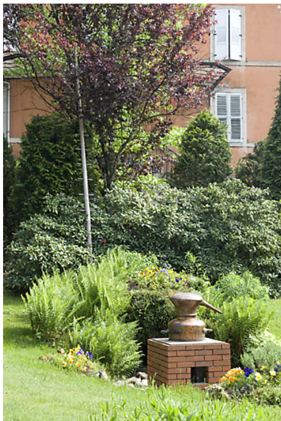
Cour de la distillerie. Pied de chèvre et alambic à feu nu.