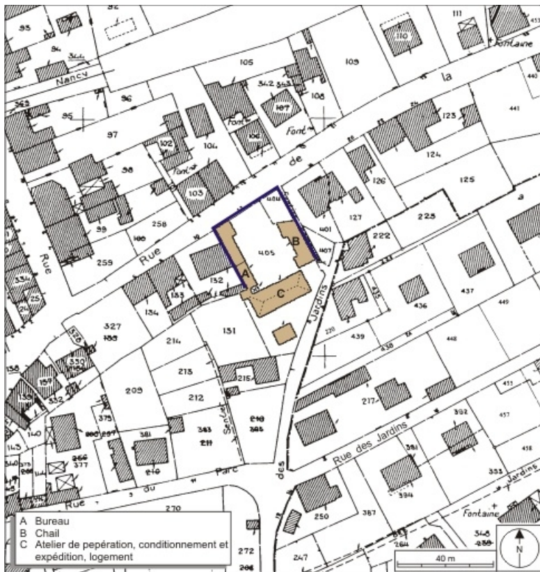
Plan-masse et de situation. Extrait du plan cadastral numérisé, 2008, section AE, 1:1000 réduit à 1:1250. Source : Direction générale des Finances Publiques - Cadastre ; mise à jour : 2008.