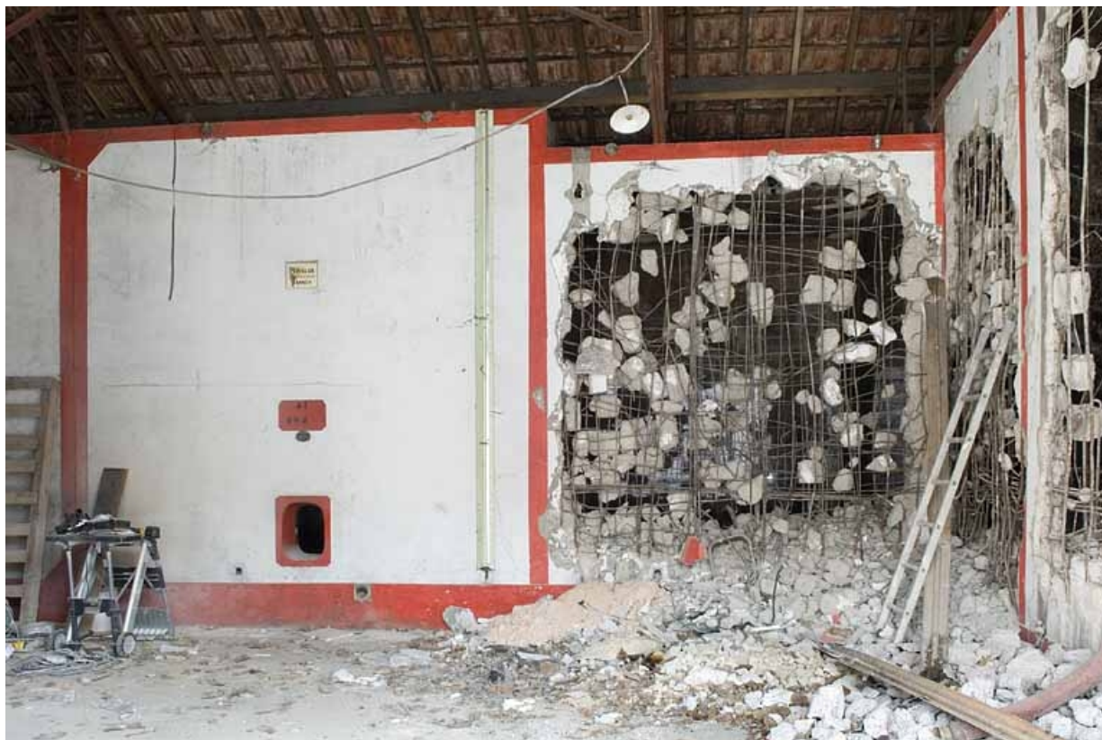
Cuverie. Cuves de fermentation en cours de démolition.

70, Fougerolles, 34, 36 rue du Champ Caillou