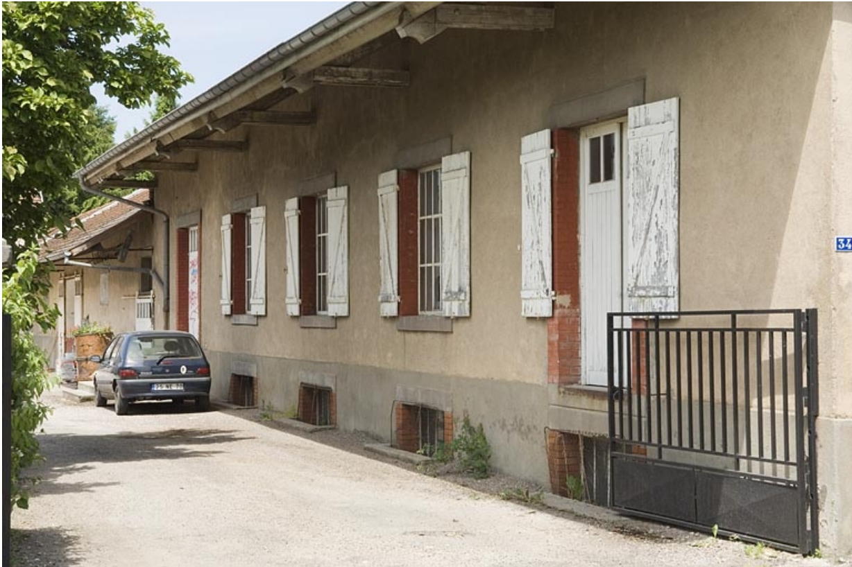
Façade du chai, à l'entrée.

70, Fougerolles, 34, 36 rue du Champ Caillou