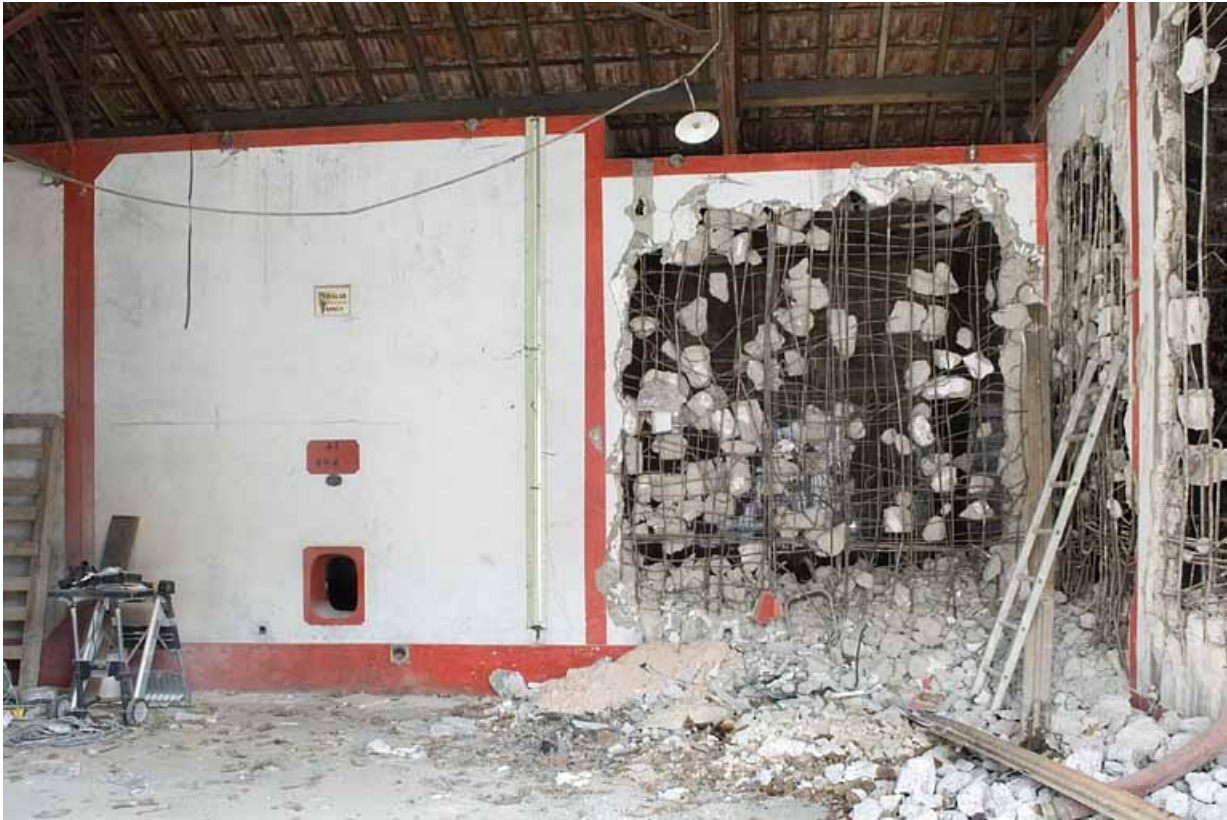
Cuverie. Cuves de fermentation en cours de démolition.

70, Fougerolles, 34, 36 rue du Champ Caillou