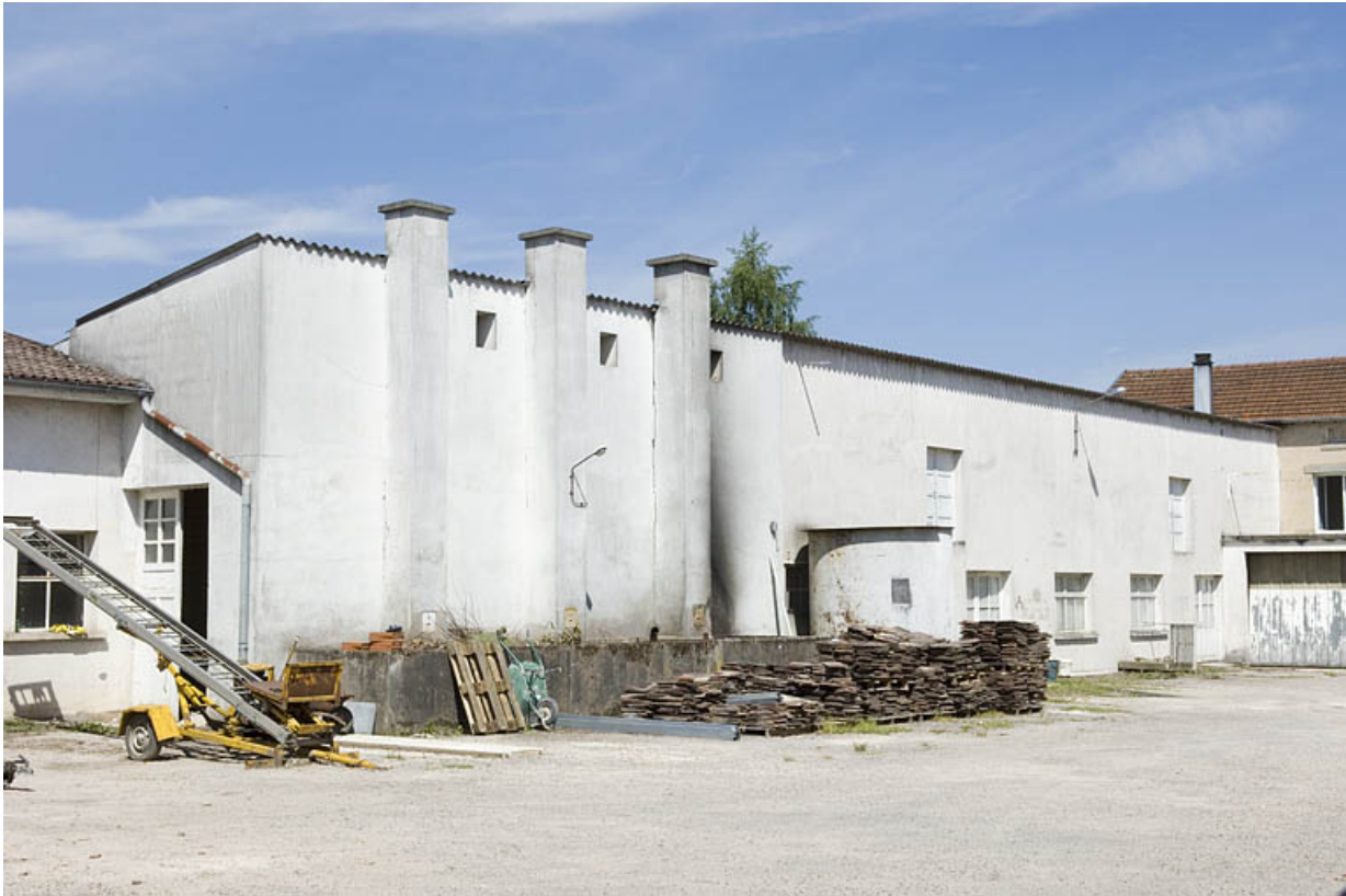
Salle de distillation moderne.

70, Fougerolles, 34, 36 rue du Champ Caillou