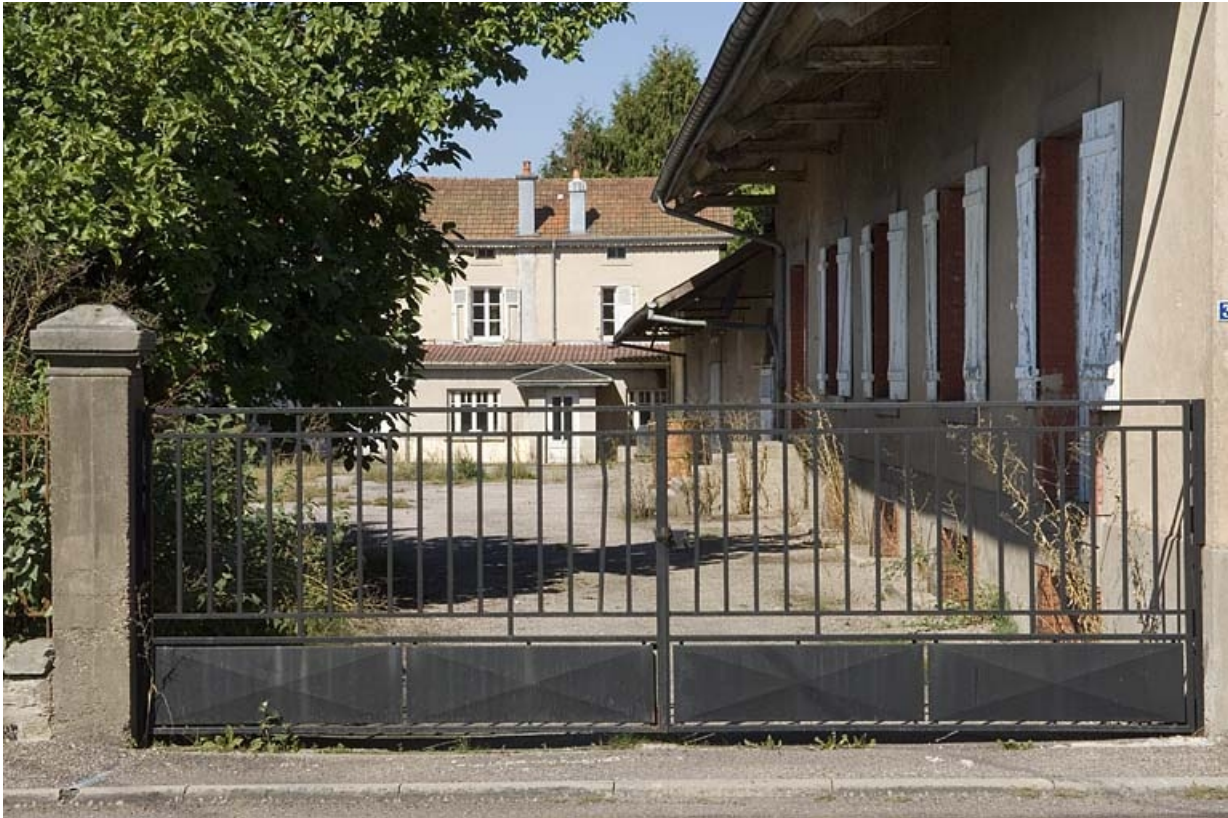
Portail et cour de la distillerie.

70, Fougerolles, 34, 36 rue du Champ Caillou