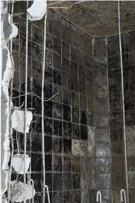
Détail d'une cuve en cours de démolition.

70, Fougerolles, 34, 36 rue du Champ Caillou