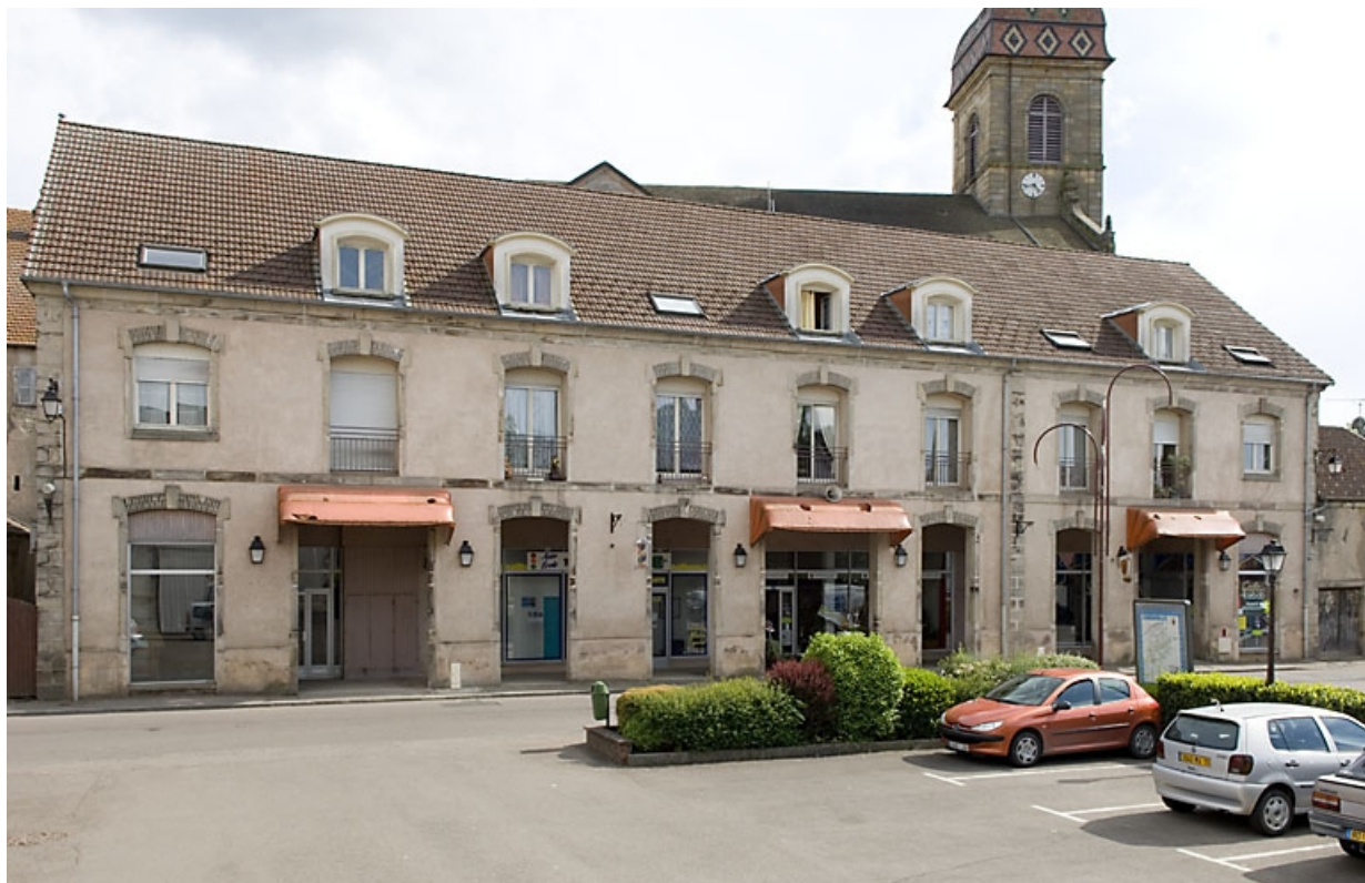
Ancien magasin, tonnellerie et ferblanterie. 70, Fougerolles, 11, 18 à 22 rue du Bas de Laval