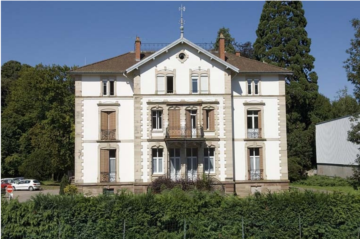
Logement patronal. Façade sud.

70, Fougerolles, 11, 18 à 22 rue du Bas de Laval