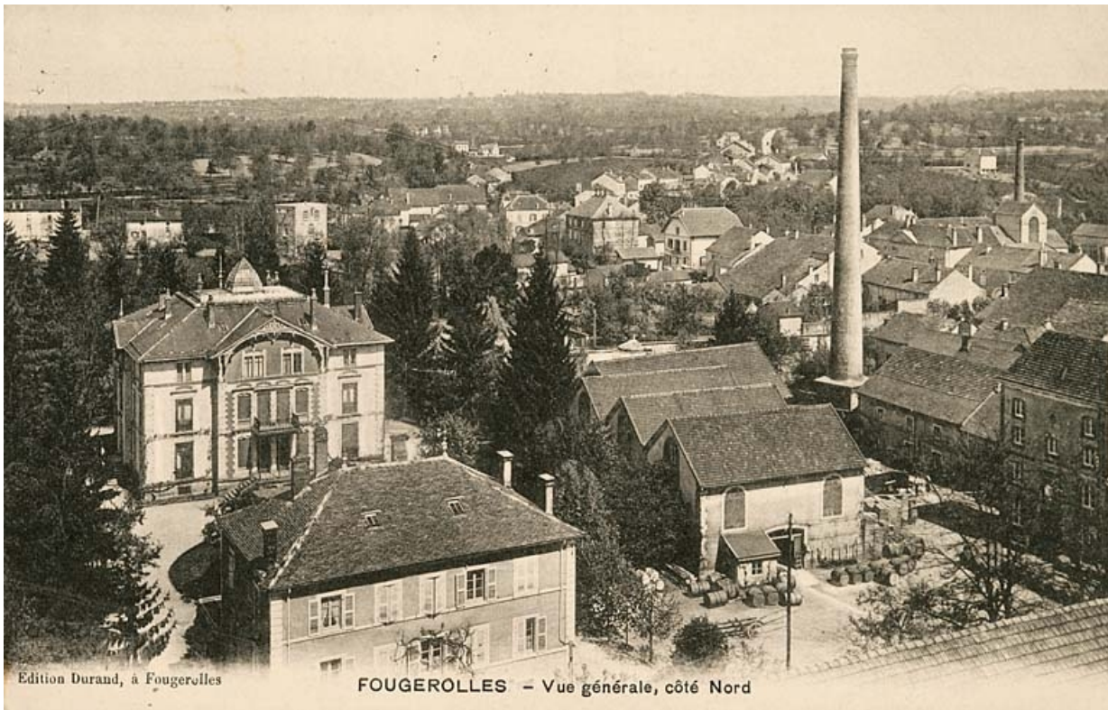
Fougerolles. Vue générale côté nord.

70, Fougerolles, 11, 18 à 22 rue du Bas de Laval