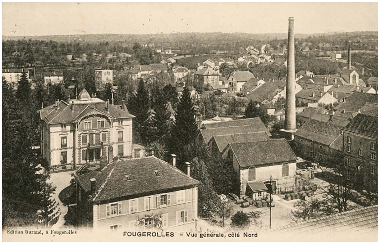
Fougerolles. Vue générale côté nord.

70, Fougerolles, 11, 18 à 22 rue du Bas de Laval