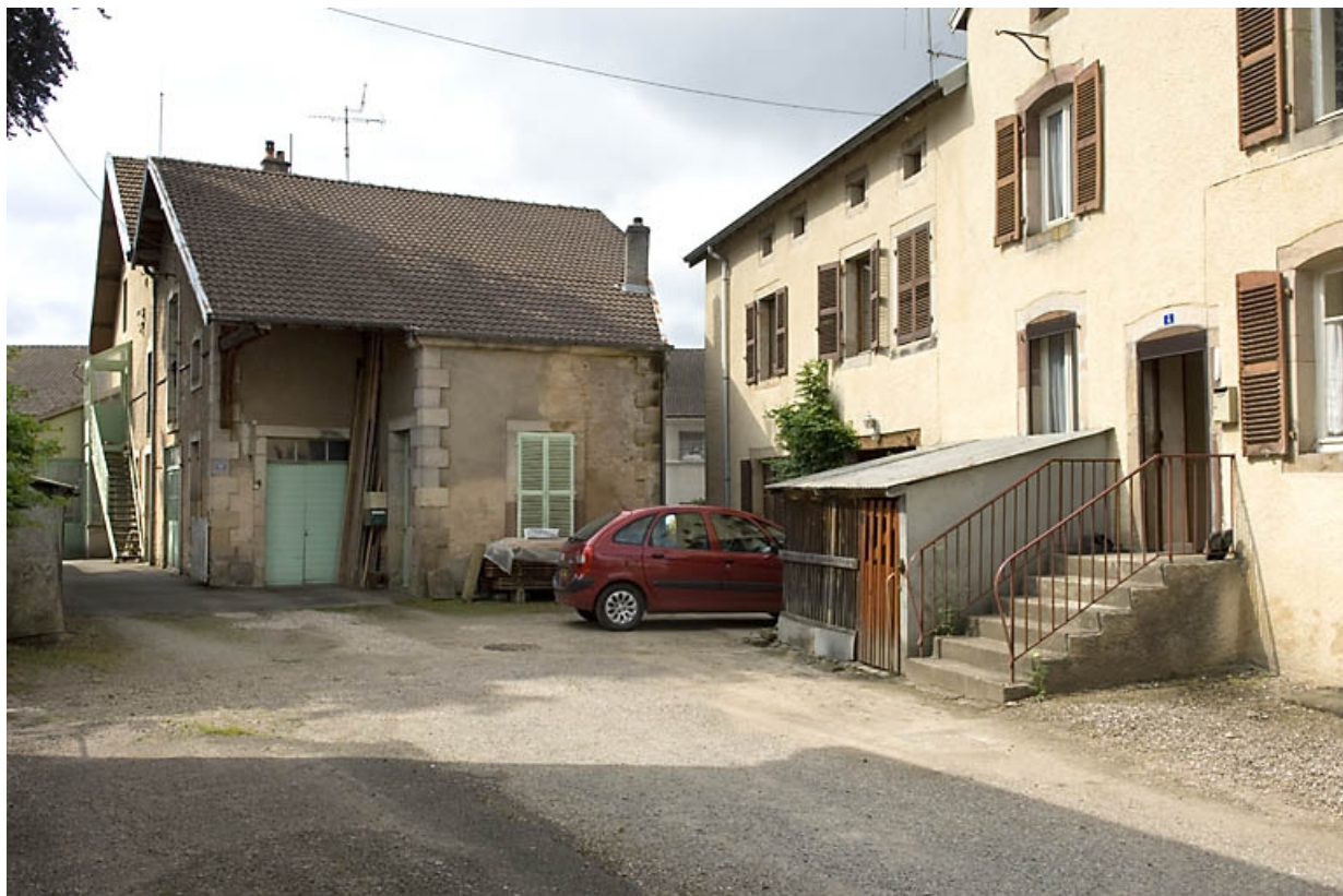
Chai, atelier de distillation et logement.