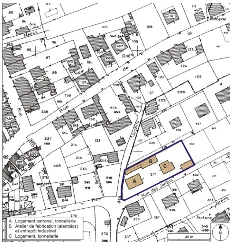
Plan-masse et de situation. Extrait du plan cadastral numérisé, 2008, section AE, 1:1000 réduit à 1:1250. Source : Direction générale des Finances Publiques - Cadastre ; mise à jour : 2008.