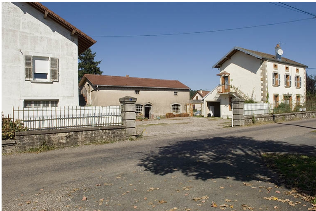
Atelier de fabrication et logements depuis la rue.