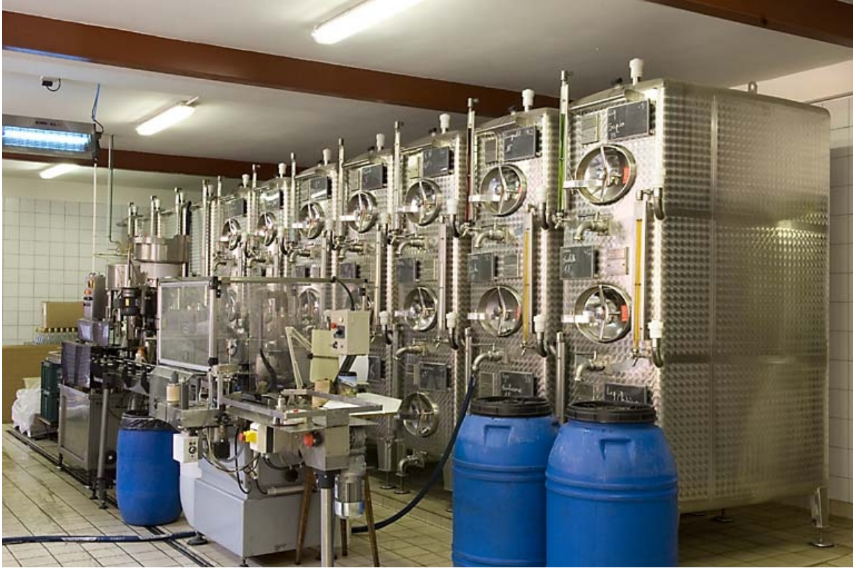
Chai. Batterie de cuves.

70, Fougerolles, 7, 9 rue des Moines Hauts