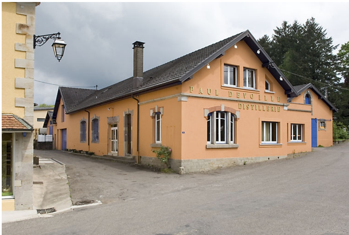
Atelier de conditionnement, chai et bureaux. Vue de trois quarts.

70, Fougerolles, 7, 9 rue des Moines Hauts