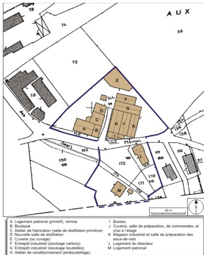
Plan-masse et de situation. Extrait du plan cadastral numérisé, 2008, section AD, 1:1000. Source : Direction générale des Finances Publiques - Cadastre ; mise à jour : 2008.

70, Fougerolles, 7, 9 rue des Moines Hauts