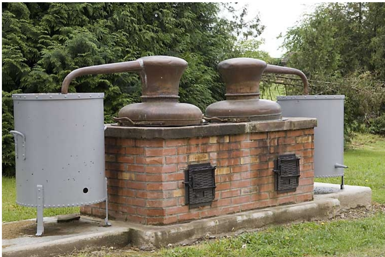
Alambics doubles, à feu nu, exposés à l'extérieur.

70, Fougerolles, 7, 9 rue des Moines Hauts