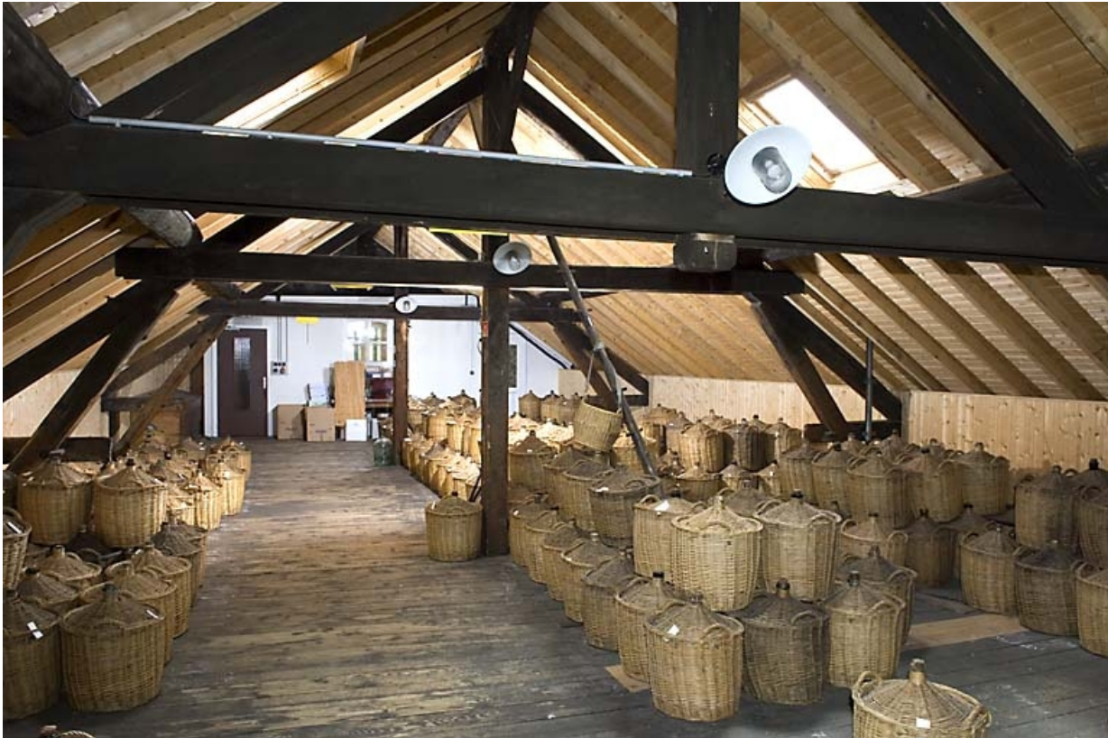
Chai à l'étage de l'atelier de conditionnement (vieillissement des eaux-de-vie en bonbonnes). 70, Fougerolles, 7, 9 rue des Moines Hauts