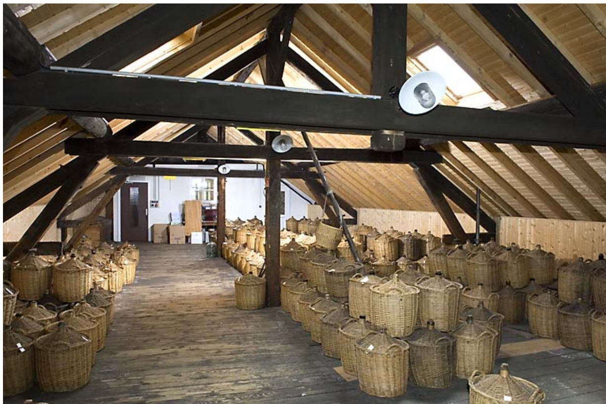
Chai à l'étage de l'atelier de conditionnement (vieillesement des eaux-de-vie en bonbonnes). 70, Fougerolles, 7, 9 rue des Moines Hauts