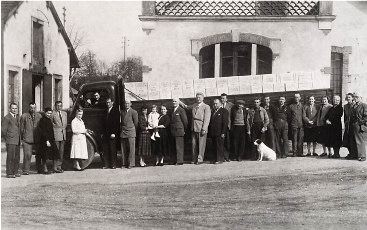
Le personnel de la distillerie.

70, Fougerolles, 7, 9 rue des Moines Hauts