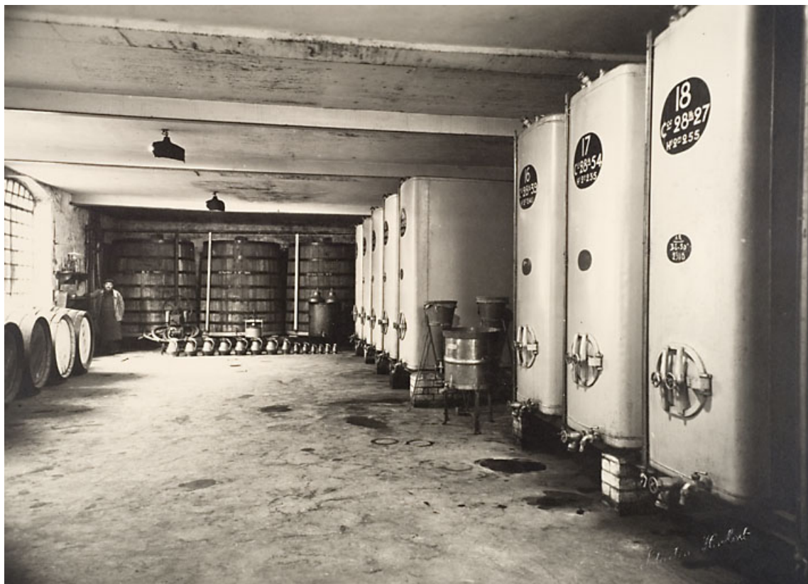
Intérieur de la cuverie.

70, Fougerolles, 7, 9 rue des Moines Hauts