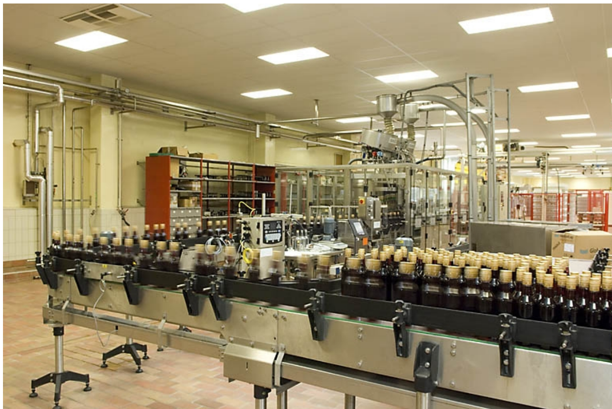
Salle d'embouteillage. Chaîne en action. 70, Fougerolles, 43 avenue Claude Peureux