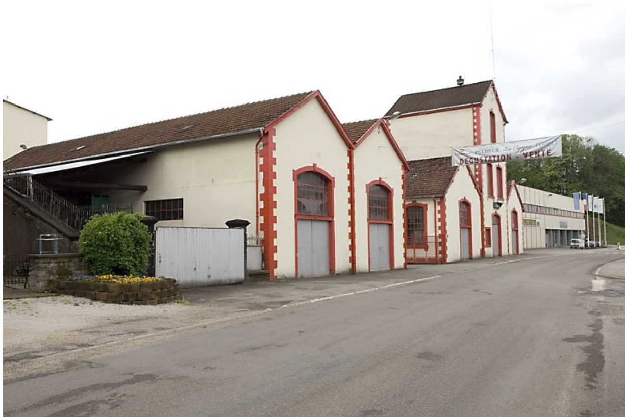
Bâtiments industriels. Vue depuis le nord-est.

70, Fougerolles, 43 avenue Claude Peureux