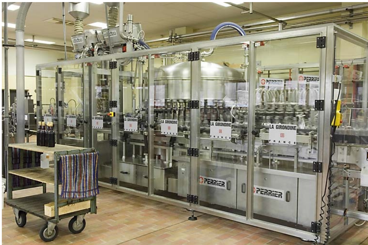
Salle d'embouteillage. Module de nettoyage et de remplissage des bouteilles. 70, Fougerolles, 43 avenue Claude Peureux