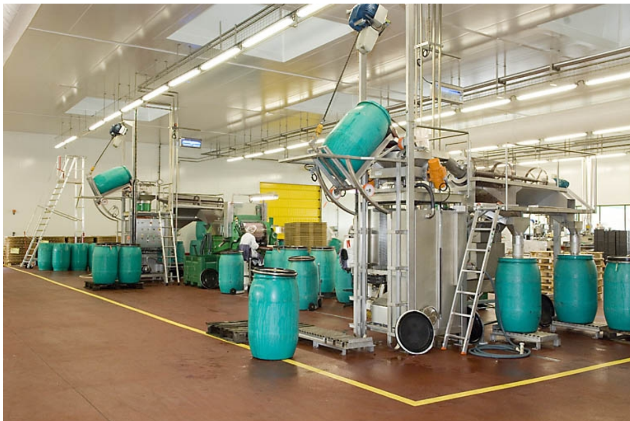
Atelier de calibrage des griottes (salle blanche). Déchargement des tonneaux. 70, Fougerolles, 43 avenue Claude Peureux