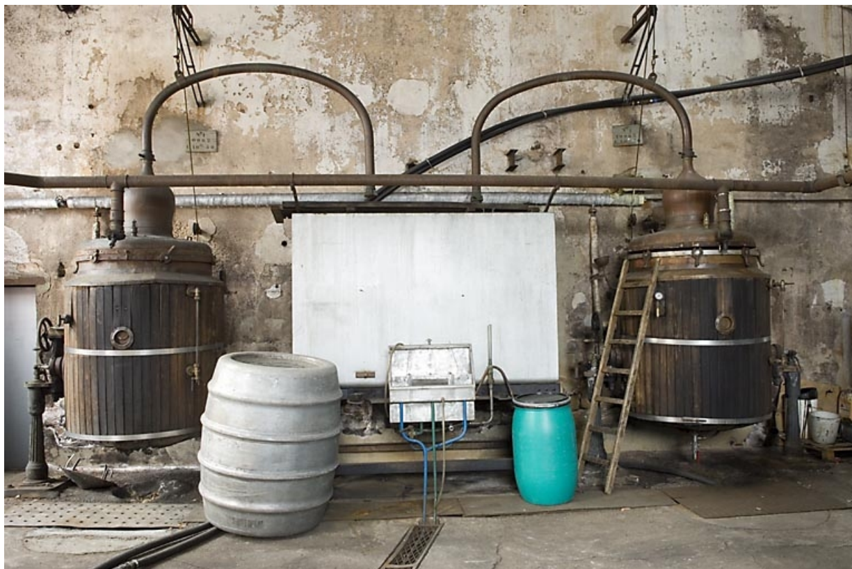
Ancien atelier de distillation. Alambics Egrot-Grangé de 10 hl (mur sud). 70, Fougerolles, 43 avenue Claude Peureux