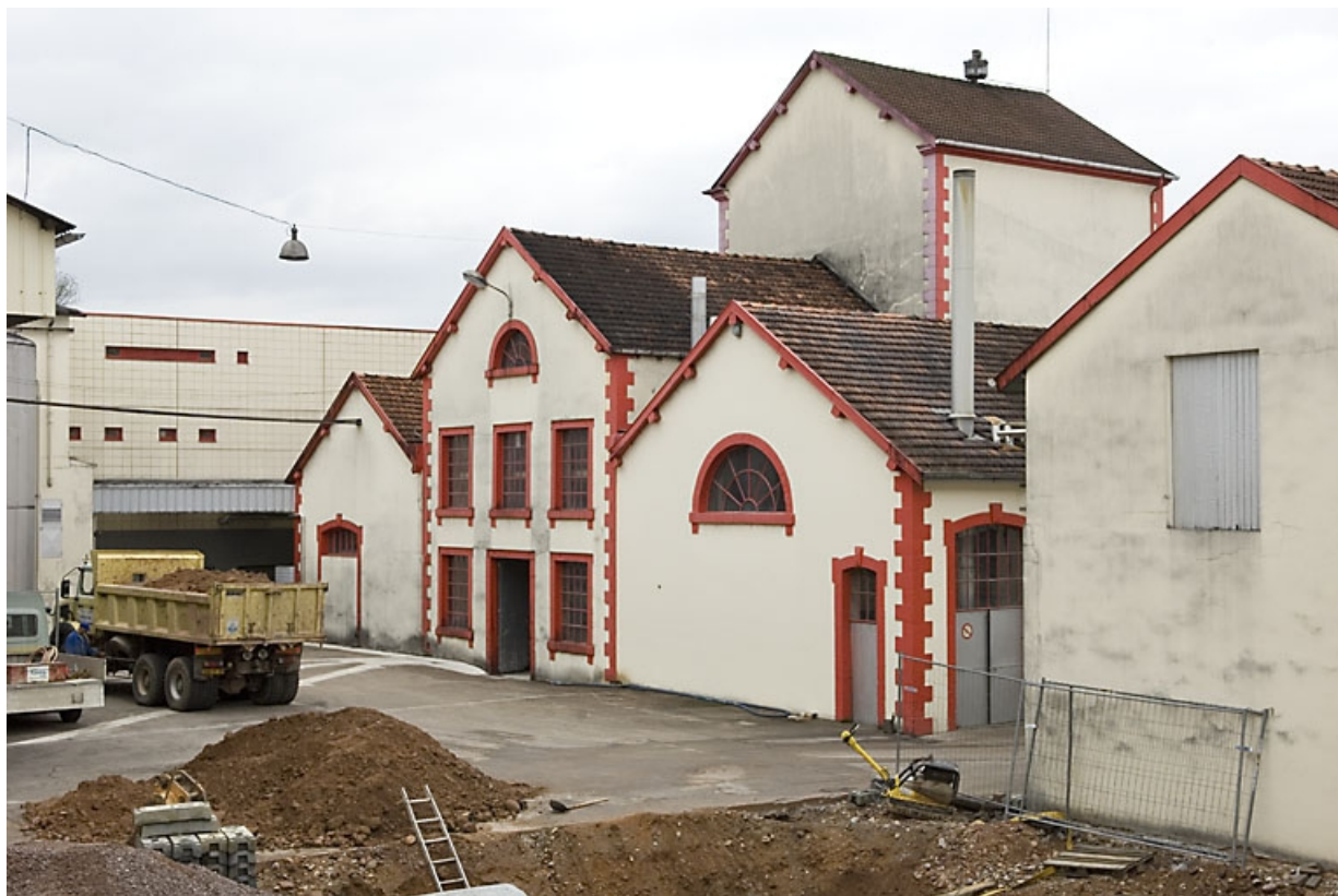
Atelier de fabrication et cuverie. Vue de trois quarts arrière.

70, Fougerolles, 43 avenue Claude Peureux