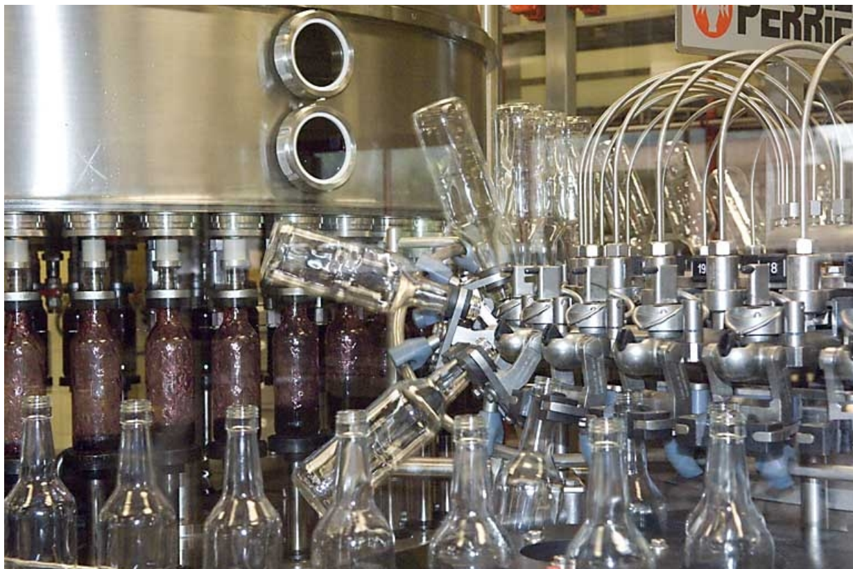
Salle d'embouteillage. Détail de la chaîne. 70, Fougerolles, 43 avenue Claude Peureux