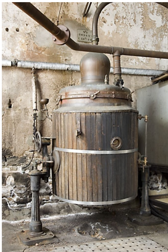
Ancien atelier de distillation. Détail d'un alambic Egrot-Grangé.

70, Fougerolles, 43 avenue Claude Peureux