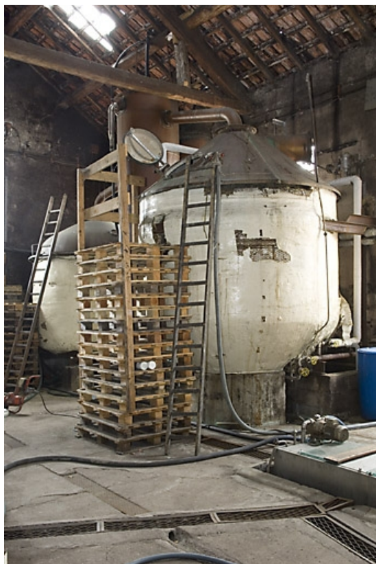
Ancien atelier de distillation. Alambics de 100 hl.

70, Fougerolles, 43 avenue Claude Peureux