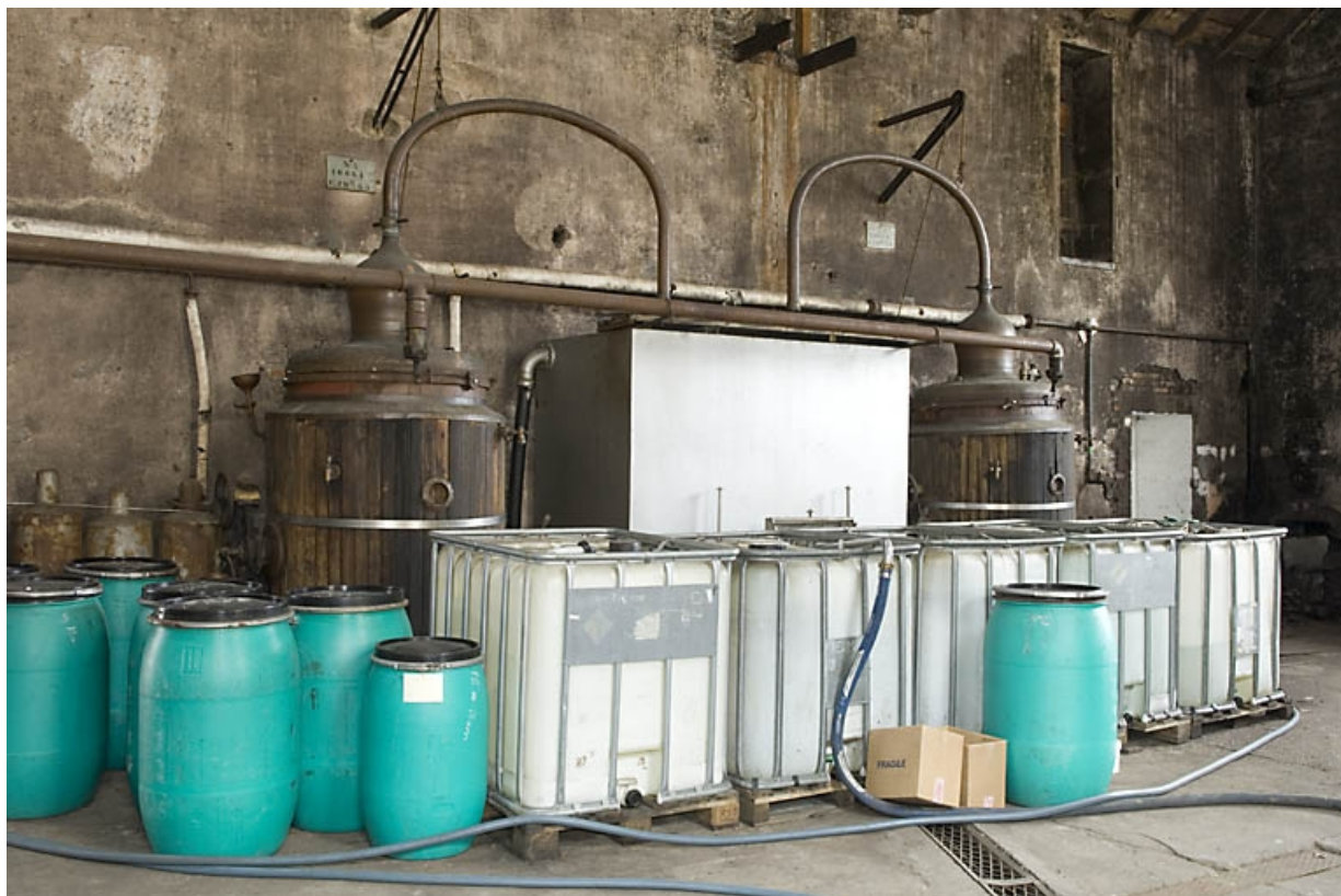
Ancien atelier de distillation. Alambics Egrot-Grangé de 10 hl (mur ouest). 70, Fougerolles, 43 avenue Claude Peureux