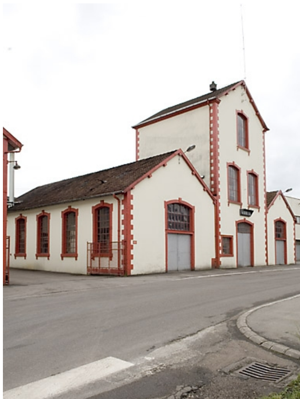
Atelier de fabrication et cuverie. Vue de trois quarts.

70, Fougerolles, 43 avenue Claude Peureux