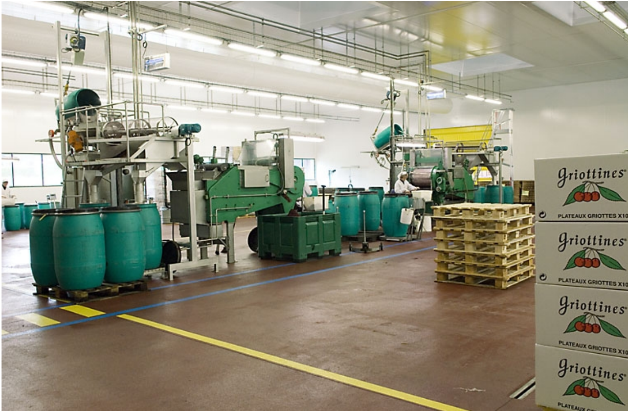
Atelier de calibrage des griottes (salle blanche). Vue d'ensemble.

70, Fougerolles, 43 avenue Claude Peureux