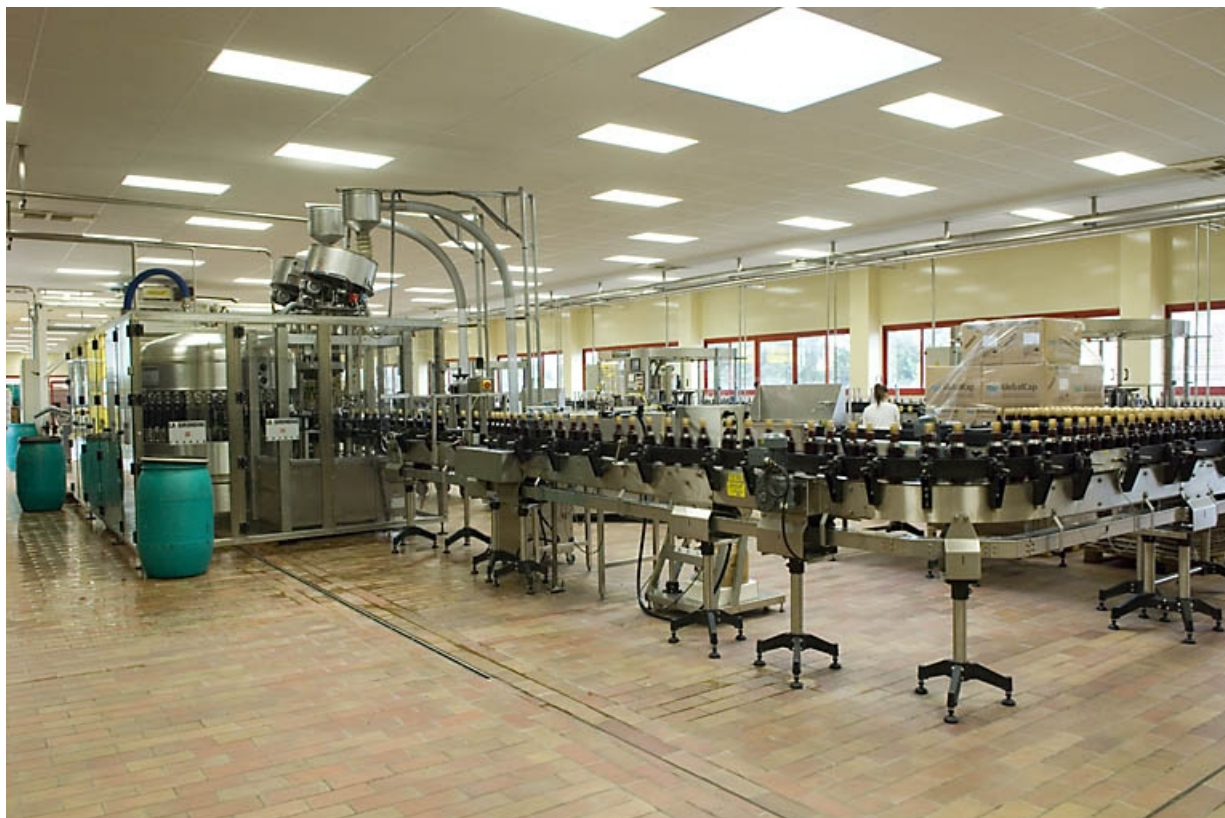
Atelier de conditionnement. Salle d'embouteillage. Vue d'ensemble.

70, Fougerolles, 43 avenue Claude Peureux