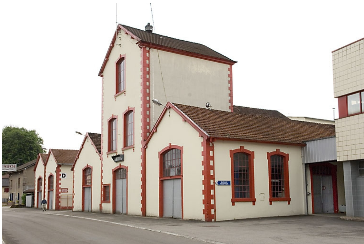
Atelier de réparation et de fabrication, et cuverie. Vue depuis l'ouest.

70, Fougerolles, 43 avenue Claude Peureux