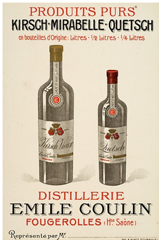
Carte publicitaire de la distillerie Emile Coulin. 70, Fougerolles, 18 rue de Plombières