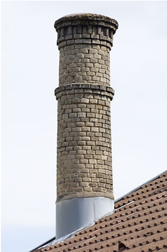
Détail de la souche de la cheminée.