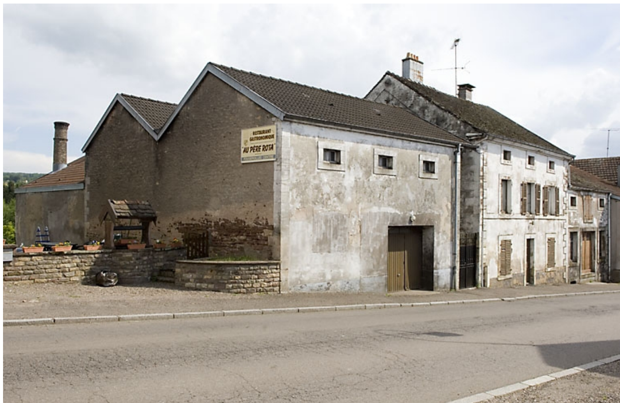
Atelier de fabrication et chai au premier plan, logement au second plan. 70, Fougerolles, 18 rue de Plombières