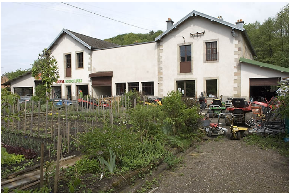
Chai et atelier de fabrication. Vue d'ensemble depuis le sud-est.

70, Fougerolles, 29 rue de Luxeuil, lieudit : Fougerolles-le-Château