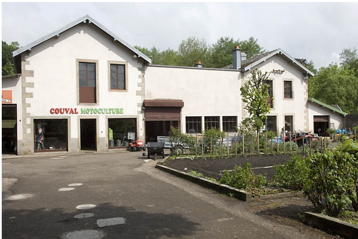
Chai et atelier de fabrication. Vue d'ensemble depuis le sud.

70, Fougerolles, 29 rue de Luxeuil, lieudit : Fougerolles-le-Château