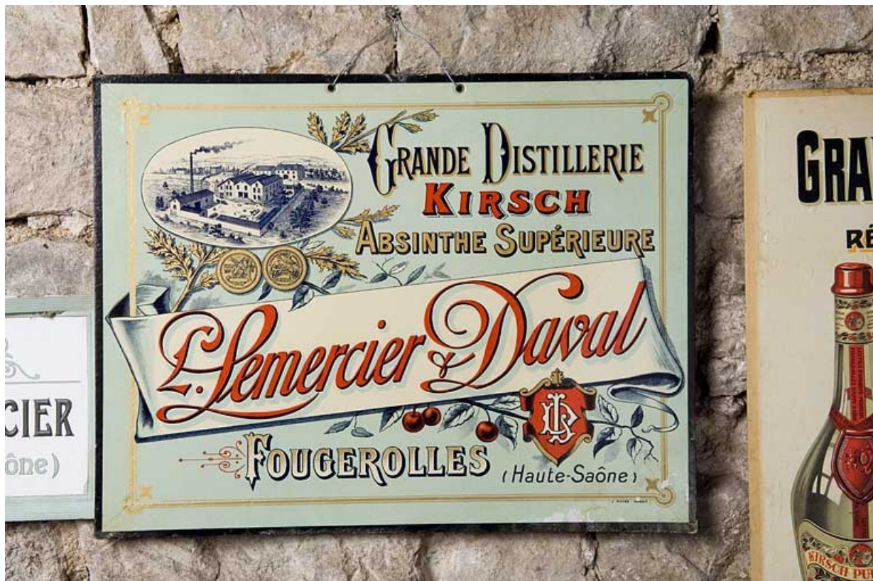
Grande distillerie Lemerrier et Daval 70, Fougerolles, lieudit : le Pré du Rupt